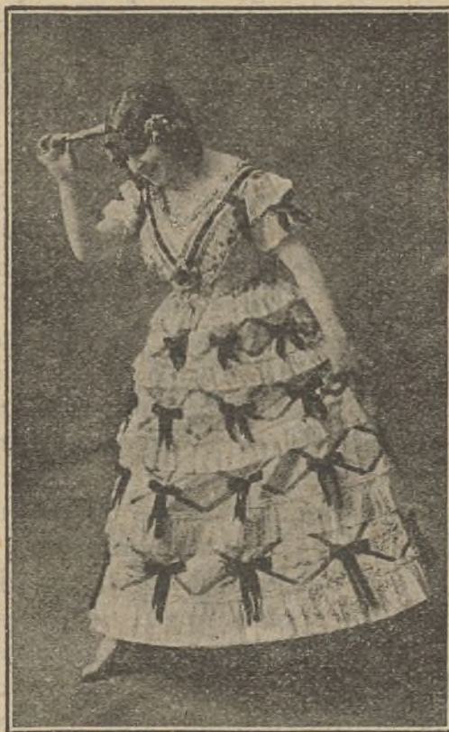
La Goya en «Juan Antón»

El jueves último — y ya comprenderán nuestros lectores que no podemos alcanzar espectáculos celebrados en ese día — debió debutar en Eldorado la compañía de zarzuelas, operetas y revistas de Velasco, con el estreno de Arco Iris , revista que ha hecho furor en América y que ha sido un éxito grandísimo en cuantos teatros españoles la ha representado esta compañía.