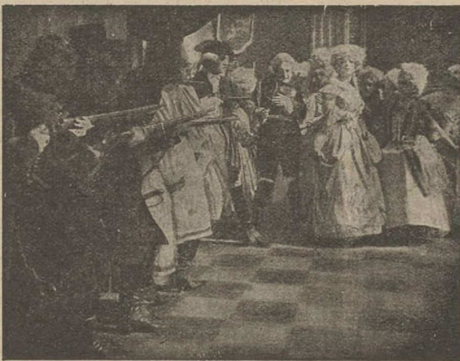
CATALINA LA GRANDE

desafiando la muerte representada por el tren que sale del túnel segundos después que el valeroso salvador. Laura le pide explicaciones sobre la razón de que le dispute la herencia de Stilwell; pero él no puede hacerle confidencias, a pesar de que la ama con un amor que poderosas razones han hecho hasta ahora inconfesable. No obstante, la joven siente renacer su confianza en Juan «Silencio», ante el argumento elocuentísimo de que acaba de salvarle la vida. Al separarse de él para dirigirse a su vivienda que es, desde hace algún tiempo, el oculto retiro de «El Invencible», la detiene un lazo del mismo asesino que al túnel la llevara. Imposibilitada ahora de todo movimiento por recias ligaduras, es puesta cerca de una caja de cartuchos de dinamita, colocada al borde de un terreno que se eleva sobre un barranco y sujeta con una cuerda que llega al fondo de éste, por donde necesariamente ha de pasar Juan «Silencio», quien, pisando sobre el terreno expresamente removido, hará caer la caja de dinamita y quedará sepultado entre las rocas que se desprendan con la explosión. Con el valor de las supremas decisiones, Laura se arrastra hacia la caja, toma entre sus dientes un cartucho de di-