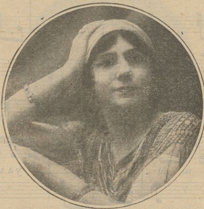
Pastora Imperio, que actúa con gran éxito en Maravillas

¿Cuál puede haber para que pasen los años y las temporadas y Simó-Raso no se acuerde de su genial creación de Los hijos del sol naciente ? ¿Es que irremisiblemente no vamos a verle nunca más crear el prodigioso japonés? ¡No tiene derecho a negarnos esa satisfacción artística! ¿Dificultades circunstanciales?