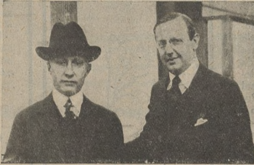
Adolph Zukor, con el primer vicepresidente de la Paramount, Jesse L. Lasky

Para Mr. Zukor este estado de cosas se hacía intolerable. Con la clara visión del verdadero hombre de negocios, previó que el cinematógrafo, a pesar de