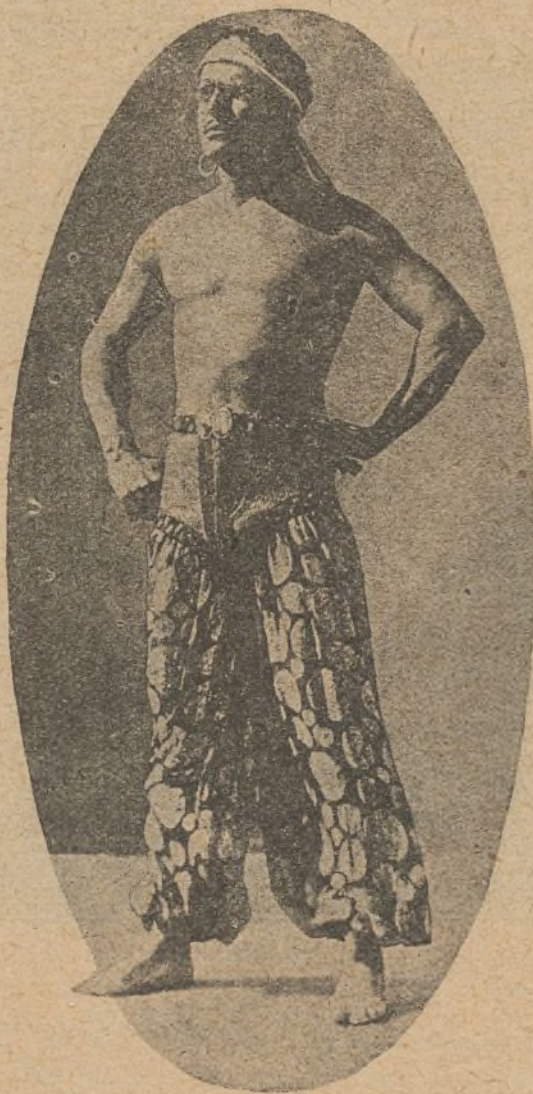
Douglas Fairbanks, profesor de energía

ACTO seguido, se despidió de nosotros, y a campo traviesa se dirigió a pie a los estudios Pickford-Fairbanks, situados en el mis-