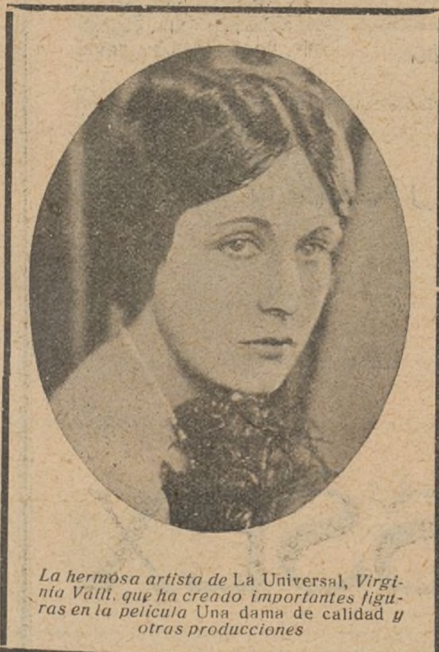
La hermosa artista de La Universal, Virginia Valli, que ha creado importantes figuras en la película «Una dama de calidad y otras producciones».

El joven Medardus. — En el Salón Cataluña tuvo efecto el miércoles la presentación de este film, editado por la Sascha, y cuya exclusiva pertenece al Programa Verdaguer.