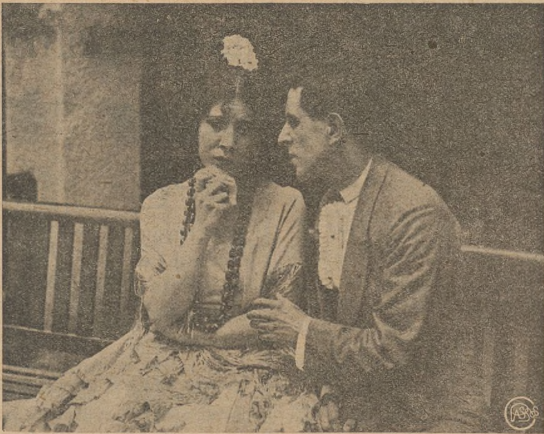
Varillas y Carmela, en una escena emocionante de la película «Rosario, la cortijera», de producción nacional

Tenían como fruto de sus amores una hija llamada Carmela, mocita airosa y de rostro vivaracho. Todo el deseo de los padres de la muchacha era que ésta fuese cortejada por Varillas un muchacho francote pero de un carácter verdaderamente tímido. Además contaban también como otro hijo a un muchacho que adoptaron cuando tenía pocos años y que es en la actualidad un famoso torero apodado el «Rondeño», quién debía la vida al mayoral