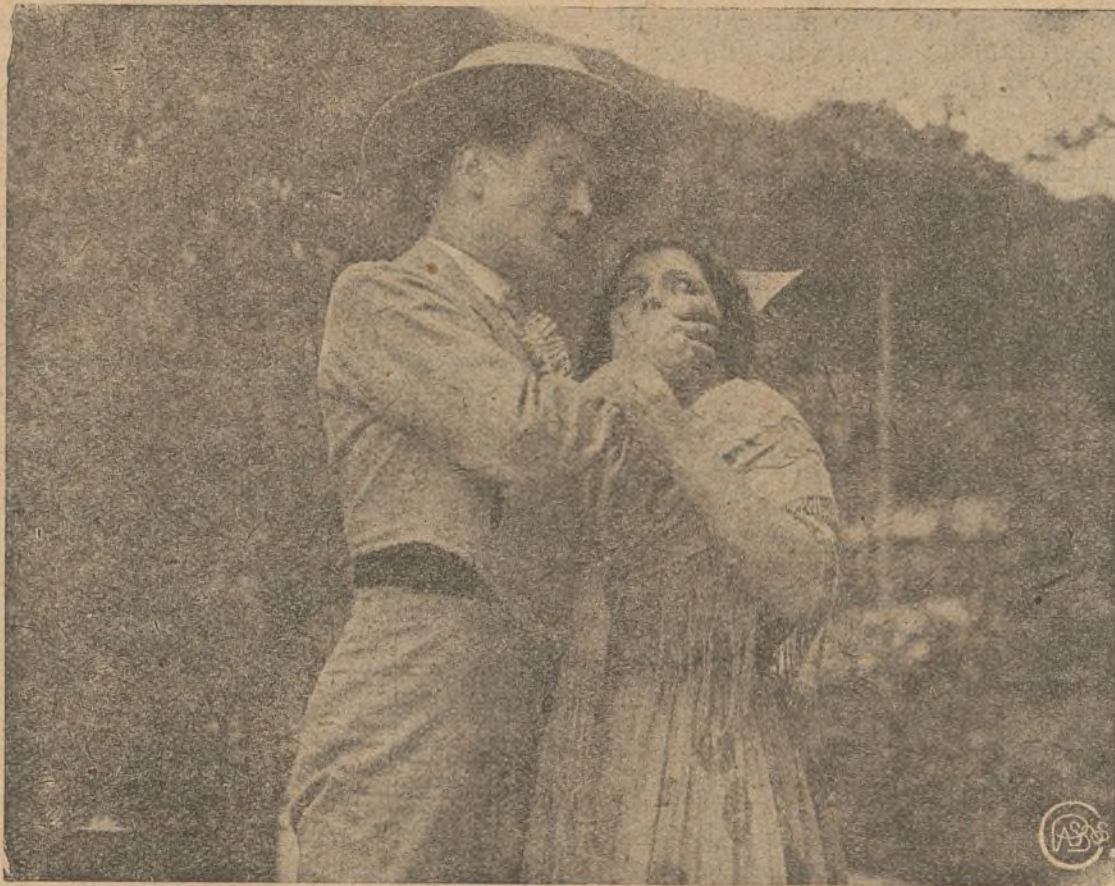
Momento altamente dramático de la película española «Rosario, la cortijera», en que Rafael descubre la pasión de la protagonista por el famoso torero El Rondeño

Alberto que entra en este instante acompañado de su mujer entrega a su padre una carta que para él han dejado al conserje del Hotel. La carta es de Silvia y en