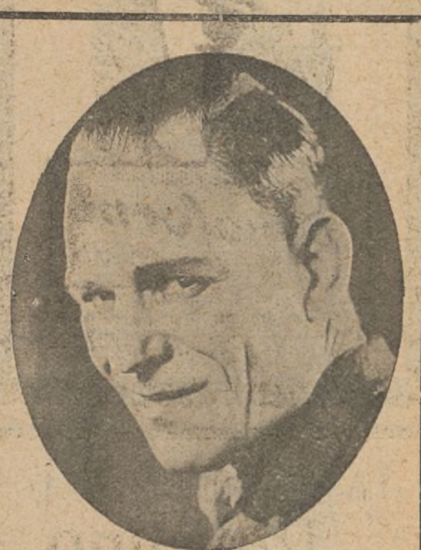
Lon Chaney, intérprete de El jorobado de Nuestra Señora de París, al que ningún actor de la pantalla ha superado en el arte de la caracterización.