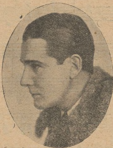
Rex Ingram, hombre de suerte, que a sus excepcionales condiciones de «metteur-en-scène», une la muy envidiable de esposo de la encantadora Alice Terry

Las principales escenas de la película «Hasta el último hombre», de la Paramount, basada en una popular novela del célebre escritor americano Zane Grey, fueron impresionadas en