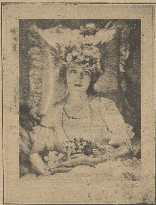
Miss Mary Pickford, cuyas sonrisas se disputa la intransigente «Smart Set» de Nueva York

Wallace Beery, que tiene rostro de criminal, adora a los niños, los pájaros y las flores, como una delicada «miss» de la Quinta Avenida. Su carácter bondadoso le suele hacer blanco de las bromas de Douglas.