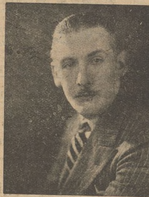
El actor norteamericano Lew Cody, cuya actuación en la película «Almas en venta», ha merecido generales elogios. En ese film Lew Cody estuvo a cargo de un papel importante y ha tenido ocasión de poner de manifiesto su gran talento de intérprete.

«Almas en venta» está admirablemente interpretada por un núcleo de artistas excelentes.