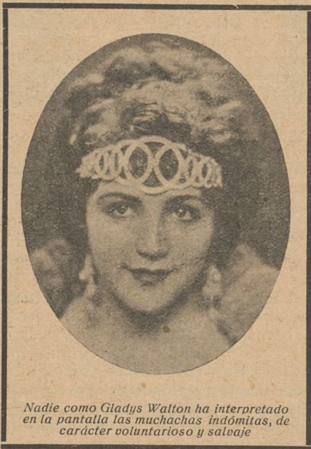
Nadie como Gladys Walton ha interpretado en la pantalla las muchachas indómitas, de carácter voluntarioso y salvaje