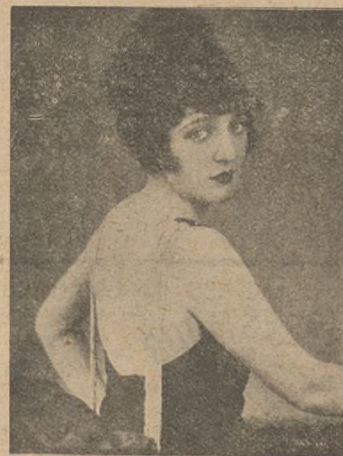
La bella actriz Carmel Myers, está a cargo del papel de heroína en la película «Esclavo de sus deseos», título adoptado por los productores para la presentación en la pantalla de la gran obra de Balzac conocida en España por «La piel de zapa». Esta película, que ha obtenido un éxito rotundo en América, será proyectada próximamente en Francia.

Una noche misteriosa. — Con este título los Artistas Asociados han presentado en el Pathé-Cinema una producción perteneciente al género melodramático en la que abundan la intriga y el interés novelesco, haciendo que no censan lo más mínimo las dos jornadas de que consta la película.