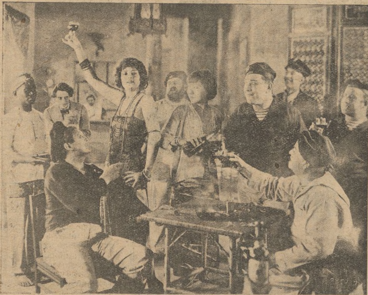
El cafetín de «El Profesor», donde la perversa Lon fomenta el vicio de los contertulios en la película «Borrascoso amanecer»

Cuando la joven llega a los trópicos encuentra a su novio completamente embrutecido e inconsciente. Procura curarlo y, como es natural, la otra mujer, Lon, se pone celosa. Von Brock quiere conseguir a Mary y para lograr su objeto se lleva a