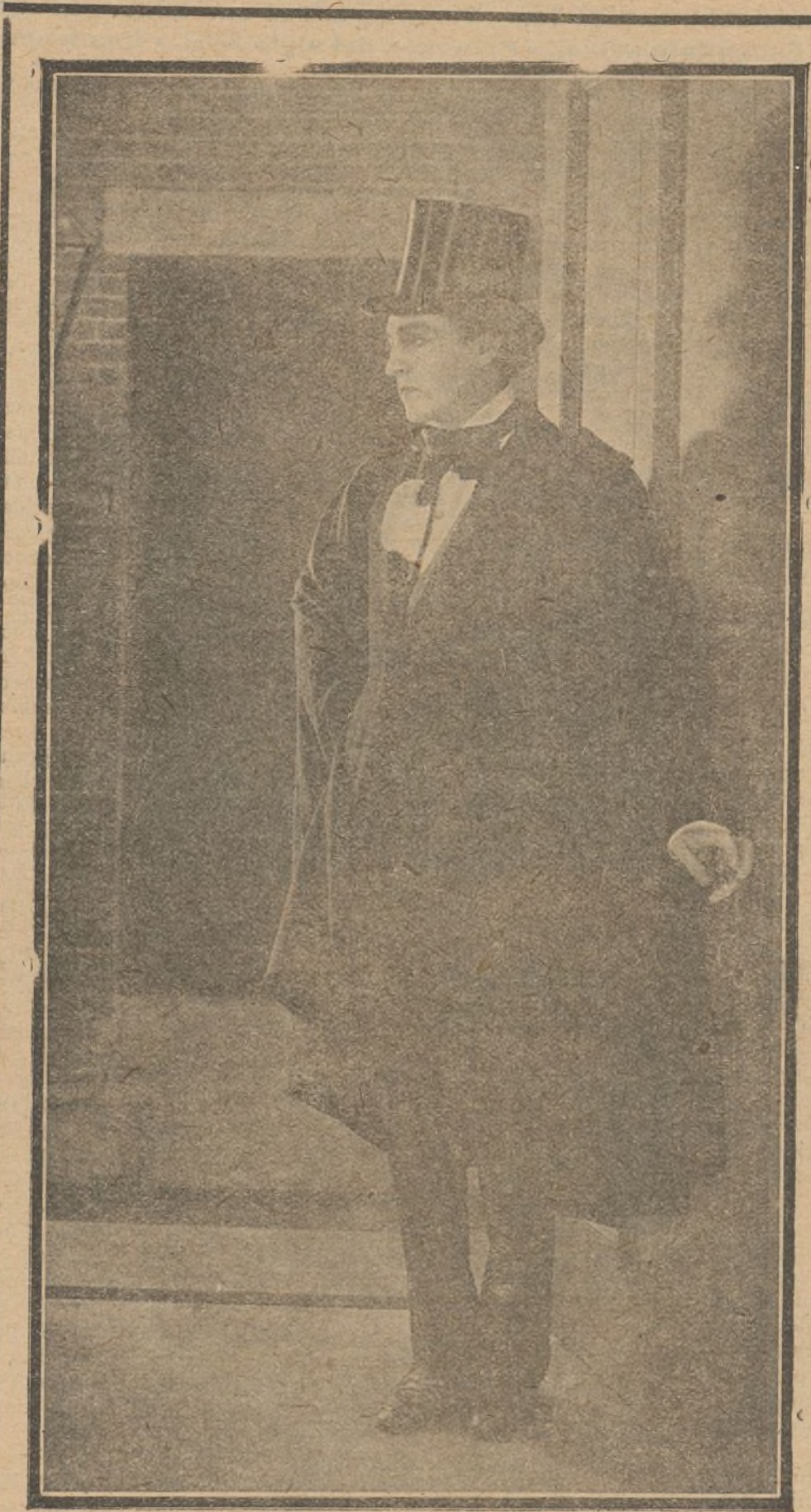
John Barrymore, el más sólido prestigio del arte teatral de Norte América, y notable actor de la pantalla, que ha interpretado maravillosamente las figuras del doctor Jekyll en «El hombre y la bestia», y del popular detective Sherlock Holmes, película que en breve se exhibirá en Barcelona