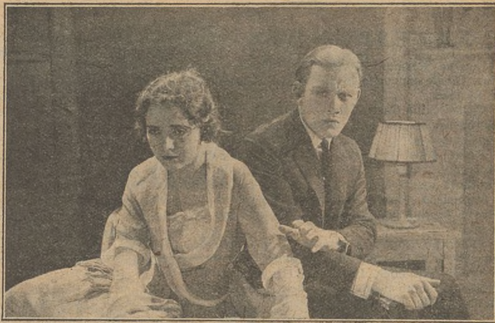
El romántico amor de Silvia experimenta un ruco desengaño ante los deberes profesionales del médico, que absorben toda la atención de su esposo

descarga del pelotón, descubre con crueldad a la cantante, que se había dado contraorden en el sentido de fusilar a Don Diego. Rosita, presa de odio y de dolor, acude al lugar en donde se ha desarrollado la terrible escena. Sobre el inanimado cuerpo de Don Diego, Rosita pide a su esposo una palabra siquiera que indique que la víctima ofrece todavía señales de vida. Pero todo intento es vano. Y con el corazón traspasado por duelo indescriptible, la