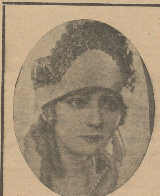
En el firmamento cinematográfico aparece Winifred Bryson como nueva estrella de primera magnitud

El sábado por la mañana se proyectó en sesión privada la primera jornada de esta gran producción. Es este uno de los mejores films realizados por la Goldwyn Cosmopolitan, que ha sido presentado por sus concesionarios exclusivos Vilaseca y Ledesma, S. A.