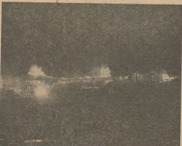
Una de las escenas más culminantes de la película «Almas en venta». Para obtenerla, la Goldwyn Cosmopolitan gastó varios miles de dólares, pues hubo que prender fuego a todo un circo. El efecto fotográfico, en la pantalla, es admirable

Las primeras armaduras para niños hechas en América fueron las que lucen Dawn O'Day y un grupo de niños, montados en sendos «po-