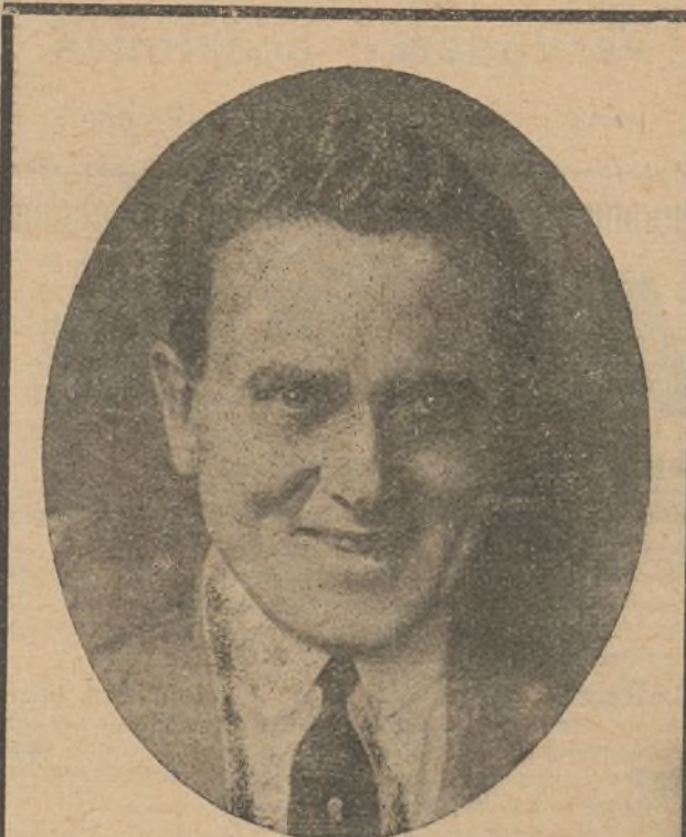
Herbert Rawlinson, ídolo de los públicos de América y Europa, por sus creaciones de hombre honrado y leal

Es esta una producción perfecta y muy notable, que demuestra una vez más a lo que puede llegar la producción nacional.