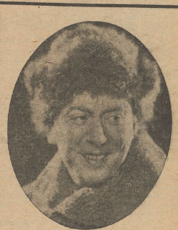
En el elenco de la Universal ocupa lugar privilegiado el conienzado actor House Peters, creador de «La tormenta» y «Corazones humanos»

Salón Cataluña y Pathé Cinema. — Se estrenó el film documental «En el misterioso fondo del mar», que atrajo numerosa concurrencia, y se ha proyectado con éxito la hermosa comedia «Lorna Doone», adaptada de una conocida novela inglesa.