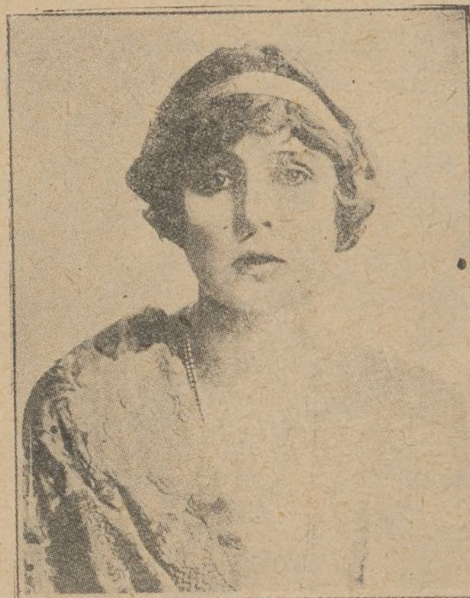
Lady Diana Manners, hija del duque de Rutland

Al conocer Lady Diana el deseo de la Reina,