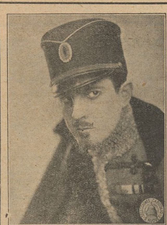
Las admiradoras del joven actor Ramón Novarro le reconocerán fácilmente con bigote, perilla y monóculo, tal como caracteriza a Rupert de Hentzen en «El prisionero de Zenda»

Ruzafe. — Debutó la novel tiple Amparito