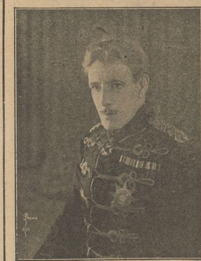
El gran actor Lewis Stone, que triunfó plenamente en sus interpretaciones de «El virtuoso» y «Mujeres frías»

El domingo se estrenó «Todos los hermanos fueron valientes», drama de gran emoción.