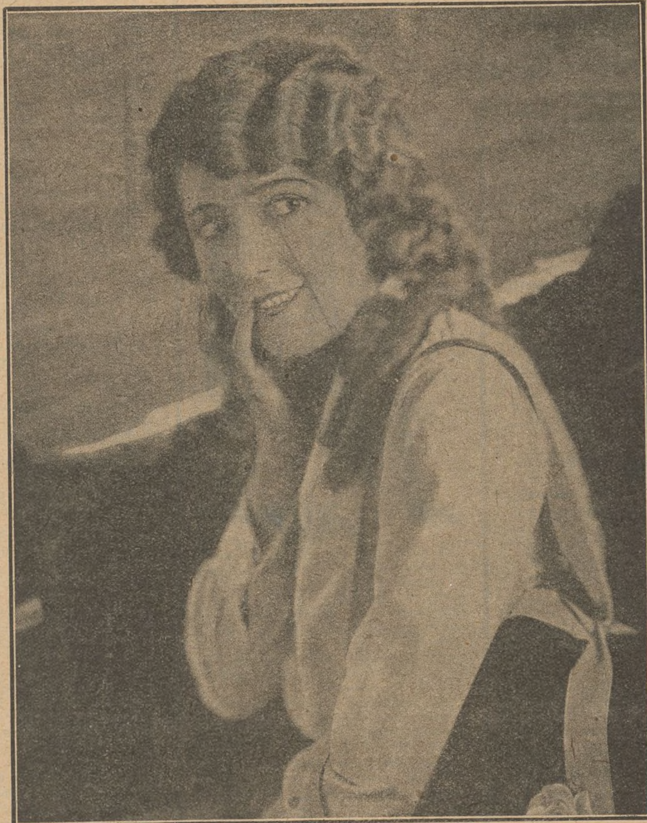
La figura de Mary Pickford, siempre de actualidad, ha adquirido estos días mayor relieve con motivo de su creación en «Rosita, la cantante callejera»

Aunque por regla general las muchachas que desempeñan papeles de menor importancia en las películas suelen proveerse de ropa ellas mismas, en los estudios de la Paramount existe la costumbre de entregarles los trajes, a fin de que éstos se ajusten a la última moda.