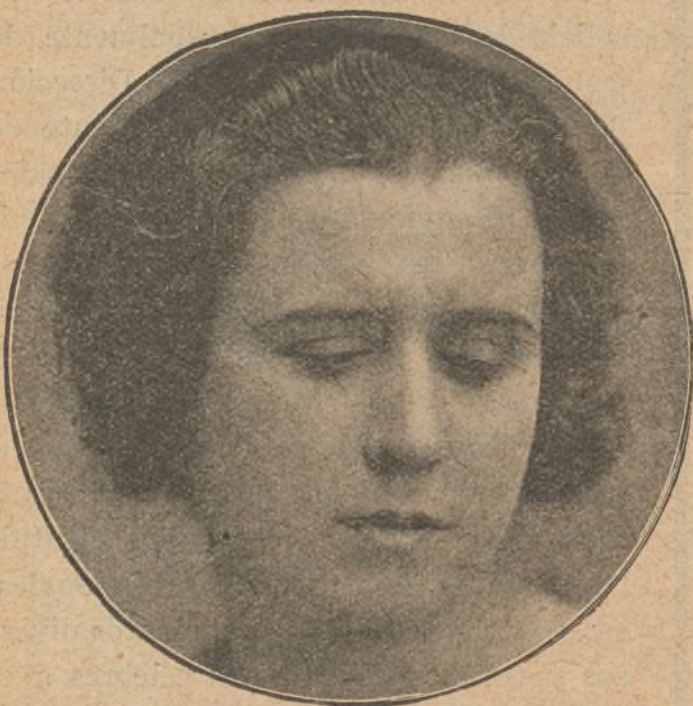
La tristeza meditabunda de las graves preocupaciones del espíritu...

Esto es, amables lectores de EL CINE, cuanto yo os puedo contar.