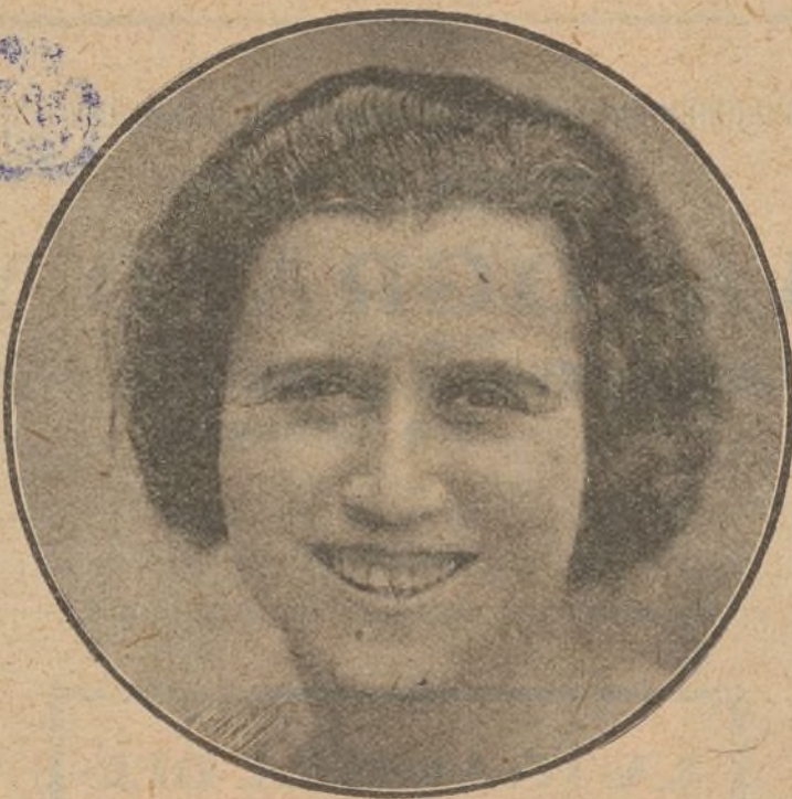
La risa franca, que denota un temperamento sano y leal...

De niña, mis ratos más felices se los debo al teatro. Viendo o leyendo comedias y disfrazándome y hablando delante de los espejos, gozaba yo de una sana ale-