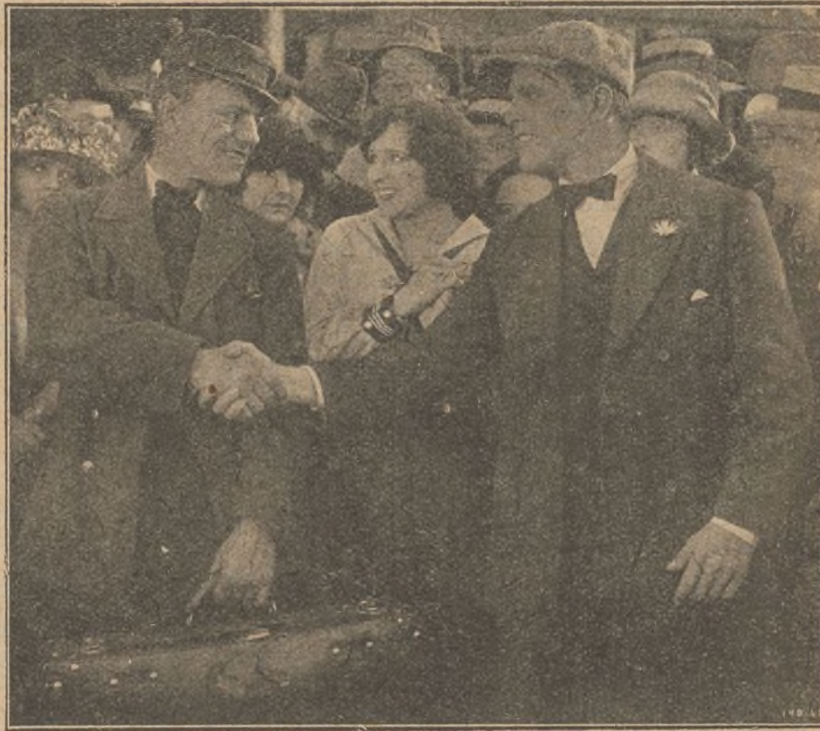
Lon Chaney, el admirable trágico de la pantalla, colabora con la gentil Billie Dove y el joven actor Mc Gregor en la interpretación de «Todos los hermanos fueron valientes»

Durante la noche ambos hermanos se entrevistan en la cabina de Julio, y Marcos cuenta a éste, a propósito de su misteriosa desaparición, que, al saltar