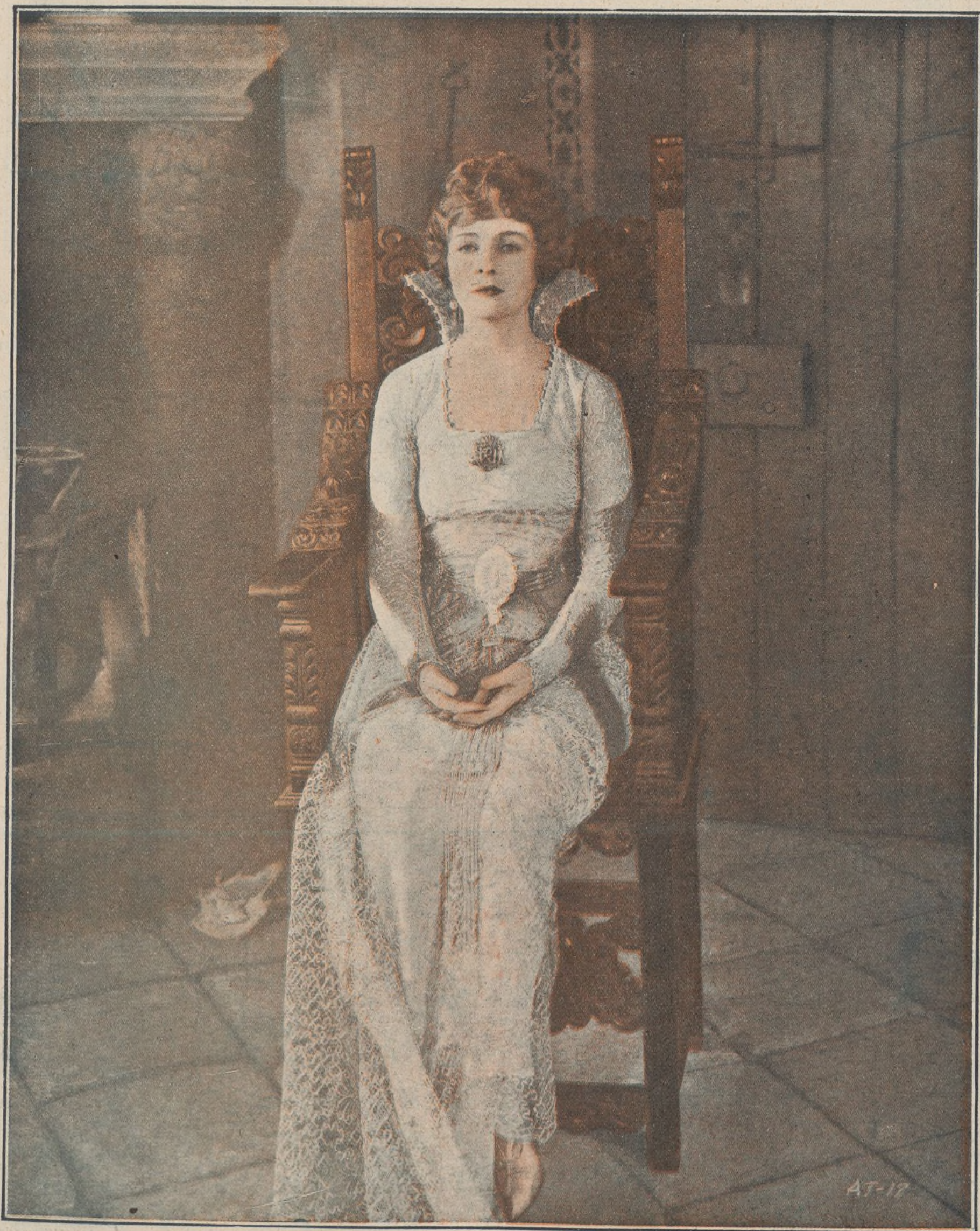
ALICE TERRY, delicada y espiritual artista, intérprete de la gran producción «El prisionero de Zenda», de la marca Metro, y perteneciente al acreditado programa Selecciones Capitolio