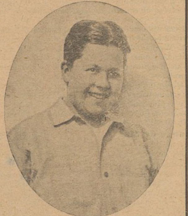
Buddy Messinger, uno de los jóvenes artistas cinematográficos de más brillante porvenir

Teatro Novedades. — La exclusiva de la acreditada casa Gaumont «La portera de la fábrica»,