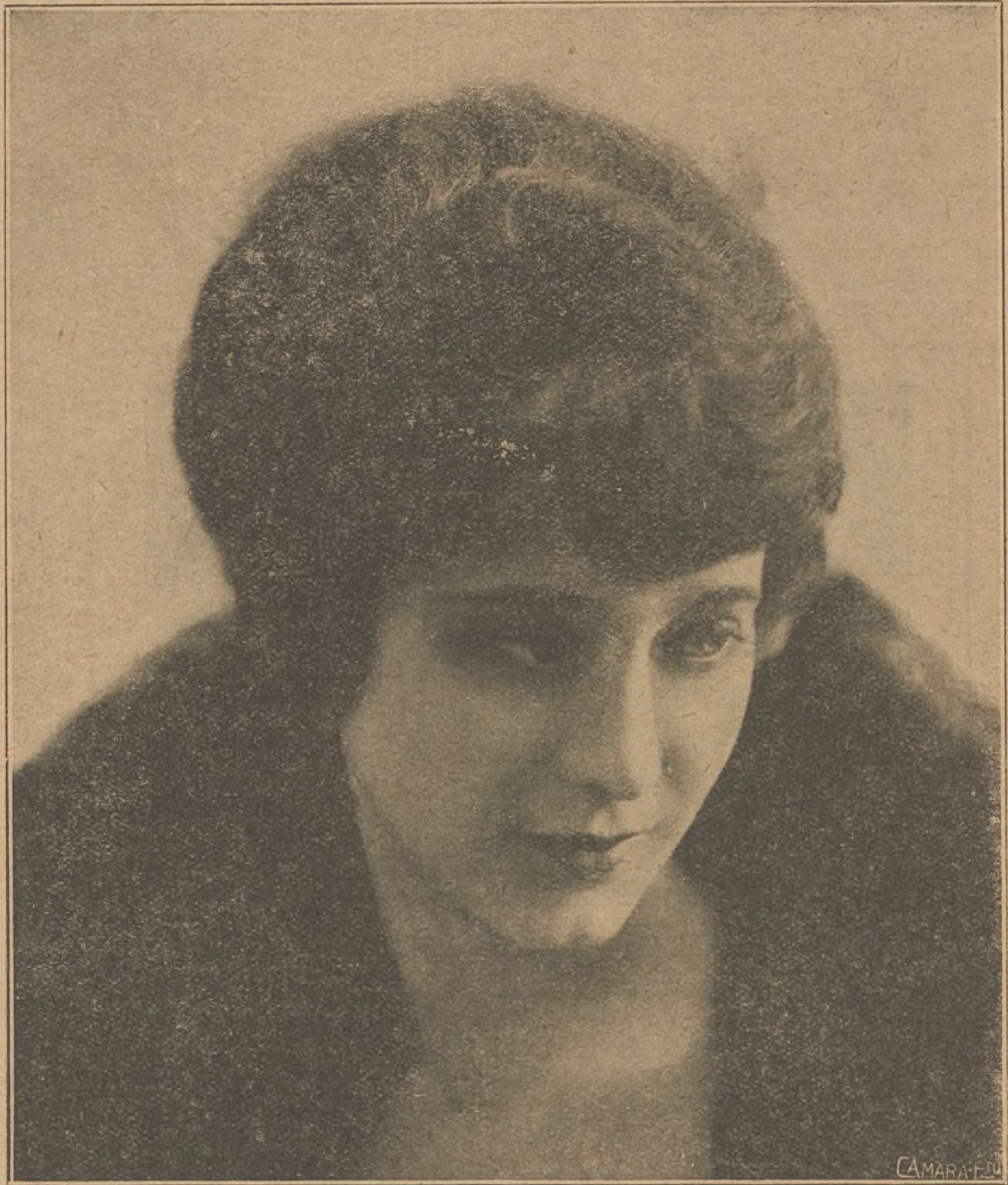
Elsie Ferguson triunfa en la pantalla no solo por su talento de actriz, sino también por la distinción de su figura y la elegancia de sus «toilettes»

Rodolfo Valentino regresó de su prolongado viaje a Europa a principios de enero y a los