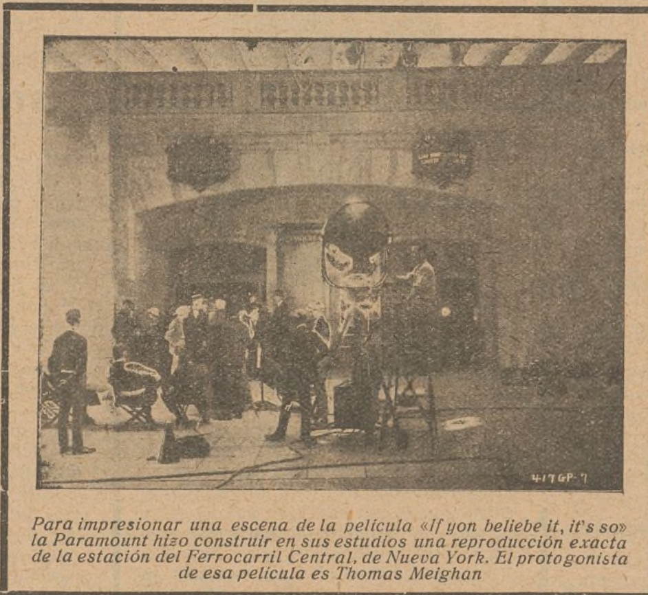
Para impresionar una escena de la película «If you believe it, it's so» la Paramount hizo construir en sus estudios una reproducción exacta de la estación del Ferrocarril Central, de Nueva York. El protagonista de esa película es Thomas Meighan

Para algunas escenas se utilizó un alumbrado de diez mil amperes representados por 70 proyectores, un centenar de arcos voltaicos y 25 grandes plafones de lámparas de mercurio.