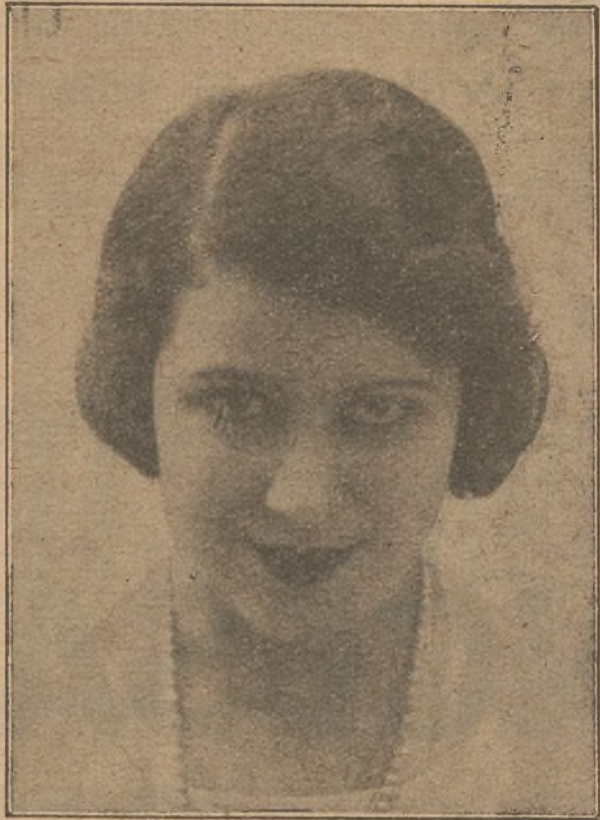
Goletera, notable y hermosa bailarina española