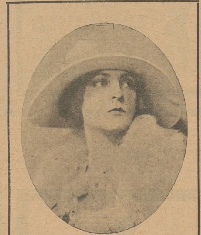
En Priscilla Dean nos cautivan, al mismo tiempo, la artista admirable y la mujer bella y seductora

Coliseum. — Se estrenó un drama policíaco de gran interés, que agradó extraordinariamente al público, y que se titula «La casa del mis-