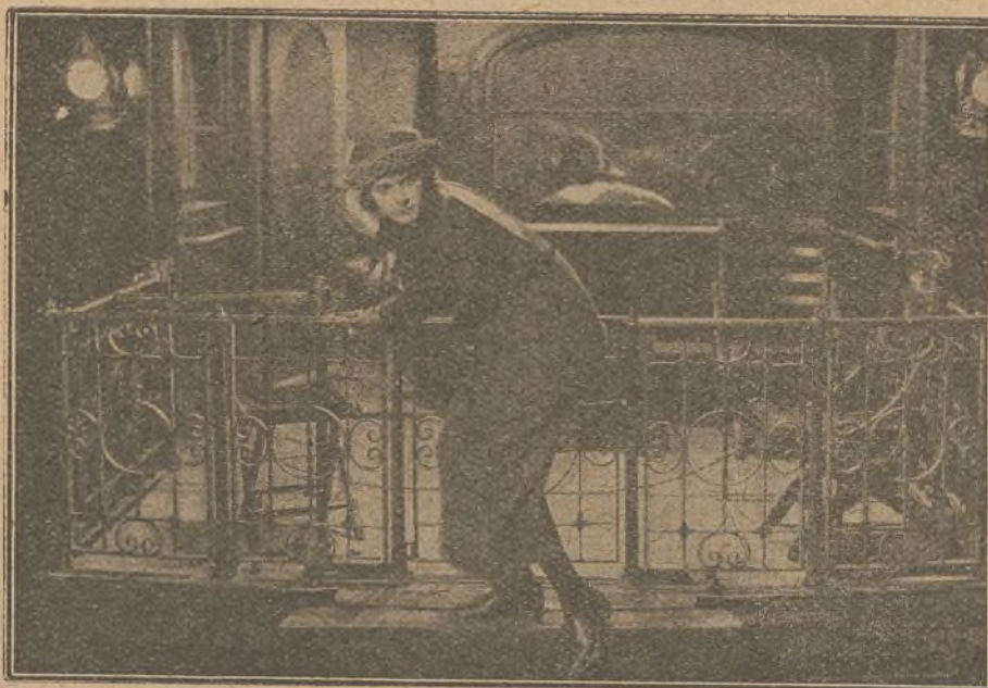
Interesante momento en que comienzan las aventuras de la protagonista de «Almas en venta»

Frank Mayo es nieto del célebre artista de teatro del mismo nombre, y debutó ya de pequeño al lado de su abuelo. Después de una larga carrera teatral, todo lo que se refiere a la pantalla le interesa vivamente, y opta finalmente por el cine. Enamorado de la bailarina Dagmar Godowsky, se casó con ella. En «Almas en venta» representa el galán