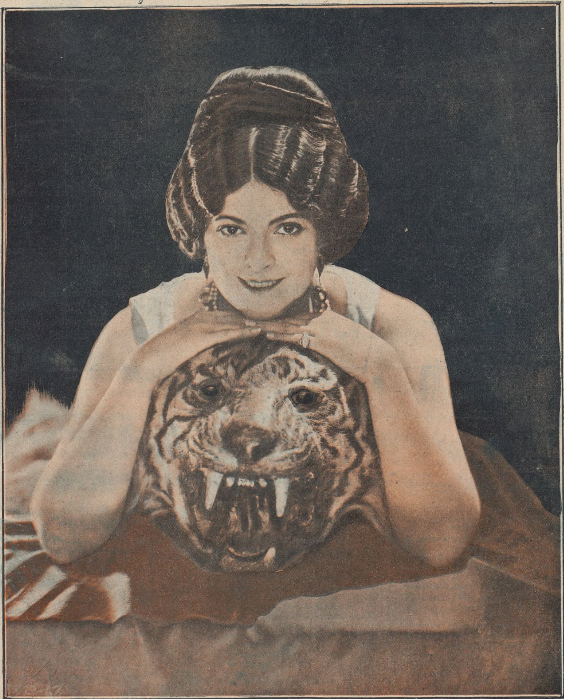
PRISCILLA DEAN, la más preclara «estrella» de la Universal, en su nueva creación, «Tigre blanco», estrenada días pasados con tan brillante éxito, que ha constituido un triunfo definitivo para la bella actriz. En breve será presentada «Con la corriente», otro de los grandes éxitos de esta incomparable artista