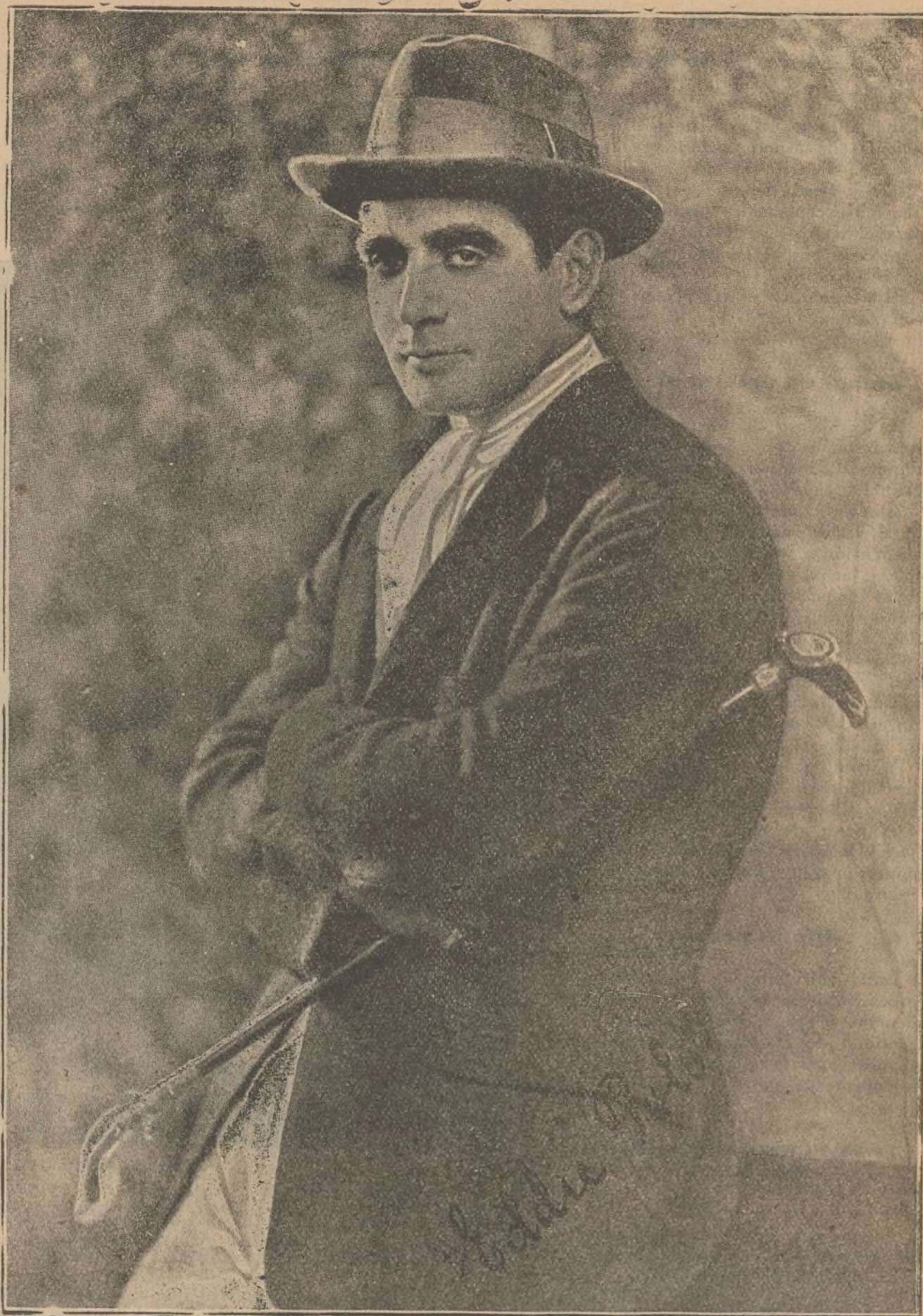
El famoso atleta y actor cinematográfico Eddie Polo, que acaba de actuar en el teatro Goya de Barcelona, y que se propone realizar una tournée por España

Al pedirle nosotros su opinión sobre la producción española, nada pudo decirnos por no haber visto hasta la fecha ninguna película editada en nuestro país. ¿Será esto cierto, o será tal vez un gesto de delicadeza por no confesar lo pobre y deficiente de nuestra producción? Si es lo primero, constituye para nosotros una vergüenza, pues demuestra palpablemente lo difícil que es programar nuestras cintas en el extranjero, y si la causa de su mutismo fué por no herir nuestra susceptibilidad, agradezcamos al inteligente