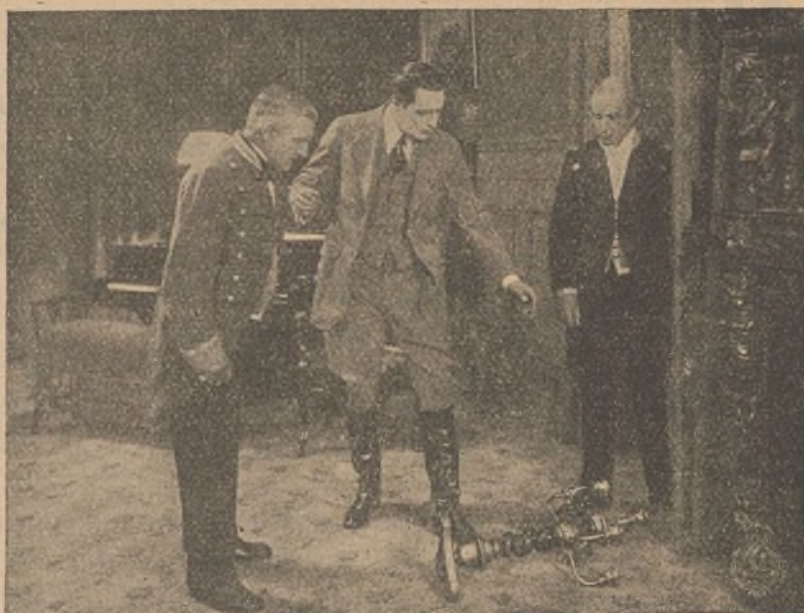
Interesante escena de «Espejos del alma», que llamará la atención por su argumento

No se llamaba así, sino Sonia Mirko, y era hija del conde Mirko. Cuando la muerte llamó al