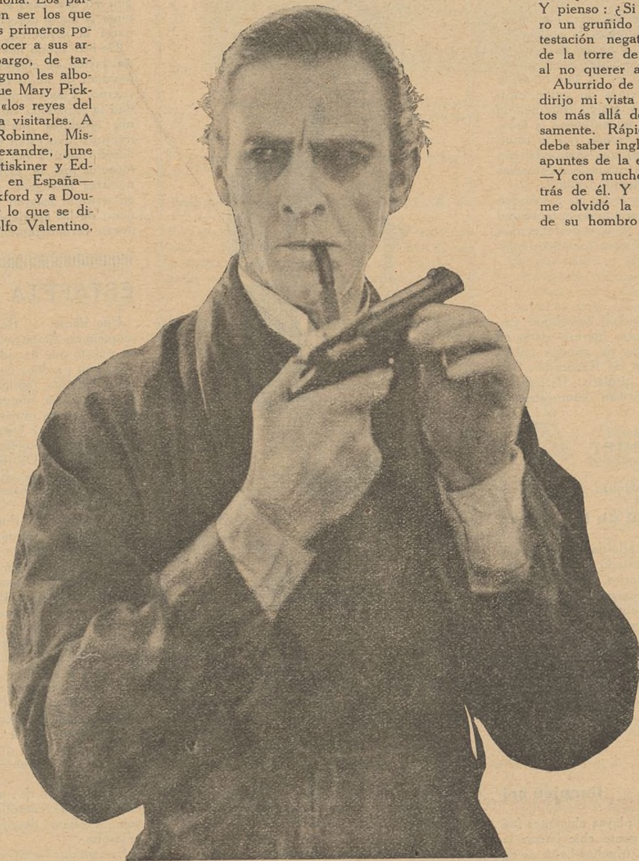
El ilustre actor John Barrymore en la película «Sherlock Holmes»

—¿Quién? ¿Esos simpáticos películeros?—Yo