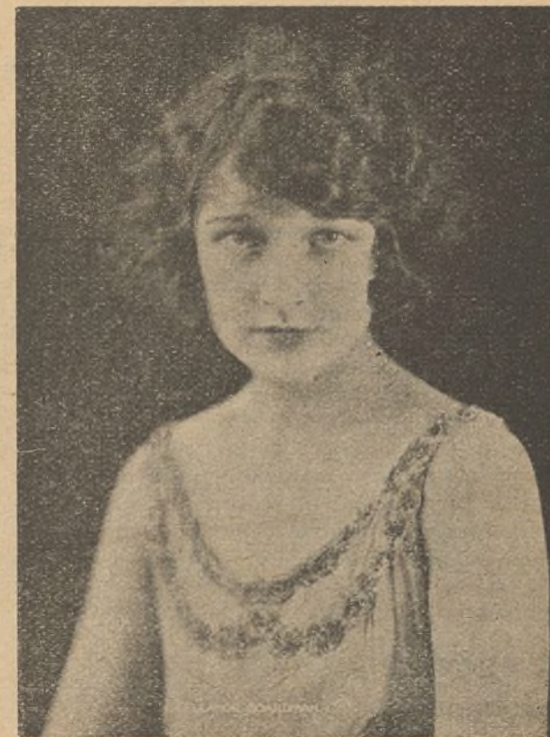
La bella actriz Eleonor Boardman, estrella del film «Almas en venta», película que presenta la intimidad de los estudios

La Atlántida ha trasladado sus oficinas a la calle Comandante Fortea, núm. 2, en donde empezarán a filmar varias películas, entre ellas «Rejas y Votos», segunda parte de «Carceleras», «La hija de Malasaña» y otras.