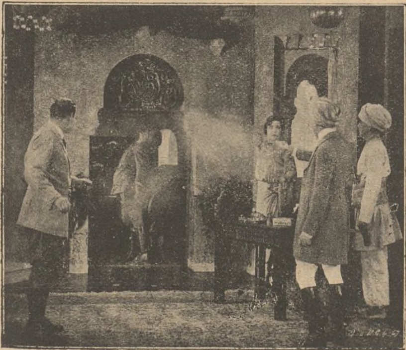
Una escena de la original película «La diosa verde»

Y cuando el populacho ahoga con voces de rabia las súplicas de la mujer enamorada, se oye súbitamente en el espacio un ruido bronco, lejano, que deja consternados a todos aquellos fanáticos. Es una escuadrilla de aviadores ingleses, dispuesta a bombardear los dominios del Rajah quien, para evitar que sea aniquilado su reino, da la libertad a los prisioneros.