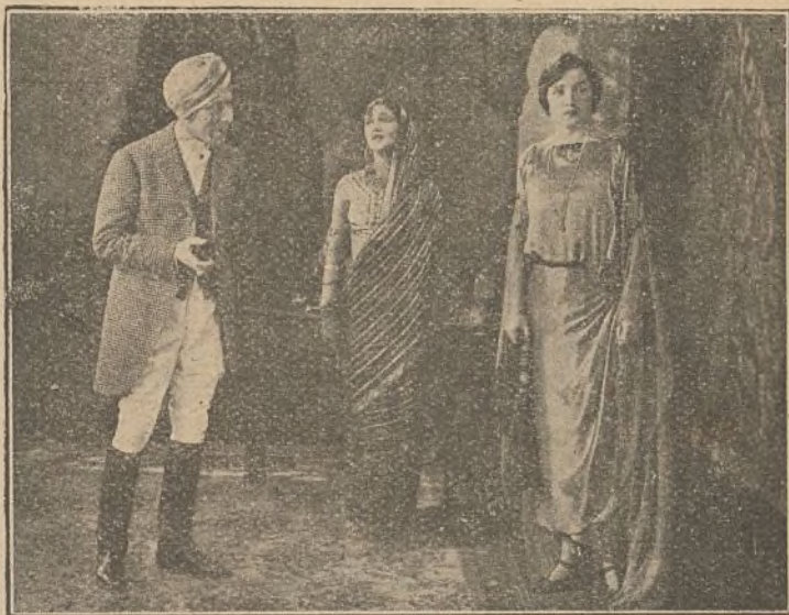
Otra escena de la «La diosa verde»

De pronto Crespín oye pasos en el corredor y acelera la llamada a la esta-