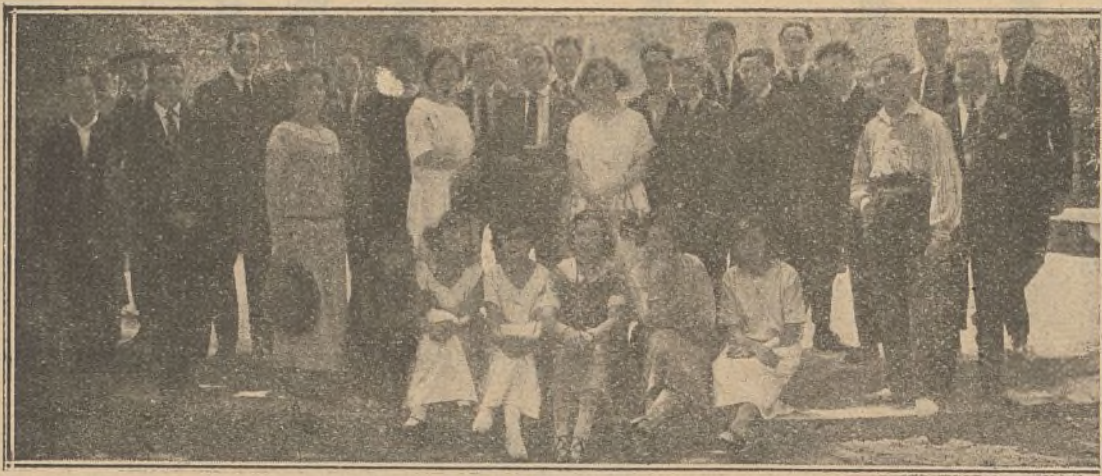
En esta fotografía aparecen unos estuasiastas amigos de Barcelona pertenecientes a Grupo Excursionista, durante una de sus primeras excursiones

Se encarece la asistencia de todos los amigos de la S. E. A. C.