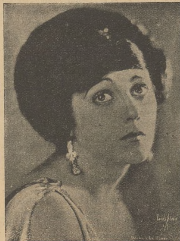
La famosa «star» Barbara La Marr, en la curiosa película «Almas en venta», film que ha merecido los elogios unánimes de los principales críticos americanos y europeos