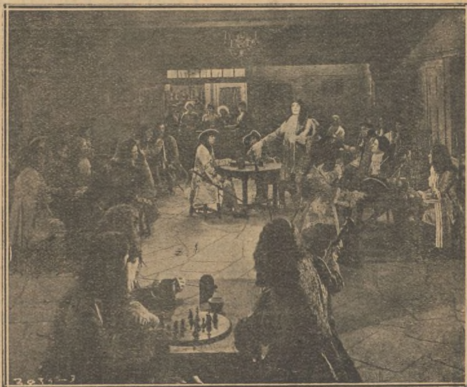
Clorinda, vestida de varón, frecuenta los lugares donde los jóvenes de la ciudad suelen reunirse.

Sir Oxen desea ver a Clorinda y aprovechando la oportunidad de que el duque de Osmonde se