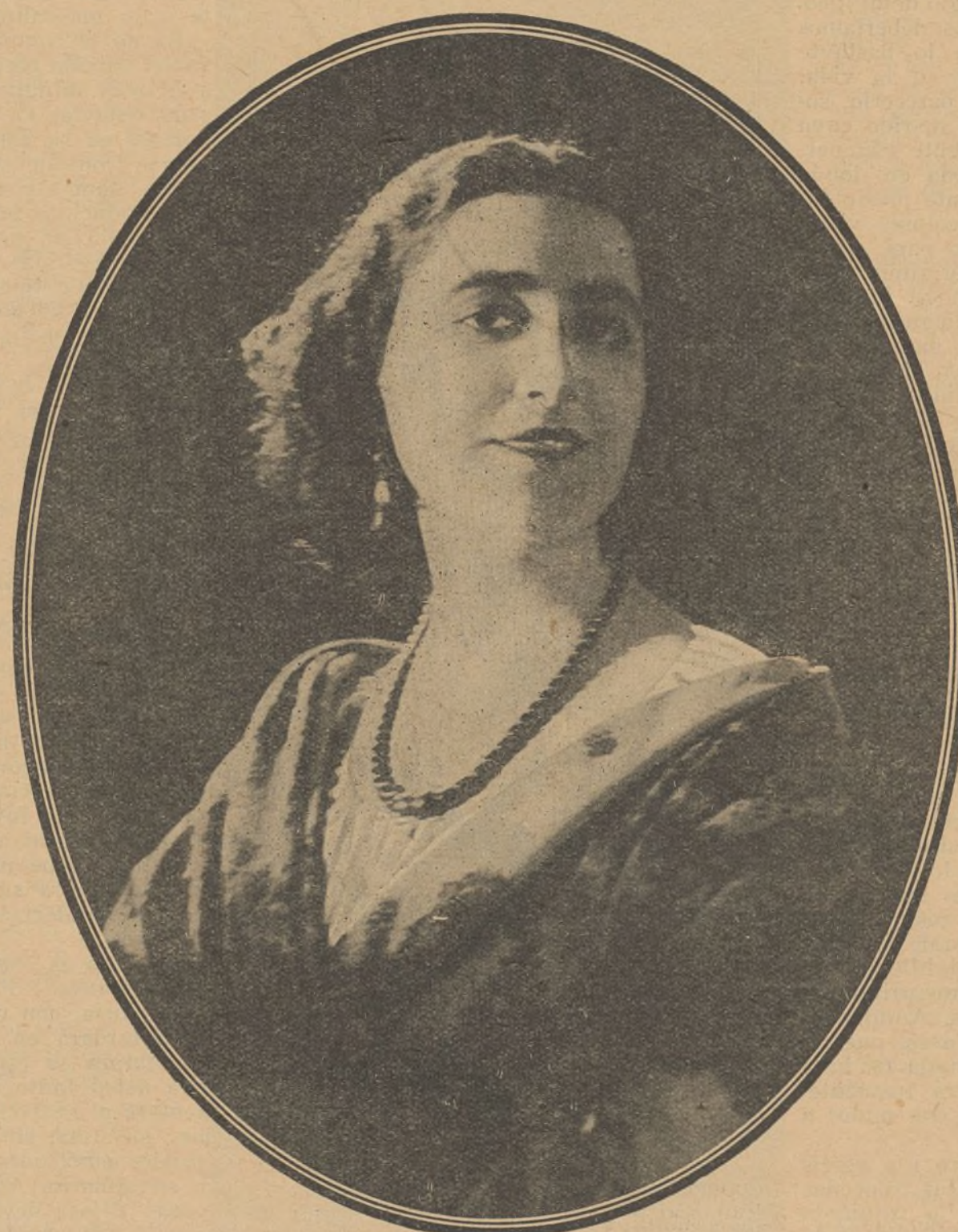
La belleza arrogante de Edy Darcia, la gentil estrella italiana, se muestra a los lectores de EL CINE con todo su esplendor en esta hermosa fotografía. Una sonrisa de orgullo y unos ojos dominadores captan el más sensato. Recientemente ha filmado «El corsario», de F. Paolieri y Aldo de Benedetti.

Esta innovación, que constituye un paso de gigante en los progresos del cine, dará comienzo esta misma temporada.