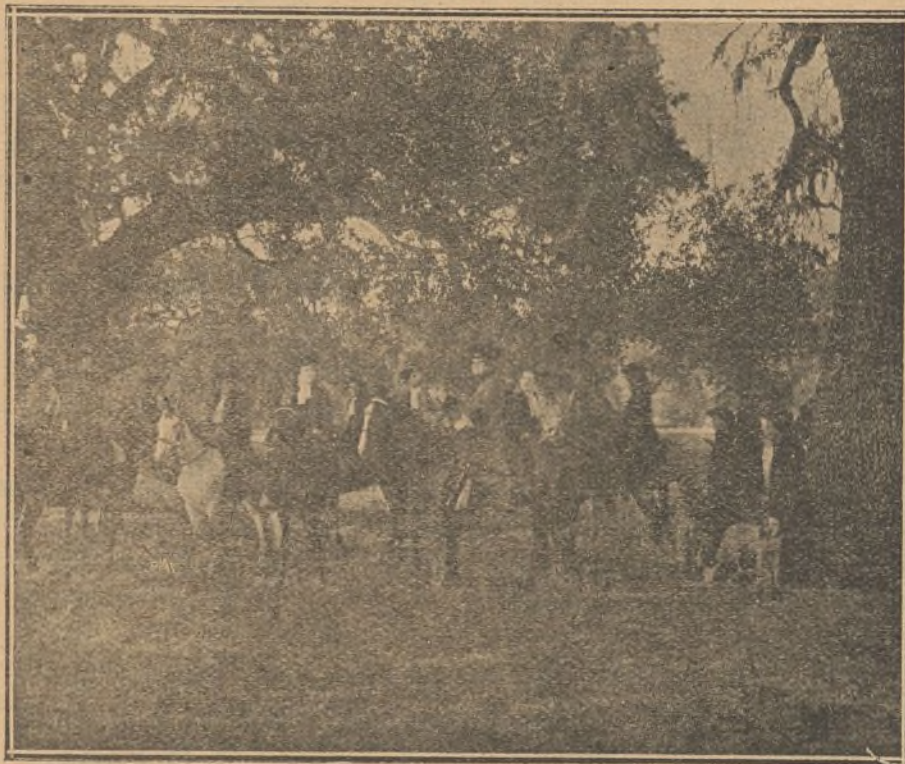
... y hay pocos jóvenes que la igualen en valentía en las cacerías que su padre organiza

Anna tiene una conversación con su hermana en la que le pide que le explique al duque los motivos que tiene para rechazar su amor. Clorinda rehusa hacerlo y manifiesta que nunca se casará con él, no porque haya dejado de amarle, sino que al contrario, lo ama y estima tanto, que no desea unir su vida manchada por la muerte de Sir Oxen con la de él. Esta conversación es escuchada por el duque, quién sale de su escondite y abraza efusivamente a Clorinda diciéndole que él sabrá guardar el secreto de Sir Oxen y que está orgulloso de tener por esposa a una mujer que sabe defender su honor.