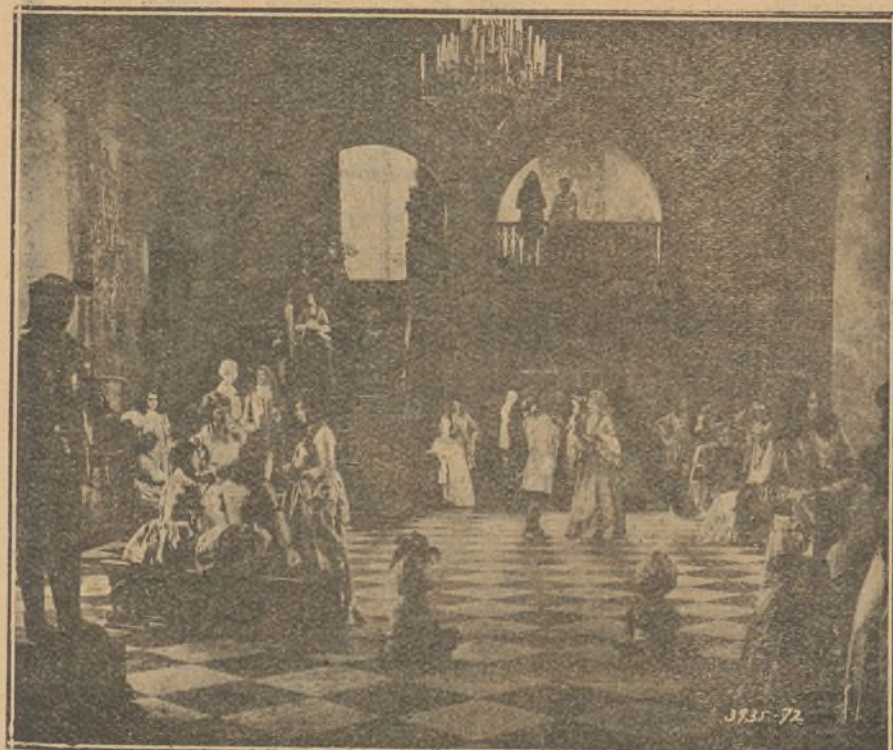
Cuando Clorinda cumple 18 años su padre da una gran fiesta...

Completamente horrorizada por lo ocurrido, Clorinda se decide escribir una carta al duque de Osmonde rompiendo su compromiso. En el momento que ella está escribiendo a su hermana, Ana entra en su habitación y vé el cadáver de Sir Oxen. Al día si-