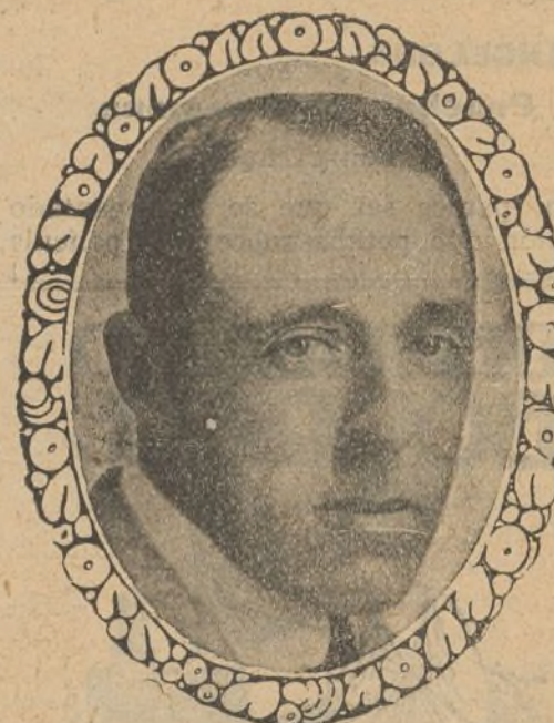
D. W. GRIFFITH