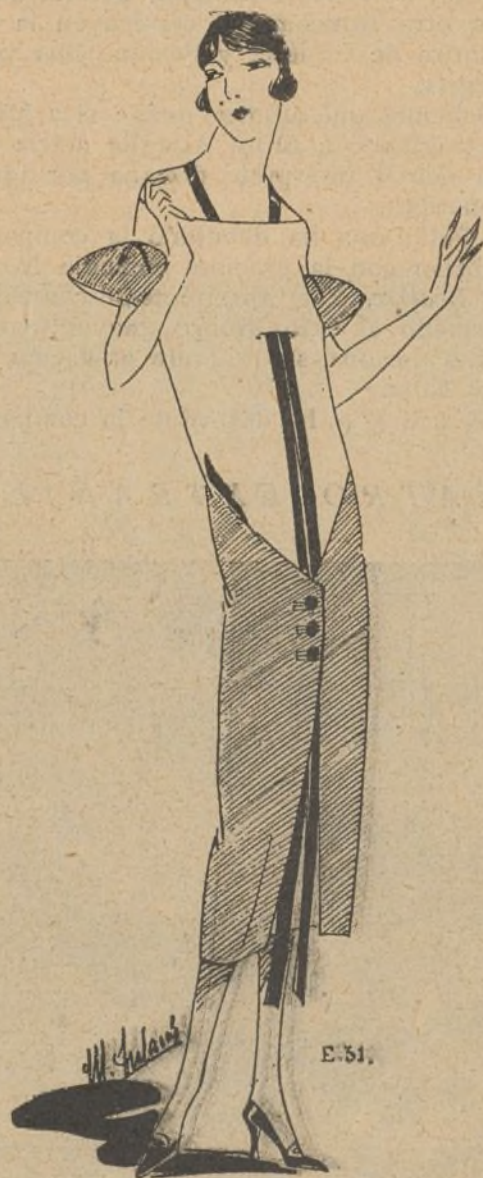
Vestido de ottoman verde. La parte alta del vestido es de un verde más claro. Botones y cinta color plata

Se ejecuta el zurcido del revés, empezando por la esquina inferior del lado izquierdo y algo más abajo de la parte usada, porque de lo contrario se rompería la media apenas puesta. El punto consiste en un verdadero tejido que se ejecuta con la lana y los hilos rotos o usados de la media. Se hacen con la aguja tantos puntos como se pueda buenamente, tomando un hilo y dejando el inmediato, primero dirigiéndola hacia adelante y luego volviéndola hacia nosotras. Antes de sacar la aguja con la mano derecha, tomados ya los puntos, hemos de sostener con el pulgar izquierdo el lazo formado en el extremo de la lana, y dejarlo flojo por lo que puede encogerse lavándolo, cuidando también de que el zurcido no forme arrugas, sino que quede bien liso. Se van repitiendo los puntos en ambas direcciones, hacia delante y hacia atrás, pasándolos por encima del agujero al llegar a él. Es mejor que los lacitos de los extremos no estén en línea recta, sino algo más adentro en las esquinas, con lo que se evita que tiren todos del mismo punto, aunque, naturalmente, la forma del zurcido depende sobre todo del agujero.