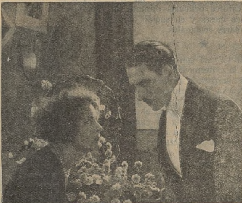
Un bello momento de la película "Pasiones", de la casa Gaumont

siempre el plato que tiene más calorías del menú, pero no hay que fiarse de esto, porque los yanquis se creen que todo lo español es caluroso bajo todos los puntos de vista. Yo he tratado varias veces de darles a comprender que en Jaca hace un frío que pela y que en Zaragoza el viento se lleva hasta los dolores de cabeza y que en Madrid durante el invierno tiene uno siempre grandes probabilidades de pesca: