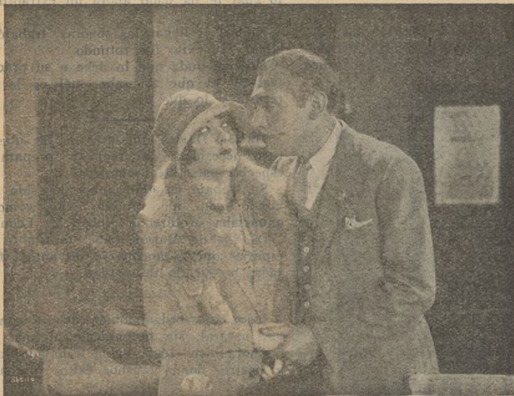
Lew Cody y Aileen Pringle en una interesante escena de «Drama pekinés»

ses, algo de lo que ya es el cinema sonoro y las posibilidades que tiene.