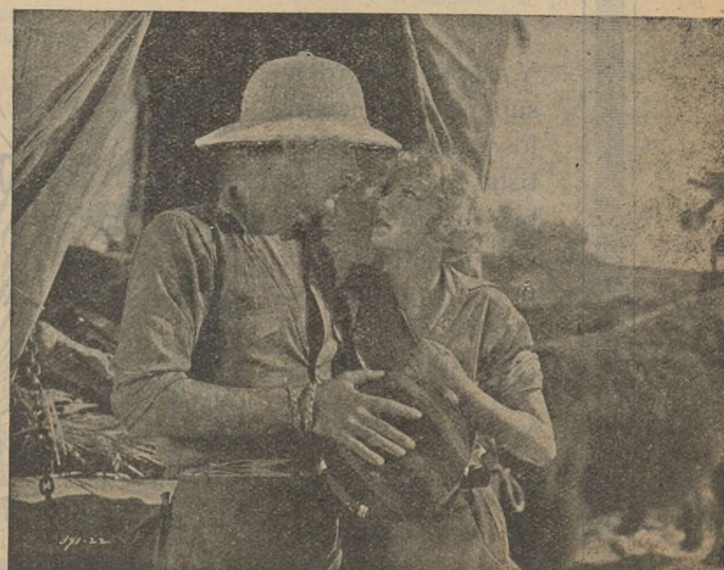
Escena de "El desierto de la sed", pero ¿quién se muere de sed teniendo tan cerquita la fuente, si la sed es de amor?