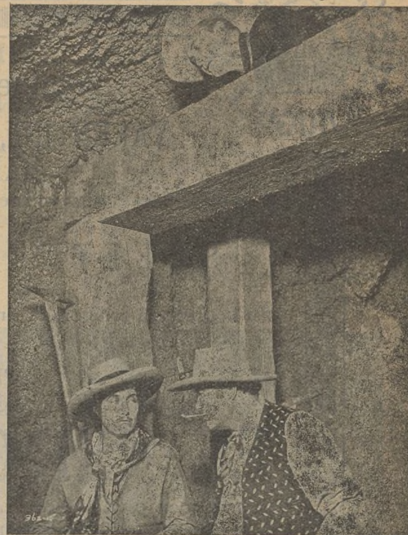
Espiando una confidencia interesante "Más allá de las sierras"

Billy West, aquel famoso imitador de Charlot que le fué prohibido judicialmente imitarle más, que estaba con la Fox trabajando co-