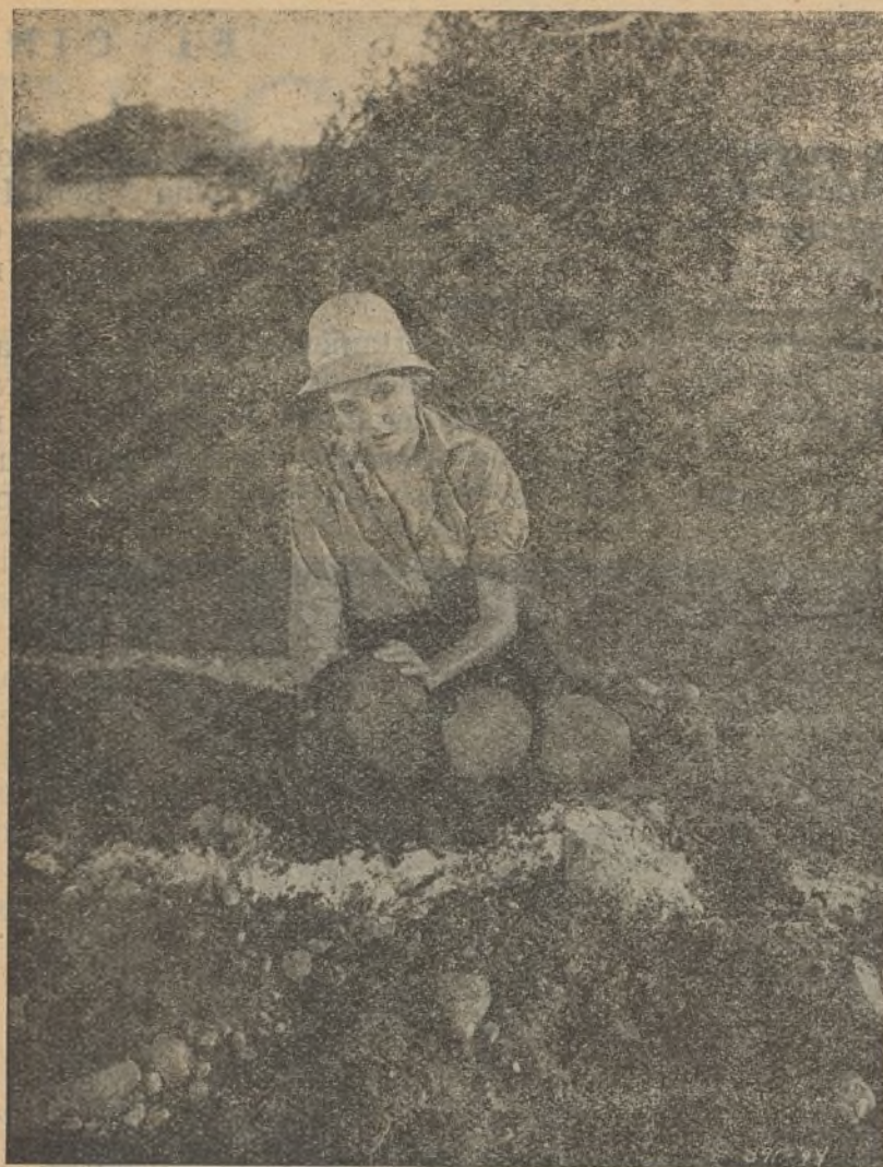
¡Sola, solita en "El desierto de la sed"!

Empecemos por los aviadores y las bañistas sin agua.