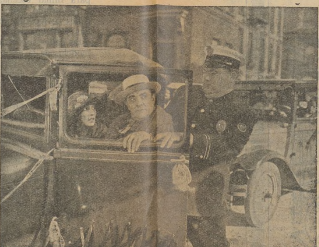
Un percance inesperado que interrumpe una "Luna de miel"

Lew Cody volverá pronto a trabajar para M-G-M.