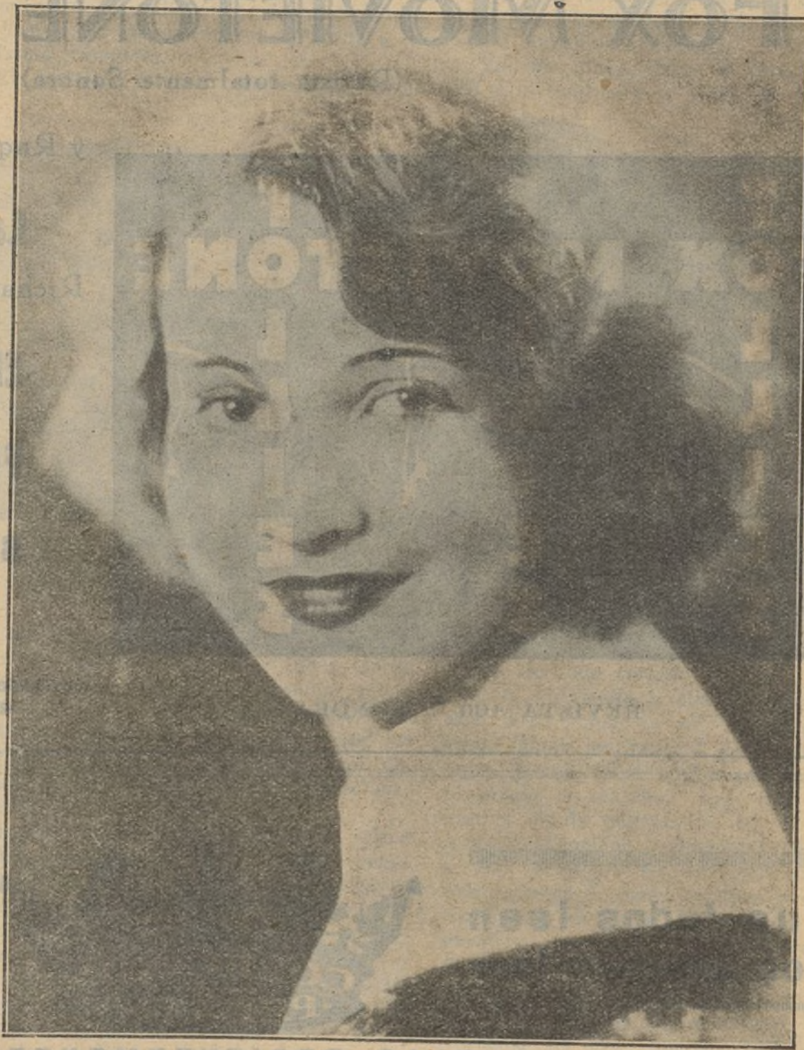
La eminente artista de la M-G-M, Eva von Berne

cedencia francesa y rusa sobrevenía el malestar al presenciar como se habían resuelto fotográficamente las escenas, abusando sin piedad de las diferentes modalidades que conoce la cámara.