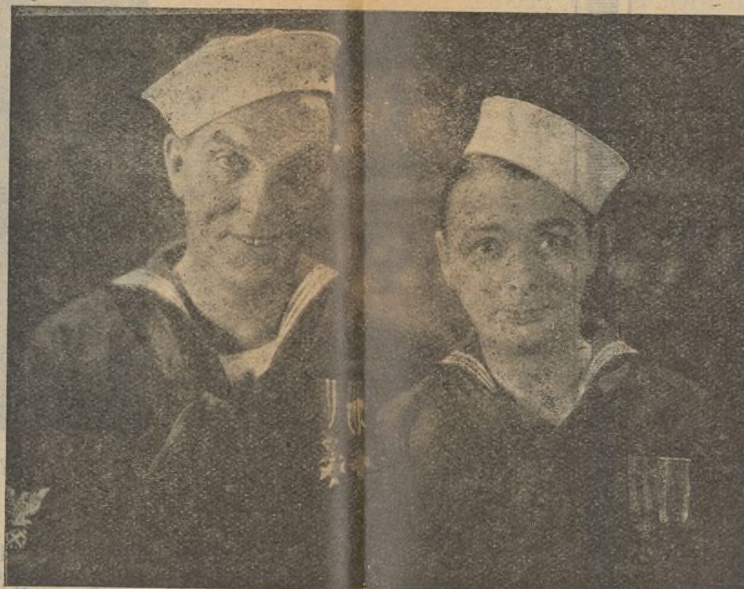
Karl Dane y George K. Arthur, con su cómica vivacidad en "Marinos en seco" hacen pasar un buen rato al público

Greta Garbo ha ido por primera vez a ver una película suya a un cine públi-