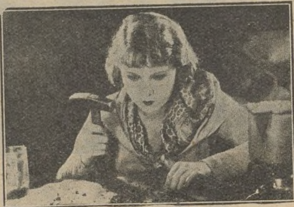
Anny Ondra, una «tontería» de mujer en una escena de «El primer beso»

Actriz.—Porque estamos en el «Puente de los Suspiros».