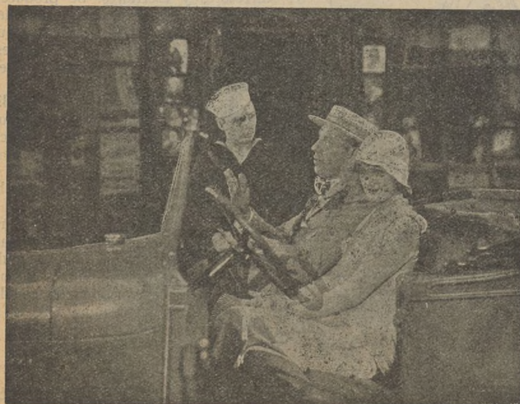
Una escena de "Marinos en seco" en que la protagonista quizás piensa... en otro