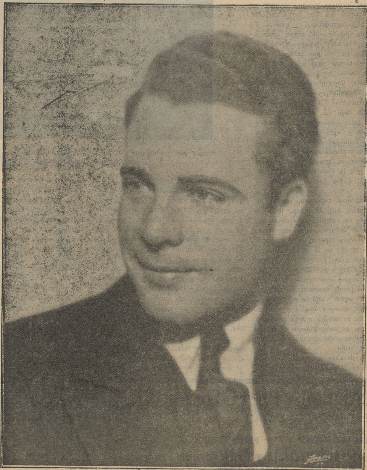
El joven ídolo de los públicos de todos los países James Murray, "astro" de la constelación M-G-M que brilla con luz propia e inconfundible

Hasta en la comida, para no decir más, le meten a uno los números esta gente. En el restaurante, cuando uno abre el menú, lee algo así: "Usted necesita para substituir 567 calorías y 250 vitaminas. Tome el lápiz, haga sus matemáticas y dígame al camarero lo que quiere comer." —y ve a la derecha de la cartulina— "Sopa de judías españolas (250 calorías—50 vitaminas). Jamón frito con patatas idem (150 calorías—27 vitaminas), etc." Es de notar que las judías españolas, aunque sean cosechadas en California, constituyen