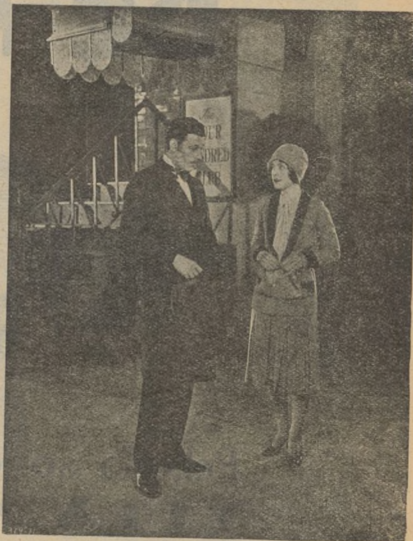
Norma Shearer en una escena "Después de media noche"

York, como miles de otras muchachas", me dice. "Estábamos seguras del triunfo. La palabra fracaso no existía para nosotras".