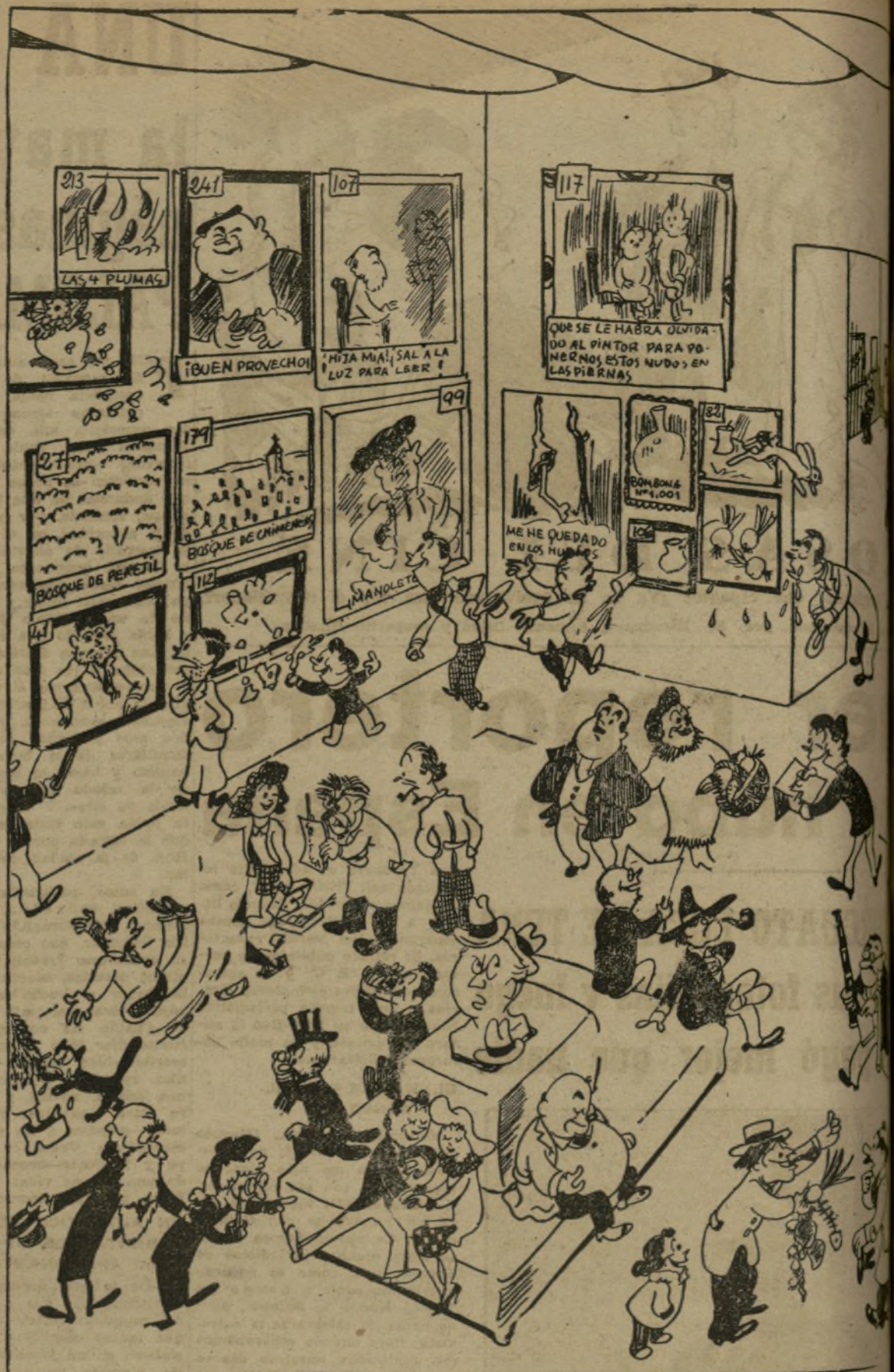
SALON DE OTOÑO

CLAVE ORDEN CULTO BARRA TENOR MALTA PASAR TRAPO BARCO RIZOS ABAJO ASNOS TEMOR MOSA TRAJE ISLAS ABAJO VARIA CRIBA GARZA Tórnese de cada una de estas palabras un grupo de dos letras seguidas, las cuales, leídas unas tras otras, darán un conocido refrán castellano.