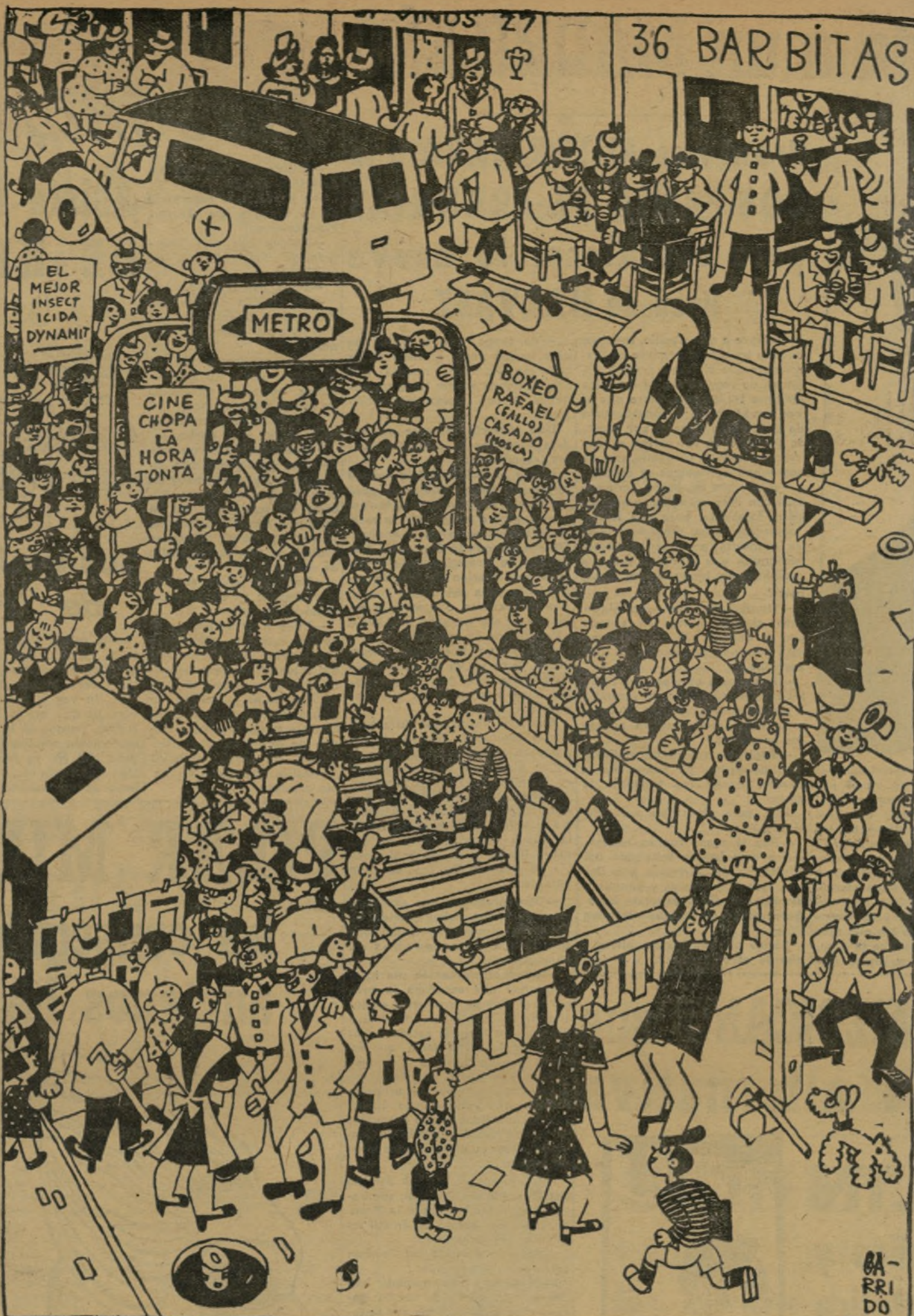
LA BOCA DEL "METRO"