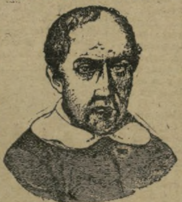
JUAN DE HERRERA

Y díjame: ¿Usted sabía que en Simancas...?