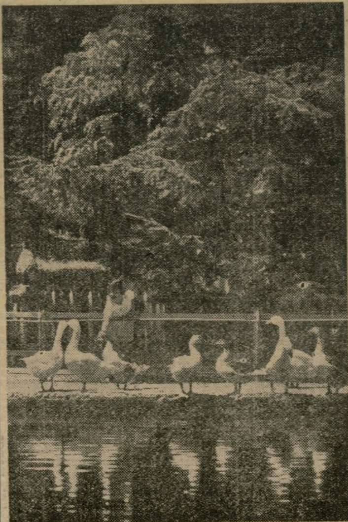
Las fieras del Retiro se resisten a recibir las caricias de uno de los visitantes infantiles.