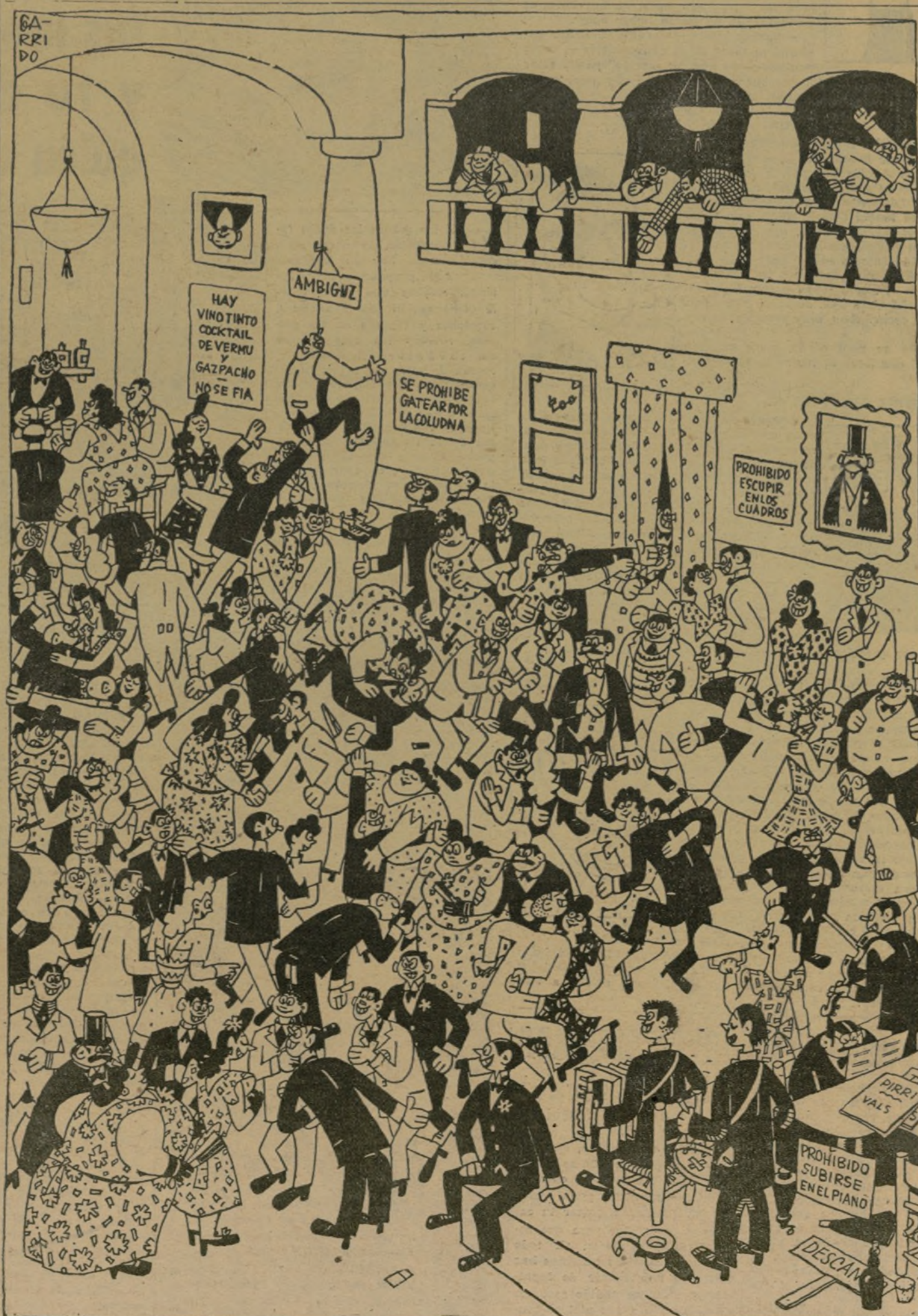
BAILE EN EL CASINO