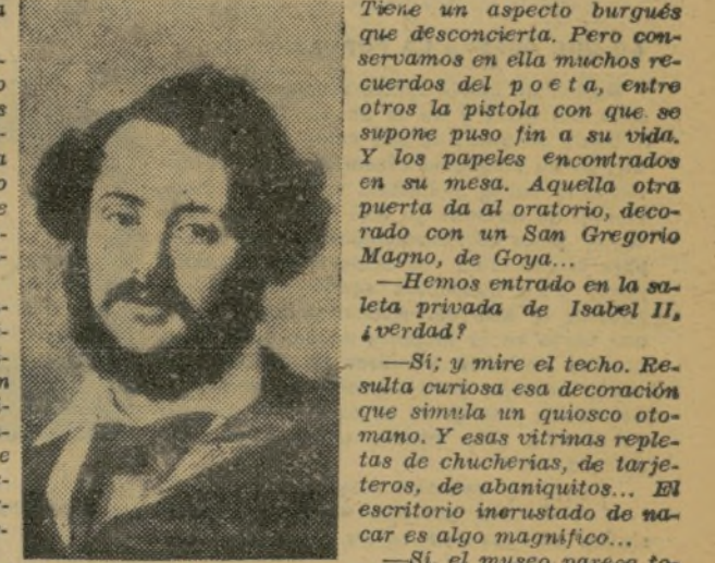
"Un romántico". Magnífico retrato de Vicente López, que figura en el Museo.