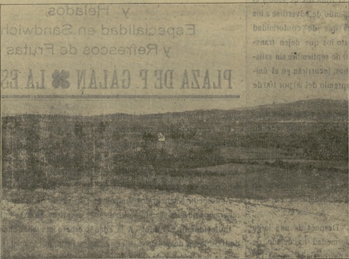
Pintoresco paisaje de La Estrada, visto desde Lagartones