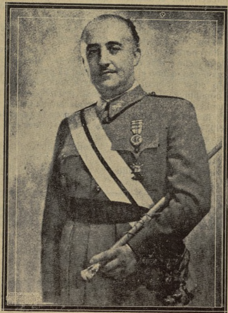
EL CAUDILLO DE ESPAÑA