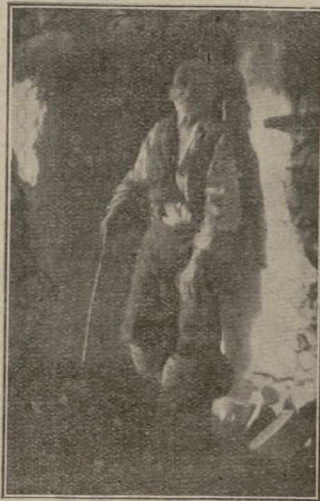
EL VIEJO TÍO FELÚ

Por eso yo, que aprecio esas cualidades, las uno a las bellezas que el paisaje me proporciona, y en cada minuto, en cada segundo, encuentro elemento de información en que saciar mi sed de curiosidad, en que encontrar motivo suficiente para elevar mi pensamiento y glorificar al creador de tanta magnificencia, y, lo mismo que ellos, dejo pasar sin sentir los días y las noches, hasta que la necesidad de reanudar mis tareas en el llano, en la ciudad, en el torbellino de