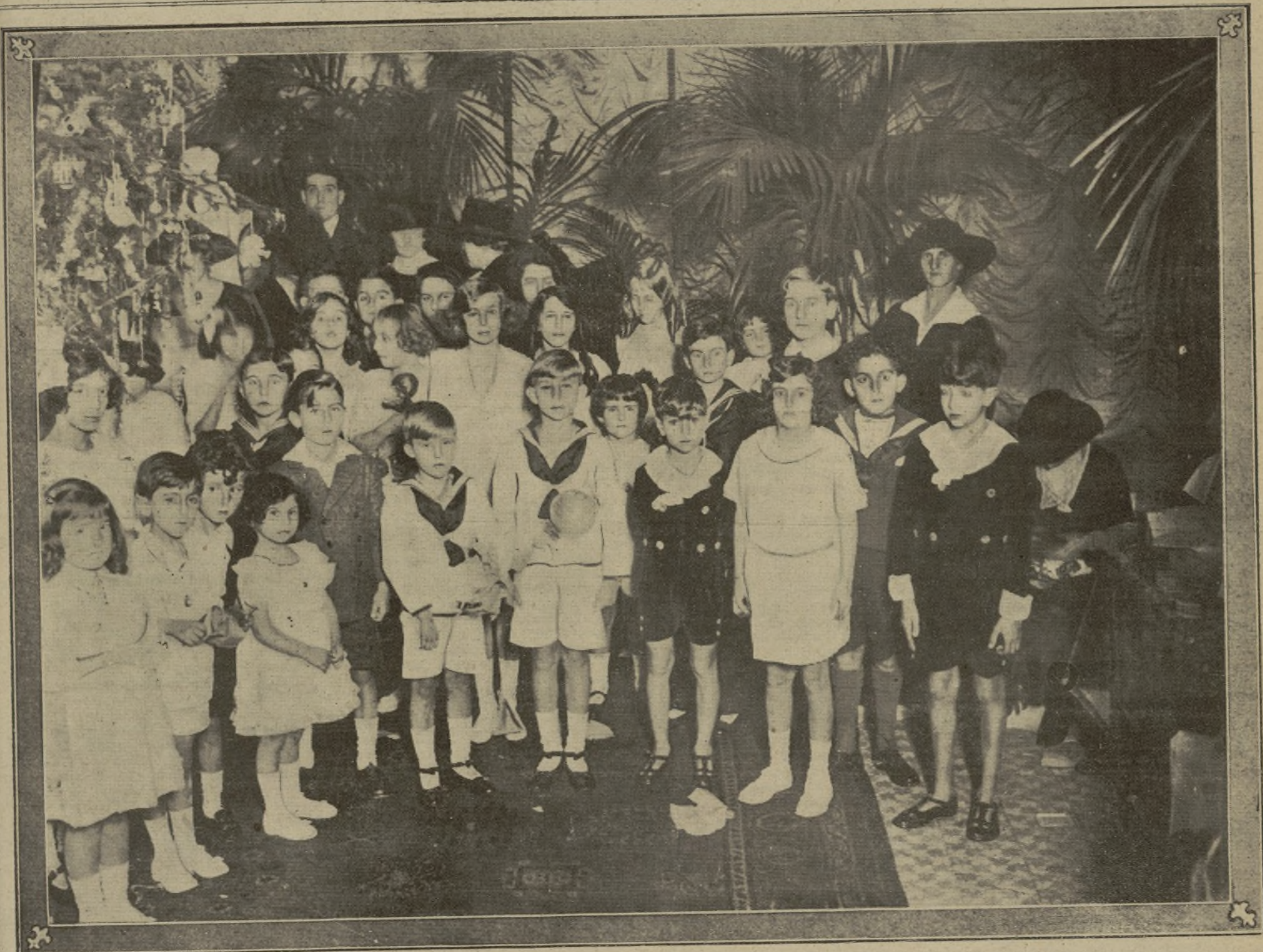
LOS INFANTITOS, RODEADOS DE OTROS NIÑOS DE LA ARISTOCRACIA, EN EL ÁRBOL DE NOEL CON QUE LES OBSEQUIARON LOS CONDES DE CASA-VALENCIA