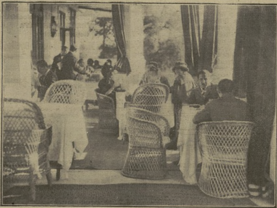
LA MÁGICA TERRAZA DEL "CHALET", EN PLENO SOL, A LA HORA DEL ALMUERZO

Un día espléndido, como de mayo, favoreció ayer el partido de inauguración de la temporada oficial de «golf» en Puerta de Hierro.