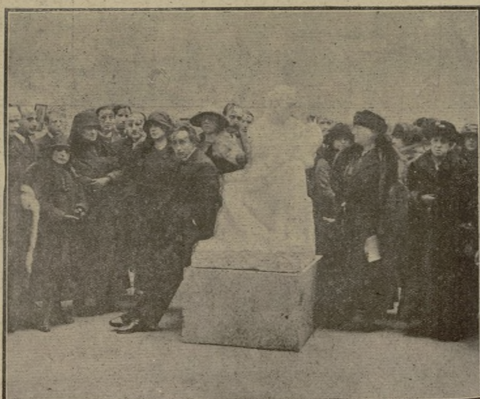
EL ILUSTRE ESCULTOR VITORIO MACHO, EN EL ACTO INAUGURAL DE LA EXPOSICIÓN DE SUS OBRAS