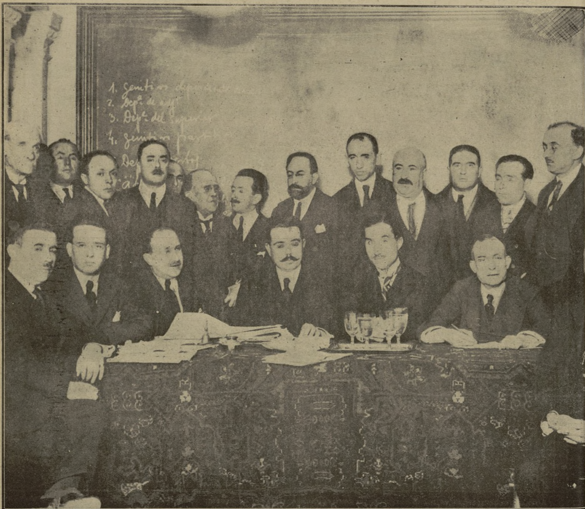
ASAMBLEA DE SECRETARIOS JUDICIALES, CELEBRADA AYER EN EL ATENEO