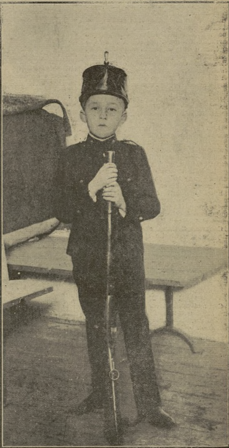
EL INFANTE D. GONZALO, PROBANDO EL RANCHO EXTRAORDINARIO SERVIDO A LOS SOLDADOS DEL REGIMIENTO DEL REY CON MOTIVO DE SU INGRESO EN FILAS. EL AUGUSTO SOLDADO EN LA PRIMERA COMPAÑÍA, A LA QUE HA SIDO DESTINADO