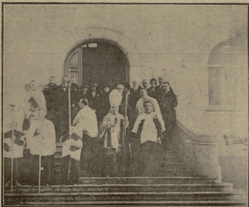
EL OBISPO DE MADRID, SALIENDO DE LA CAPILLA DEL ASILO DE SANTA CRISTINA DESPUÉS DE OFICIAR EN LA MISA DE INAUGURACIÓN