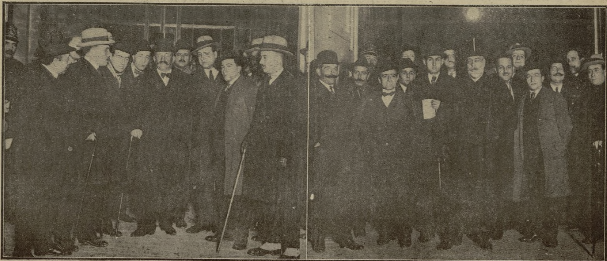
EL CONDE DE ROMANONES, AL SALIR AYER DEL REGIO ALCÁZAR DESPUÉS DE SU CON- SULTA CON EL SOBERANO