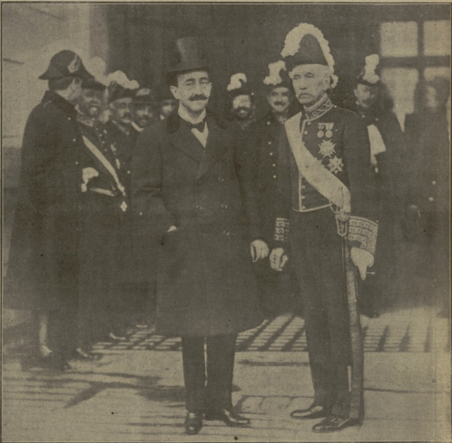
EL SR. DATO, CON EL NUEVO MINISTRO DE HACIENDA, DESPUÉS DEL ACTO DE LA JURA

En el pleito entre los Ferrocarriles Vascongados y el Banco de Bilbao, sobre transportes de valores al comienzo de la guerra mundial, ha dictado sentencia la Audiencia territorial de Burgos fijando