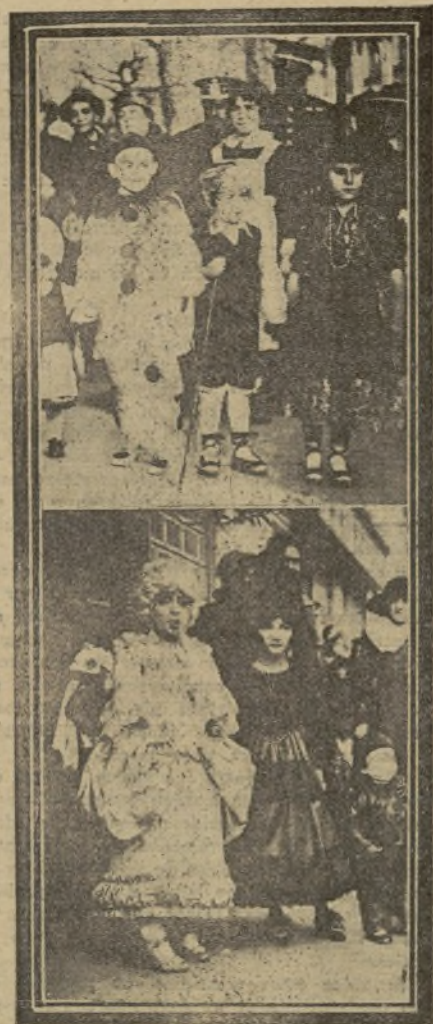
EL CARNAVAL EN EL PASEO DE GRACIA