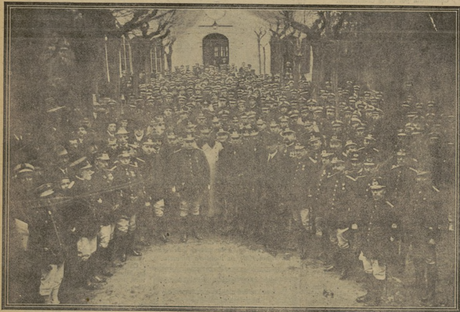
JEFES E INDIVIDUOS DE LA CRUZ ROJA DE BARCELONA, DESPUÉS DE HABERLES SIDO IMPUESTA LA MEDALLA CONMEMORATIVA DE LA COLOCACIÓN DE LA PRIMERA PIEDRA DEL HOSPITAL DE SU INSTITUTO.