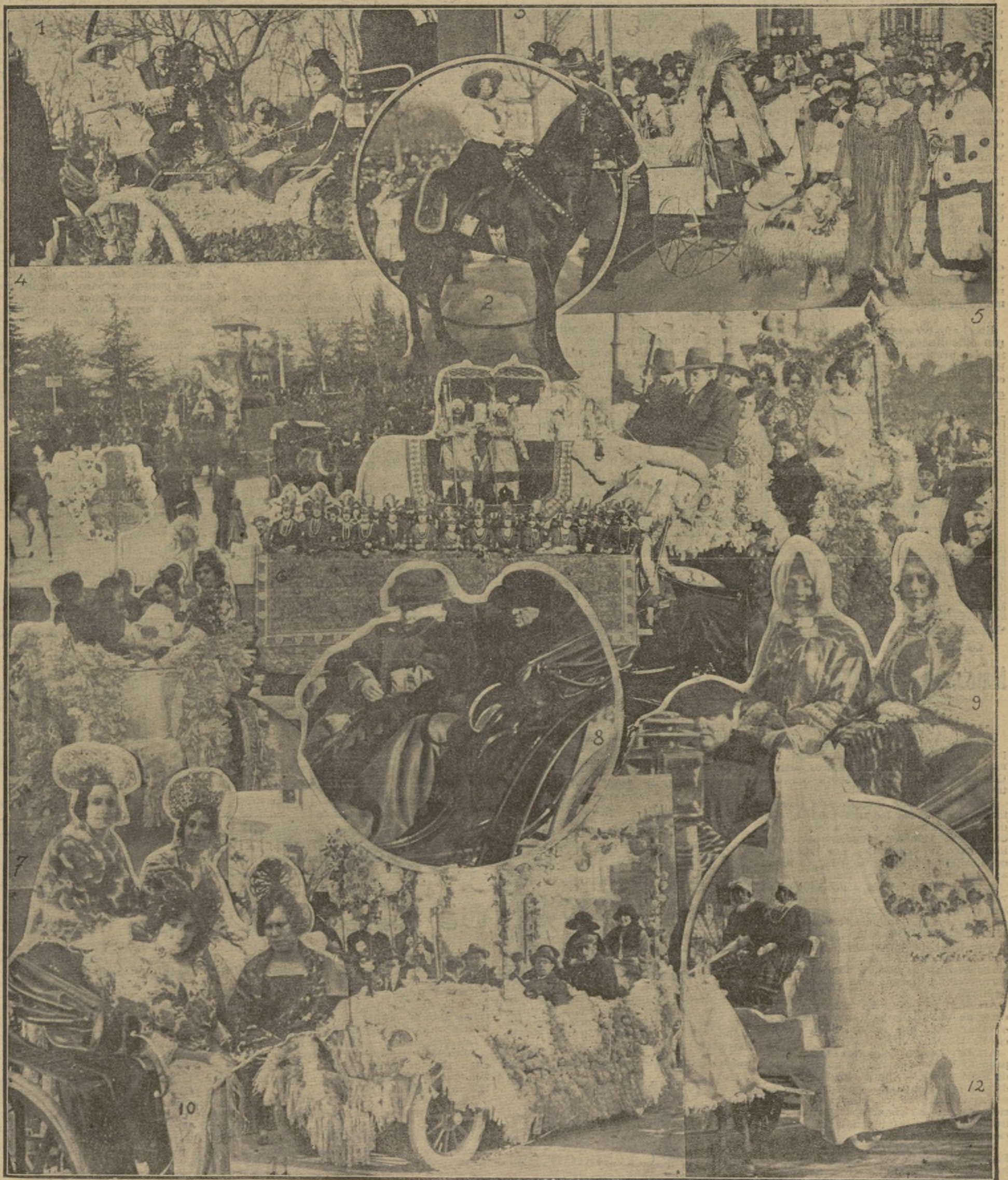
1.—"MUY VISTO...", PERO MUY CASTIZO", SEGUNDO PREMIO DE COCHES.—2. LA NIÑA ASCENSIÓN MUNTAÑOLA, SEXTO PREMIO DE COCHES.—3. "GUARDANDO MIS OVEJAS", CUARTO PREMIO.—4. UN ASPECTO DEL PASEO DE ROSALES DURANTE EL PRIMER DÍA DE CARNAVAL.—5. "PARA QUE VIVA EL CARNAVAL", PRIMER PREMIO DE COCHES.—6. "EL RÁPIDO DE BARODA", CARROZA PREMIADA CON EL TERCER PREMIO (LOS DOS PRIMEROS FUERON DECLARADOS DESIERTOS), RECHAZADO POR SU PROPIETARIO.—7. "ROSAS DEL TIEMPO", TERCER PREMIO DE COCHES.—8. LA INFANTA DOÑA ISABEL, CON SU DAMA LA SEÑORITA BERTRÁN DE LIS, PASEANDO POR ROSALES.—9 Y 10. COCHES "CUYO CONTENIDO" LLAMÓ PODEROSAMENTE LA ATENCIÓN.—11. AUTOMÓVIL ADORNADO.—12. "LLUVIA DE HIJOS, CUNA APROVECHADA".