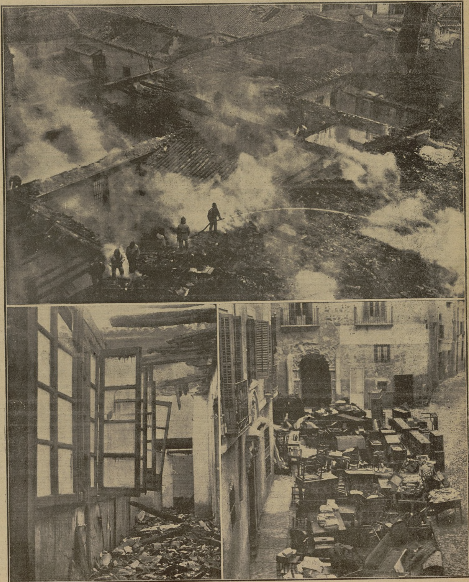
ASPECTO QUE OFRECÍA LA PARTE ALTA DEL EDIFICIO DONDE ESTABAN INSTALADAS LAS OFICINAS DE LA DELEGACIÓN DE HACIENDA Y EL GOBIERNO CIVIL DE TOLEDO, DURANTE EL INCENDIO.—GALERÍA DEL GOBIERNO CIVIL DONDE SE SUPONE COMENZÓ EL SINIESTRO.—ASPECTO DE LA CALLE DEL INSTITUTO DURANTE EL INCENDIO.