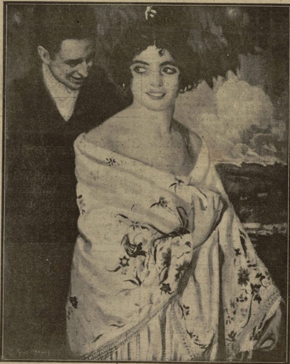
¿Que te crees tu eso!

Hoy se clausurará esta Exposición, que ha sido visitadísima por merecerlo. El pintor Cruz Herrera, ventajosamente conocido del público—porque acude allí donde se solicita su concurso, y se le solicita mucho—, presenta en el salón del Círculo de Bellas Artes cuarenta obras de índole varia. A más de cultivar con fortuna el retrato, que sabe ejecutarlo cuidando de que la factura resulte lo más franca posible, trata el cuadro de género dentro de un costumbrismo que proscriba el hacinamiento de objetos.