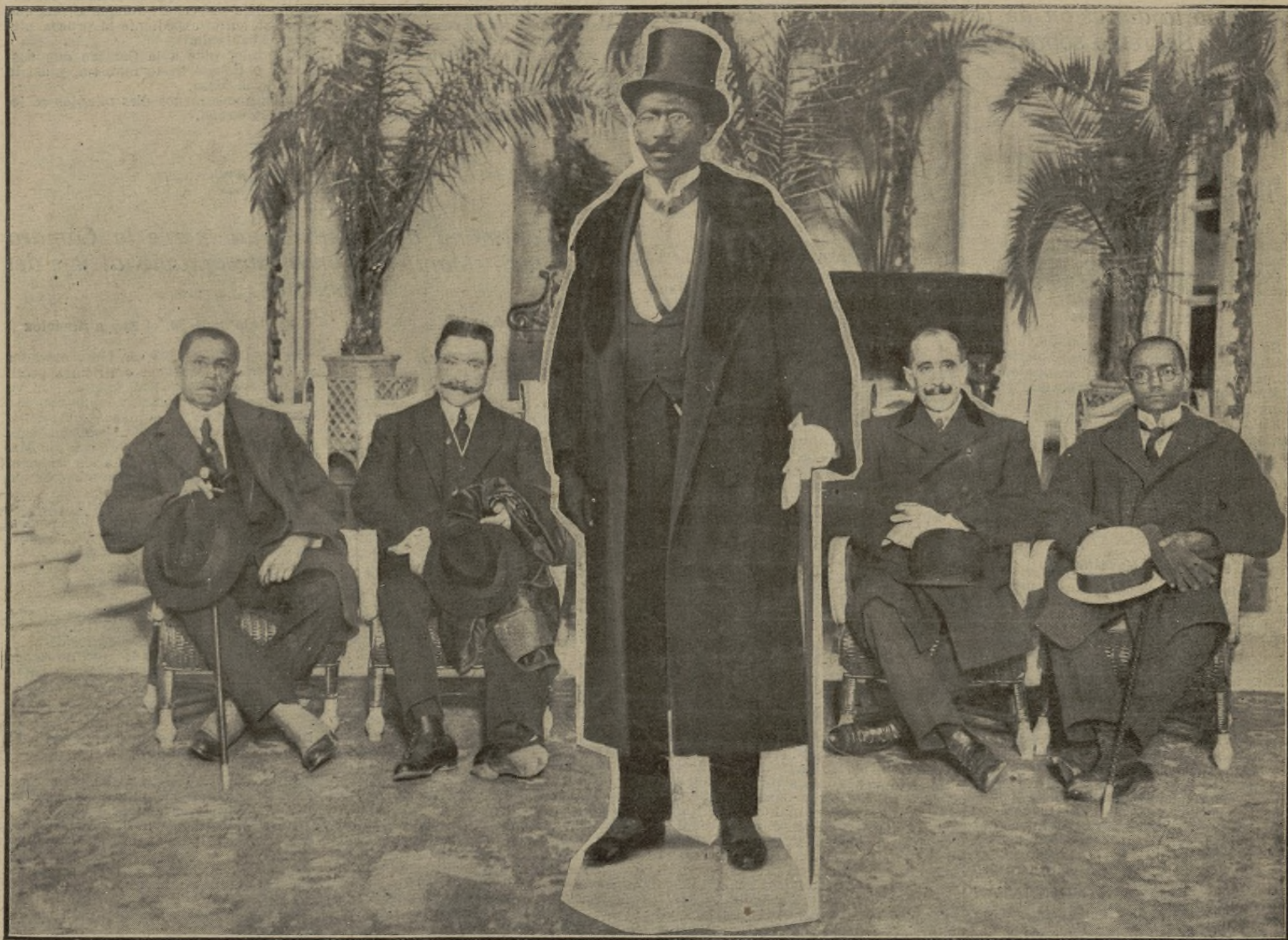
EL PRESIDENTE DE LA REPÚBLICA DE LIBERIA CON SU MINISTRO DE HACIENDA, SR. THOMSON, SU SECRETARIO, Y LAS PERSONALIDADES ESPAÑOLAS DESIGNADAS POR EL GOBIERNO PARA ACOMPAÑAR AL JEFE DE AQUEL SIMPÁTICO ESTADO AFRICANO