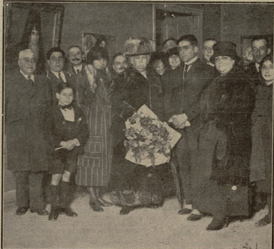
LA INFANTA ISABEL VISITANDO LA EXPOSICION CRUZ-HERRERA