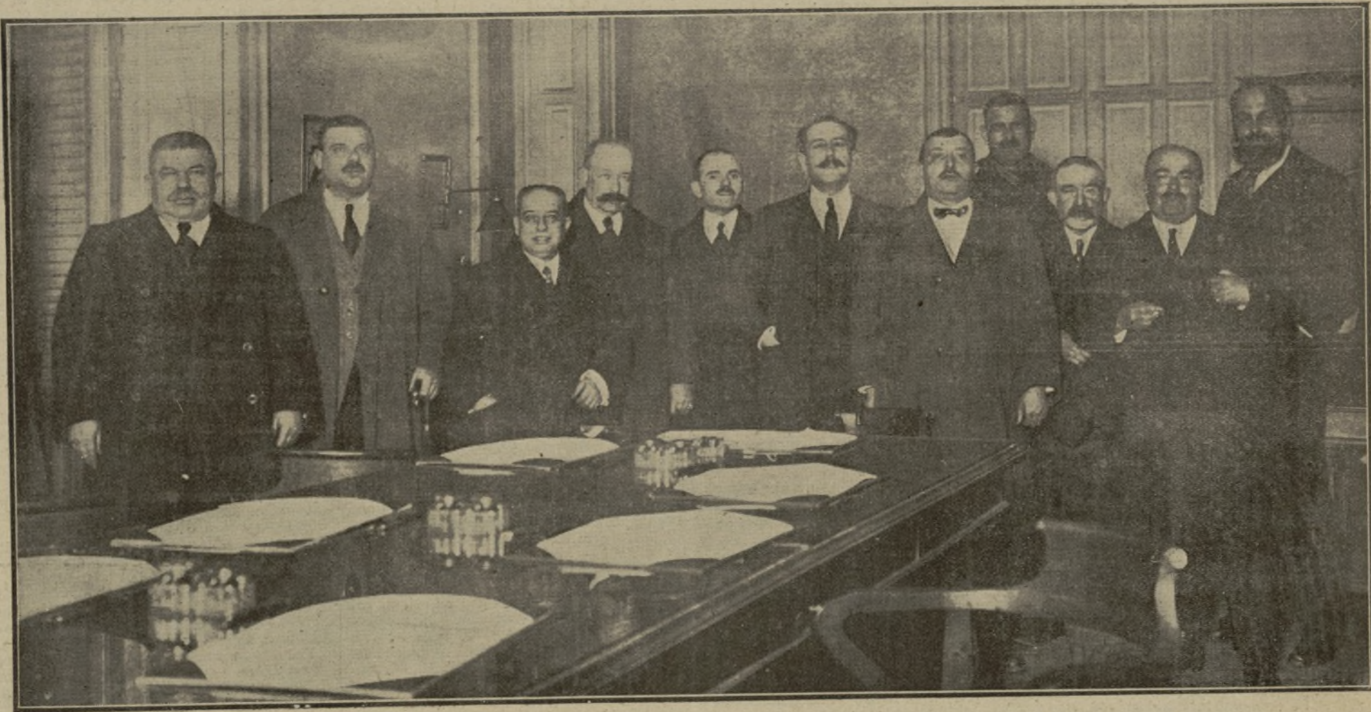
REUNIÓN CELEBRADA EN NUESTRA REDACCIÓN POR LA PONENCIA DESIGNADA PARA ESTUDIAR LAS CONCLUSIONES QUE ACERCA DEL PROBLEMA DEL PAN EN MADRID HAN DE SER SOMETIDAS A LA ASAMBLEA ORGANIZADA POR EL IMPARCIAL, EN PRO DEL ABARATAMIENTO DE LA VIDA