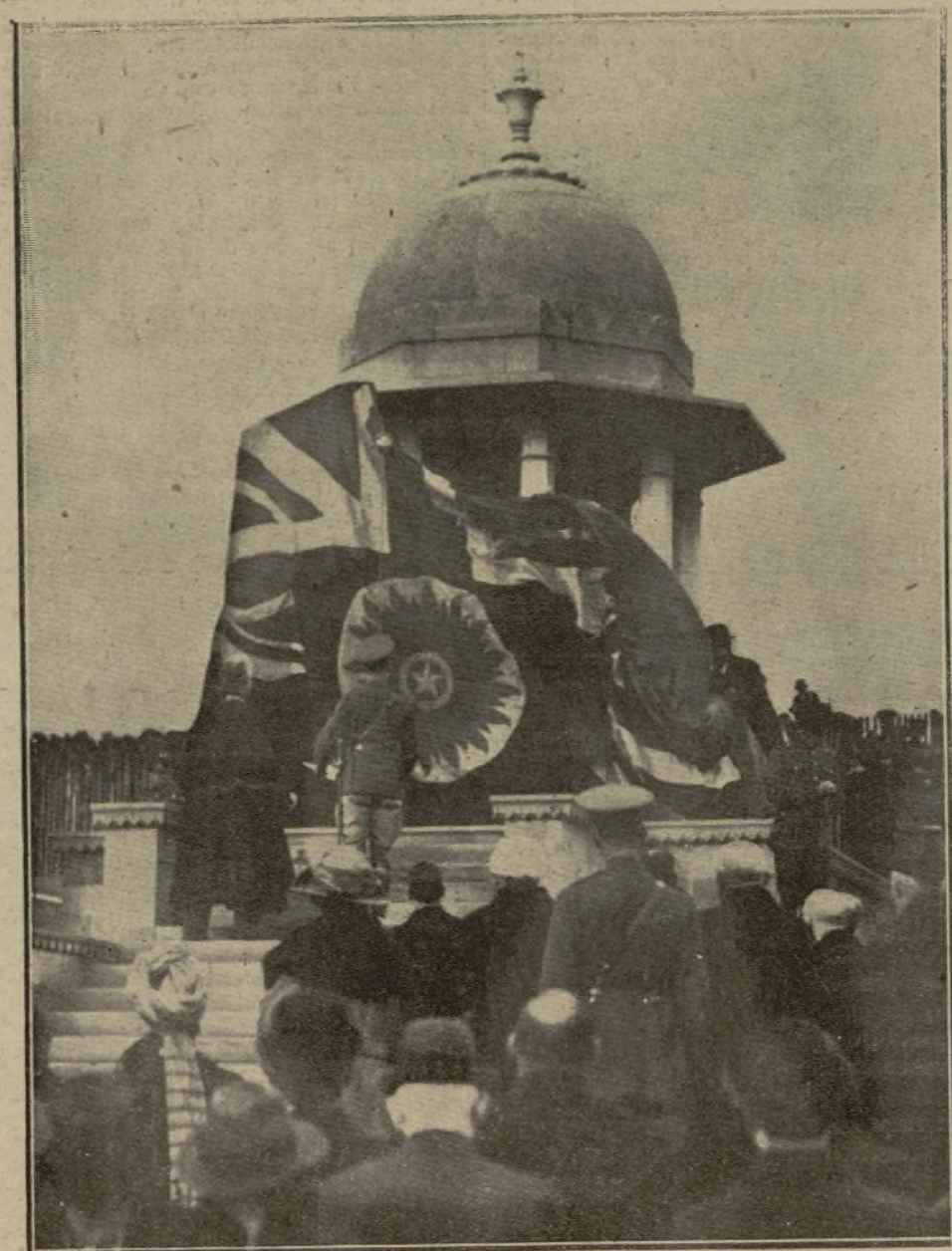
EL PRÍNCIPE DE GALES DESCUBRIENDO EL MONUMENTO ERIGIDO EN BRIGHTON A LOS SOLDADOS INDIOS MUERTOS EN LA GUERRA