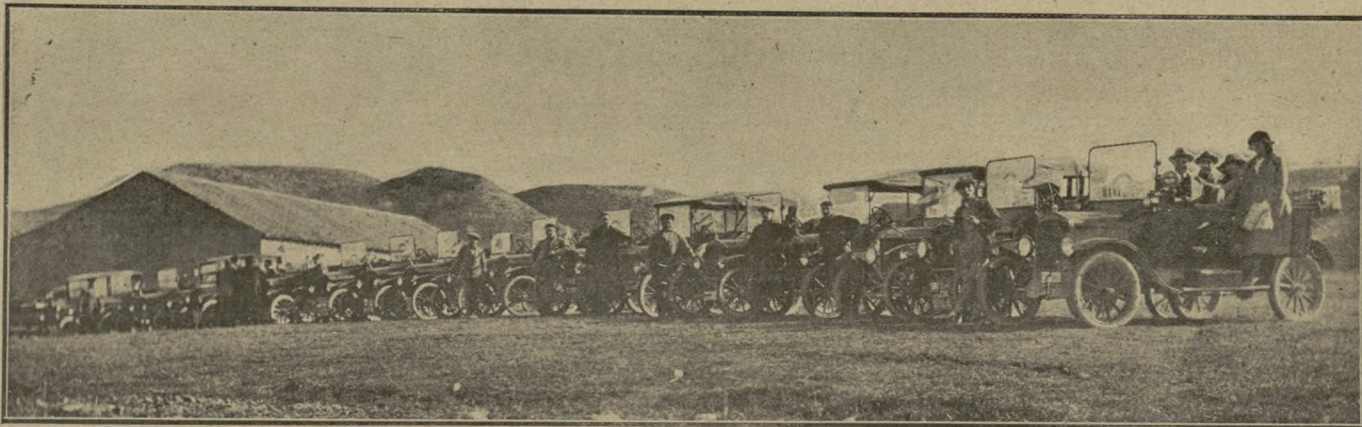
ASPECTO QUE OFRECÍAN LOS COCHES "FORD" QUE CONDUJERON A LOS INVITADOS AL SOTO DE ALDOVEA

El tractor "Fordson" rinde en una hora el trabajo de dos pares de mulas en un día