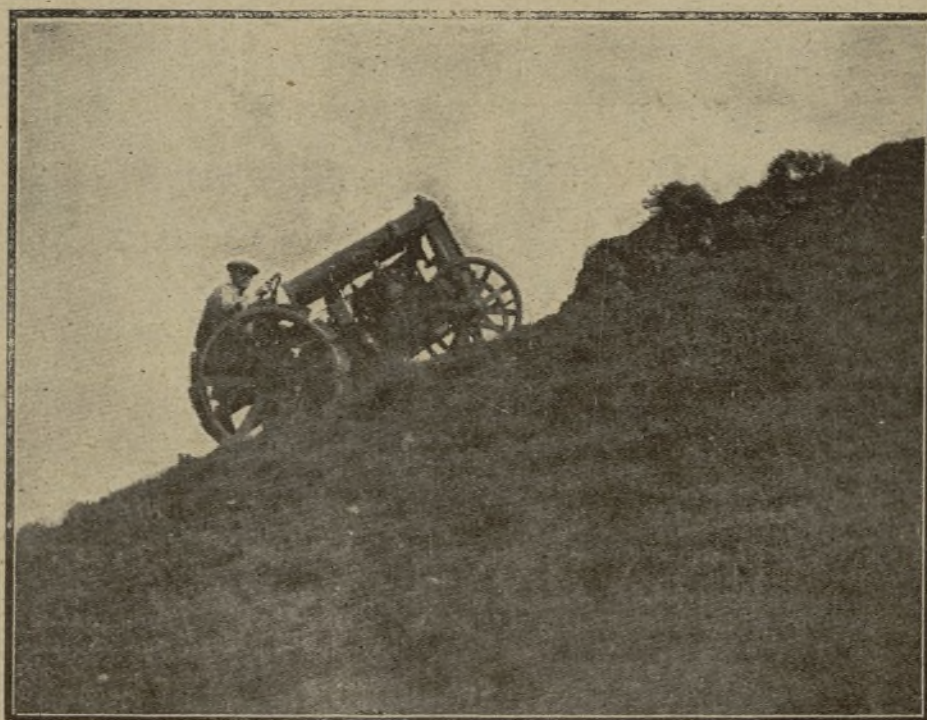
UNA DE LAS PRUEBAS QUE MÁS LLAMÓ LA ATENCIÓN DE LOS INVITADOS A LAS DEMOSTRACIONES CELEBRADAS EL VIERNES ÚLTIMO EN EL SOTO DE ALDOVEA FUÉ LA SUBIDA DE UNO DE LOS TRACTORES "FORDSON" HASTA CORONAR UN CERRO EN PENDIENTE DIRECTA DE 43 POR 100