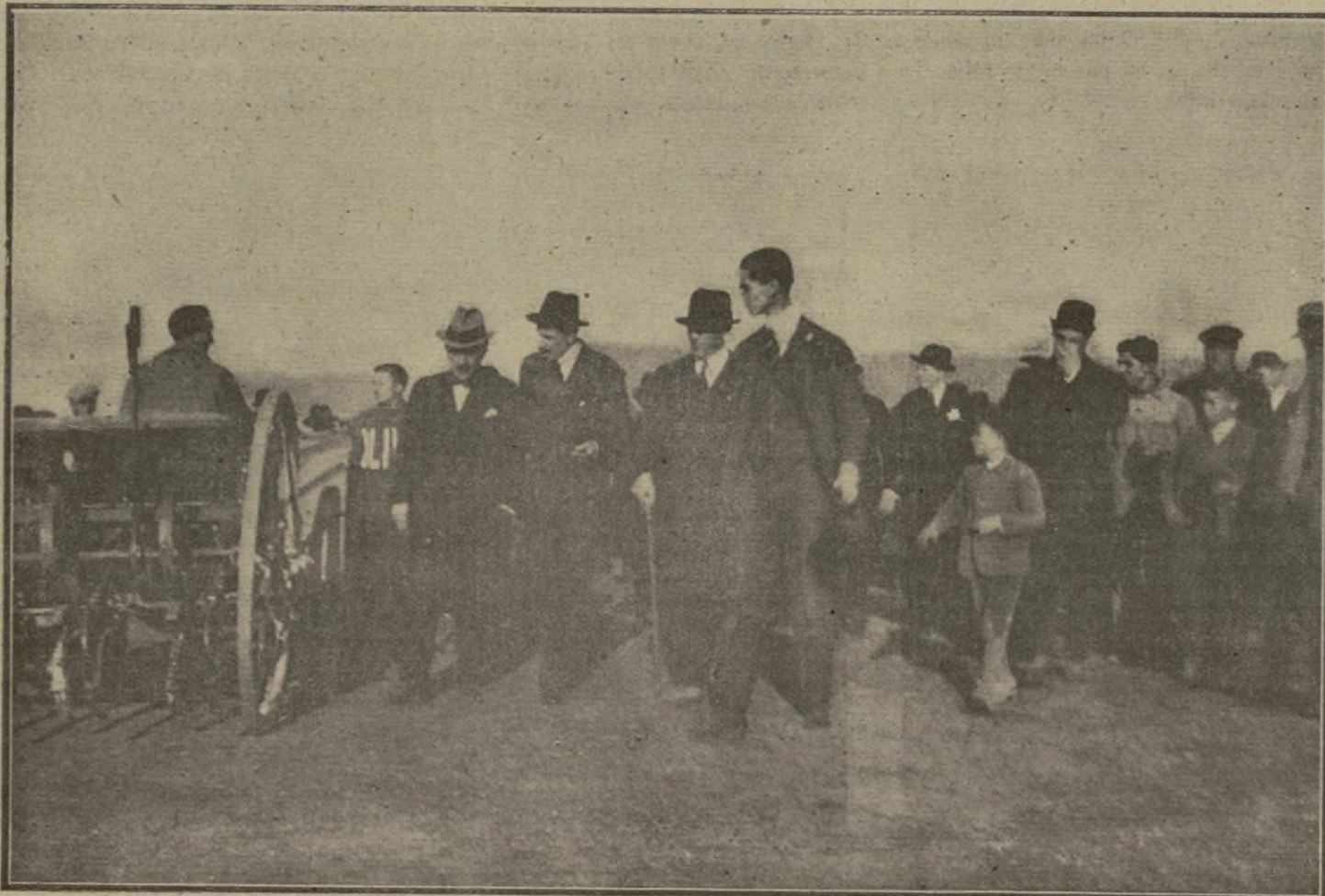
LABOR DE UNA SEMBRADORA ARRASTRADA POR EL TRACTOR "FORDSON"

Para corregir las grietas se recomienda lavar las extremidades de los caballos con una disolución de sulfuro de potasio, en proporción de dos kilos y medio de la citada sal por 12 litros de agua, siendo conveniente que la disolución se haya templado, no demasiado, antes de su empleo.