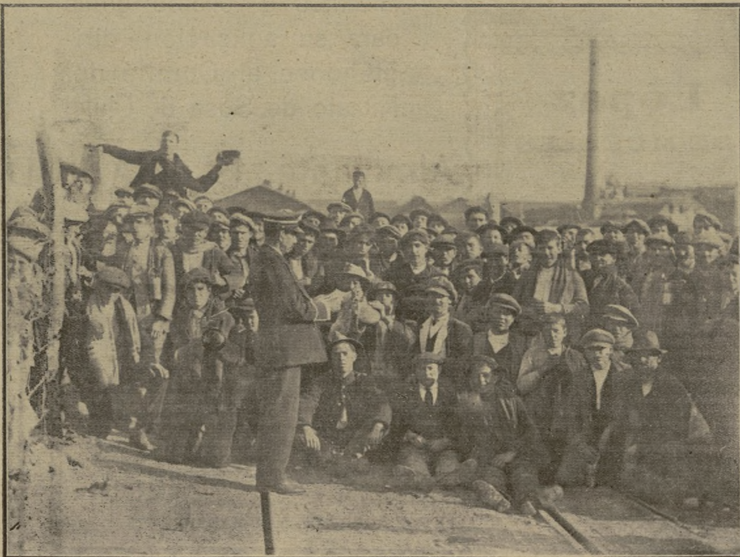
El pregonero del suburbio minero Aldea Moret (Cáceres), publicando ante un grupo de trabajadores el bando sobre el retiro obrero obligatorio.

—Se desestima expediente incoado por el Ayuntamiento de Bilbao, que pide autorización para establecer una o dos escuelas de párvulos, con carácter voluntario.