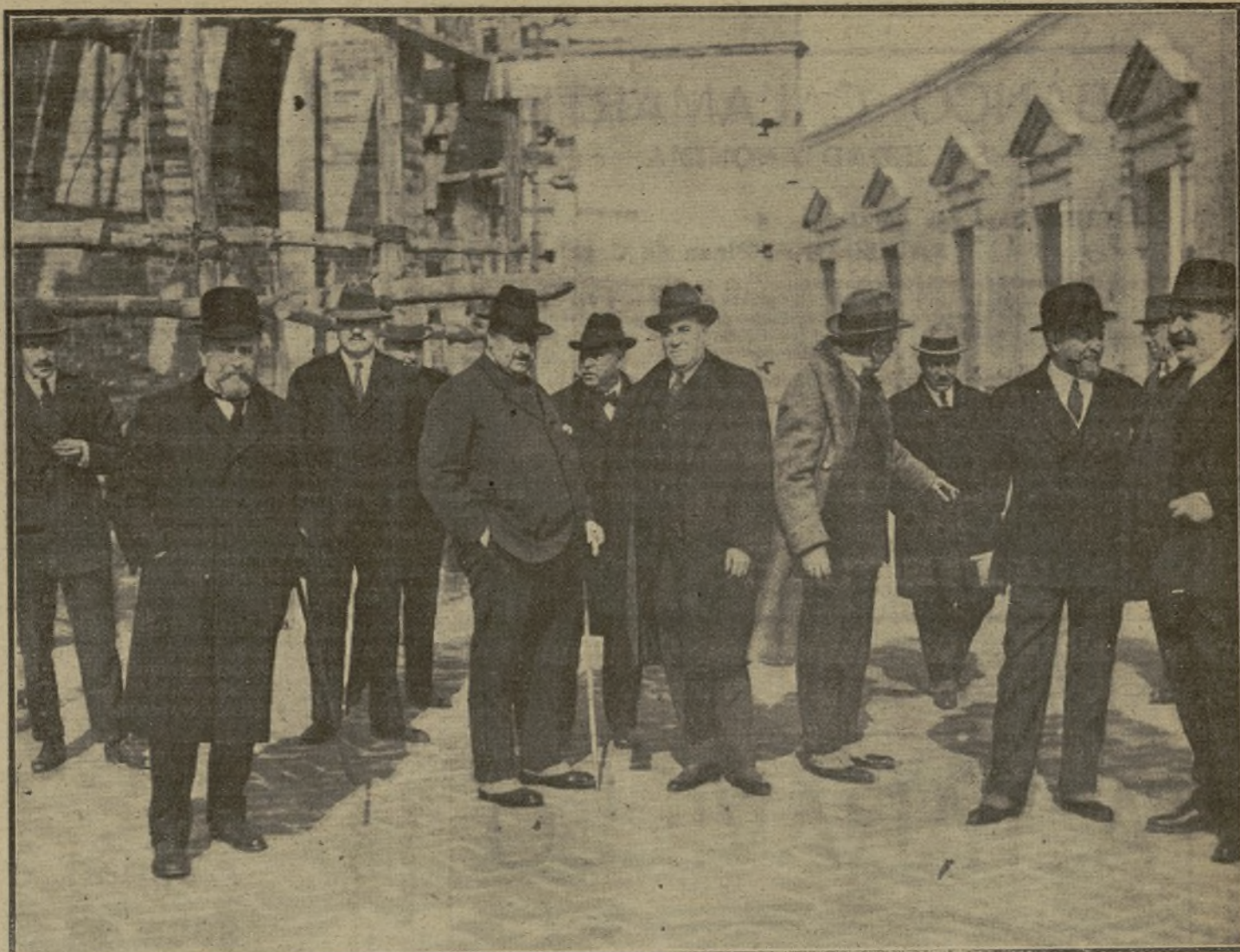
El director y subdirector de Obras públicas y los directores generales de Comunicaciones y Prisiones, con las autoridades de Sevilla, visitando las obras de la Exposición.