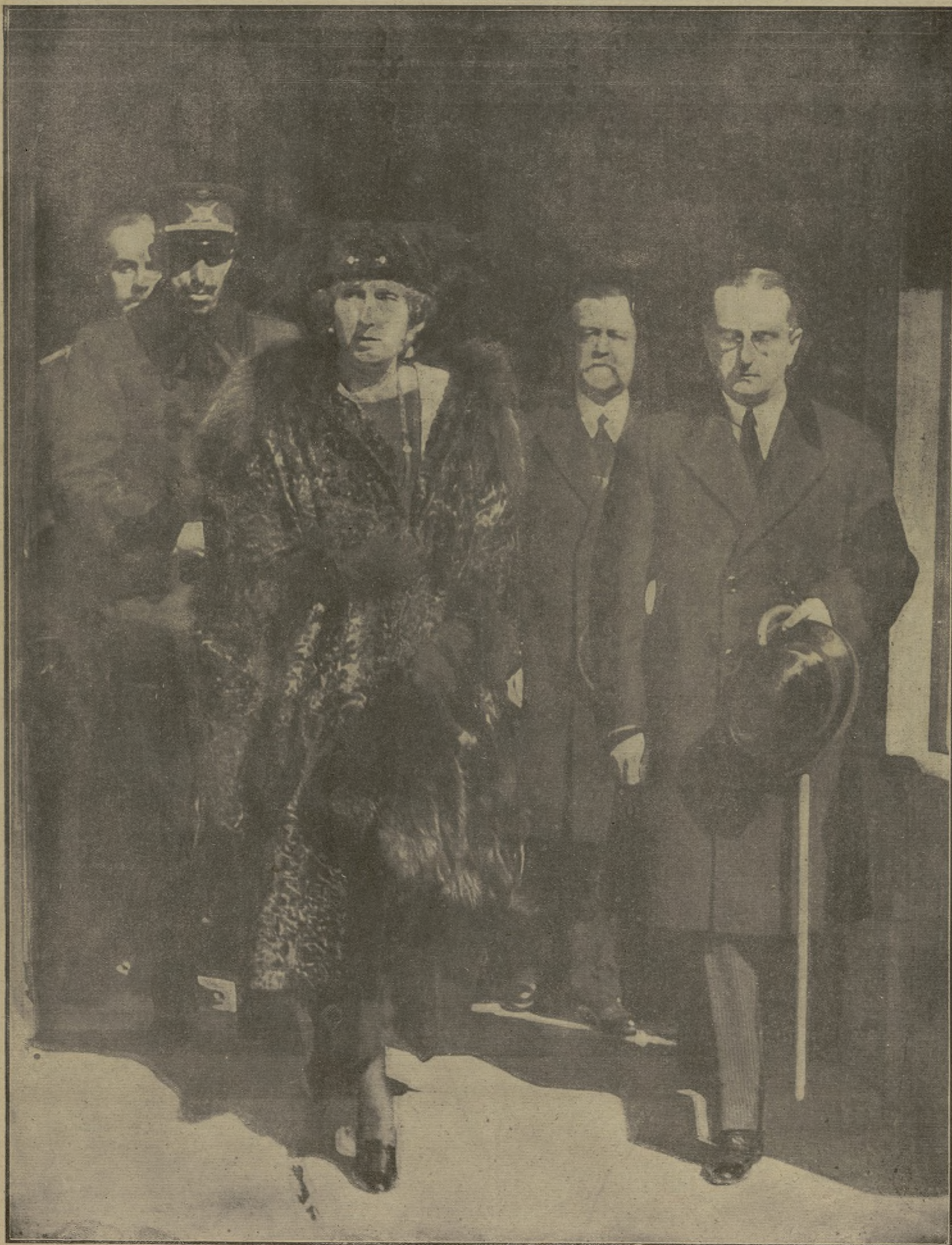
LOS REYES D. ALFONSO Y DOÑA VICTORIA SALIENDO DE LA CASA MORTUORIA DESPUÉS DE HABER OÍDO MISA EN LA CAPILLA ARDIENTE