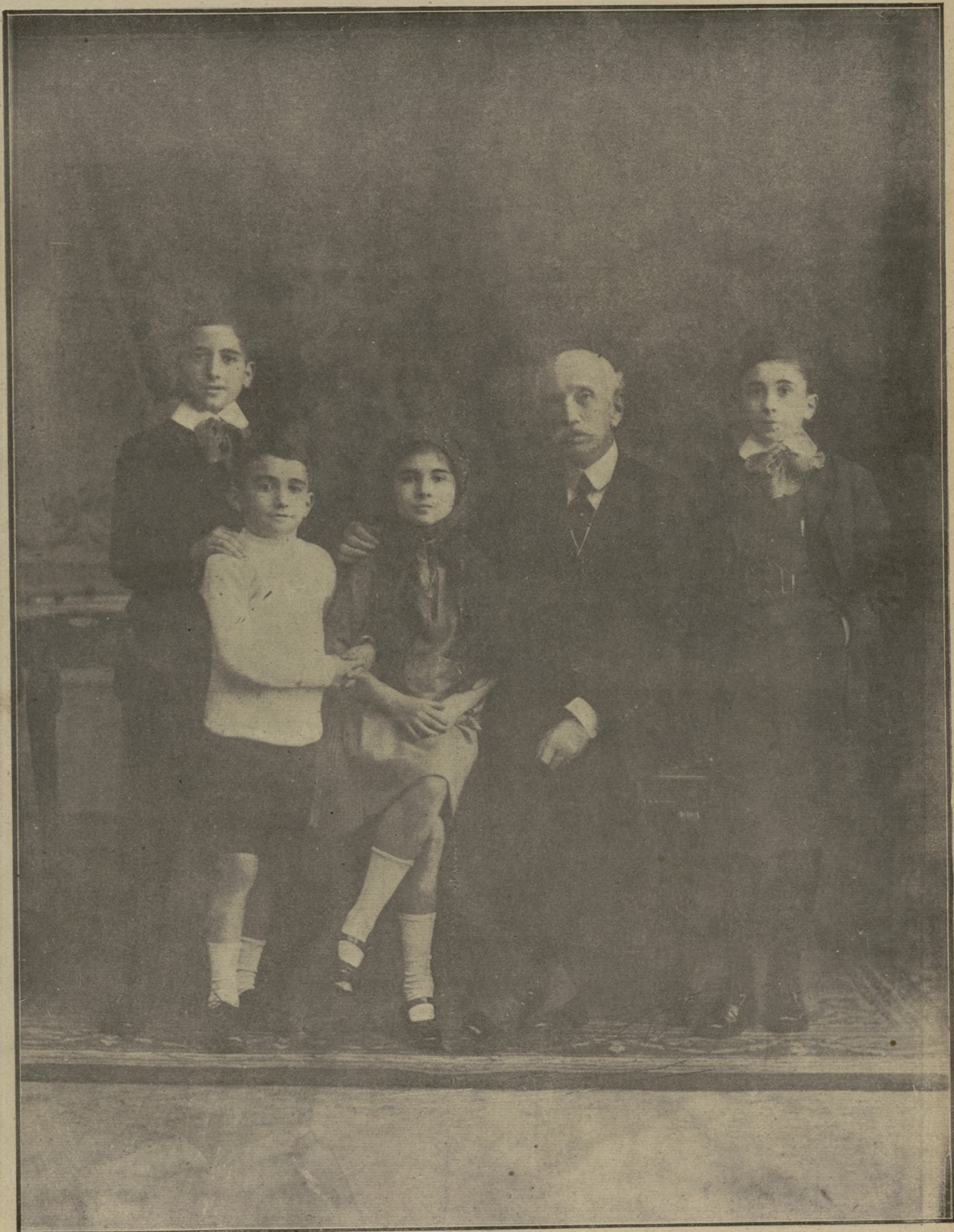
Una de las últimas fotografías de D. Eduardo Dato, en la que el presidente del Consejo aparece rodeado de sus nietos