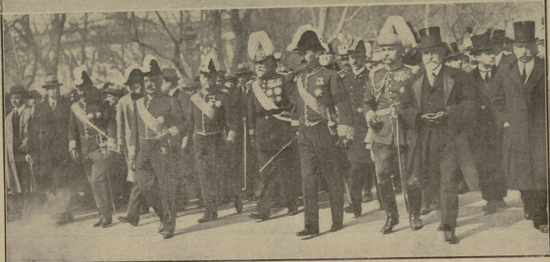
Su Majestad el Rey al frente del cortejo fúnebre.—El Gobierno y demás personalidades que formaban la presidencia del duelo Ayuntamiento de Madrid