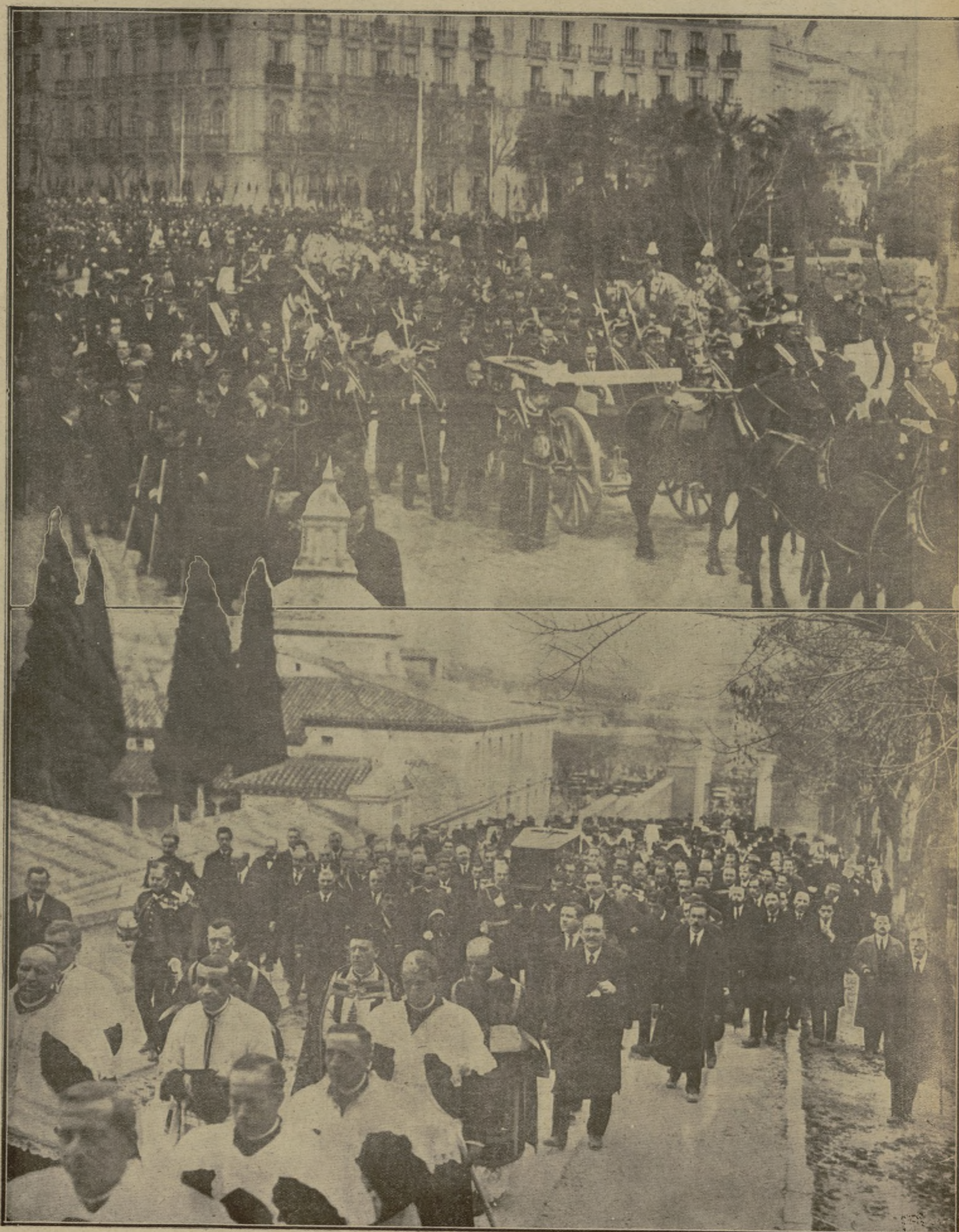
El cortejo a su paso por la plaza de Colón.--Entrada de la comitiva fúnebre en la Sacramental de San Isidro, donde fué sepultado el cadáver