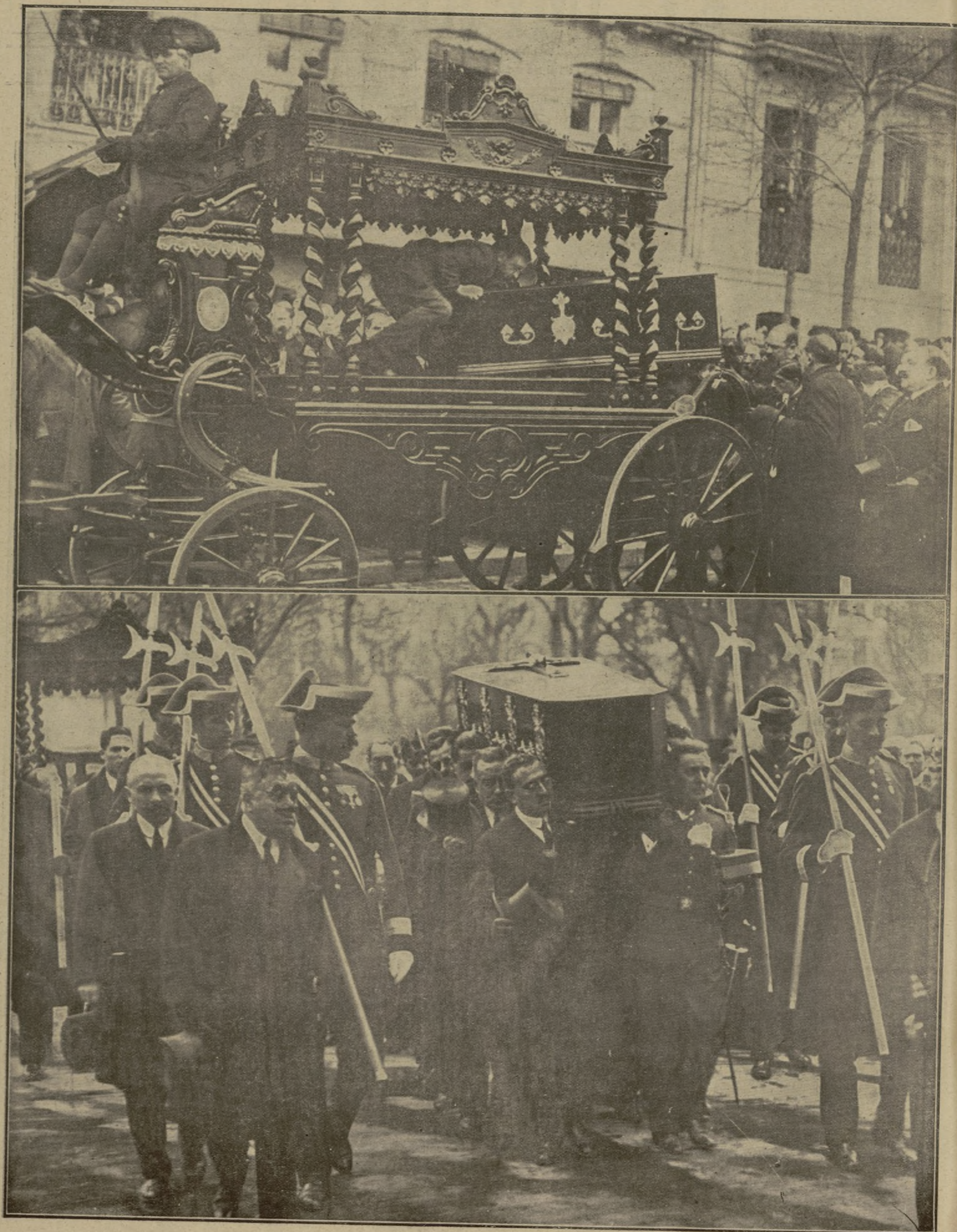
Momento de colocar el féretro en la carroza para su traslado desde el domicilio del Sr. Dato a la Presidencia del Consejo. — Los secretarios y familiares del presidente conduciendo el arca fúnebre al arnés de artillería, instantes antes de organizarse el entierro oficial