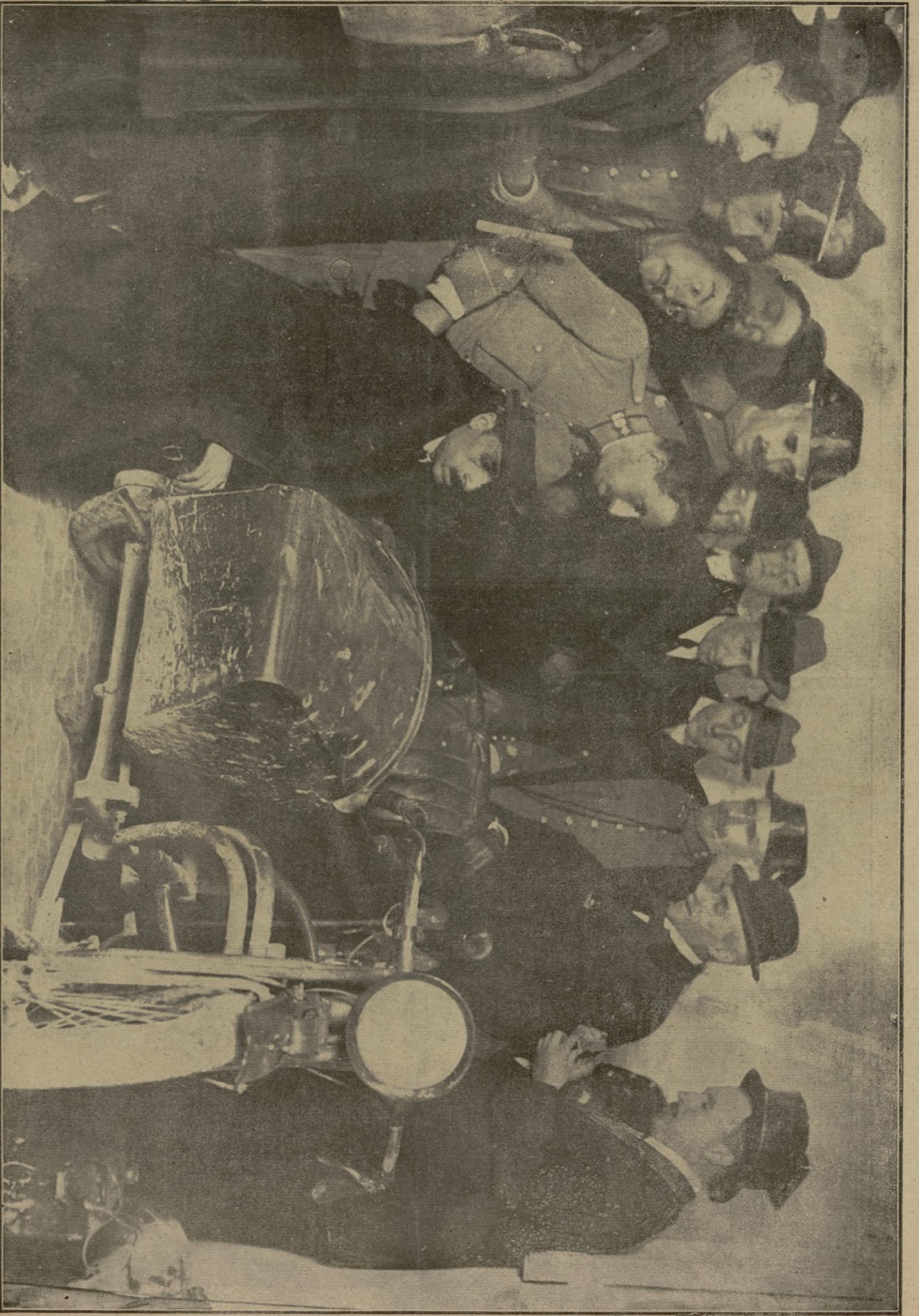
El juez instructor, el fiscal de la Audiencia, el teniente coronel de la Guardia civil, Sr. Pereda, y los inspectores del Gabinete dactiloscópico de la Dirección general examinando las huellas que las manos de los asesinos dejaron en la «motu»