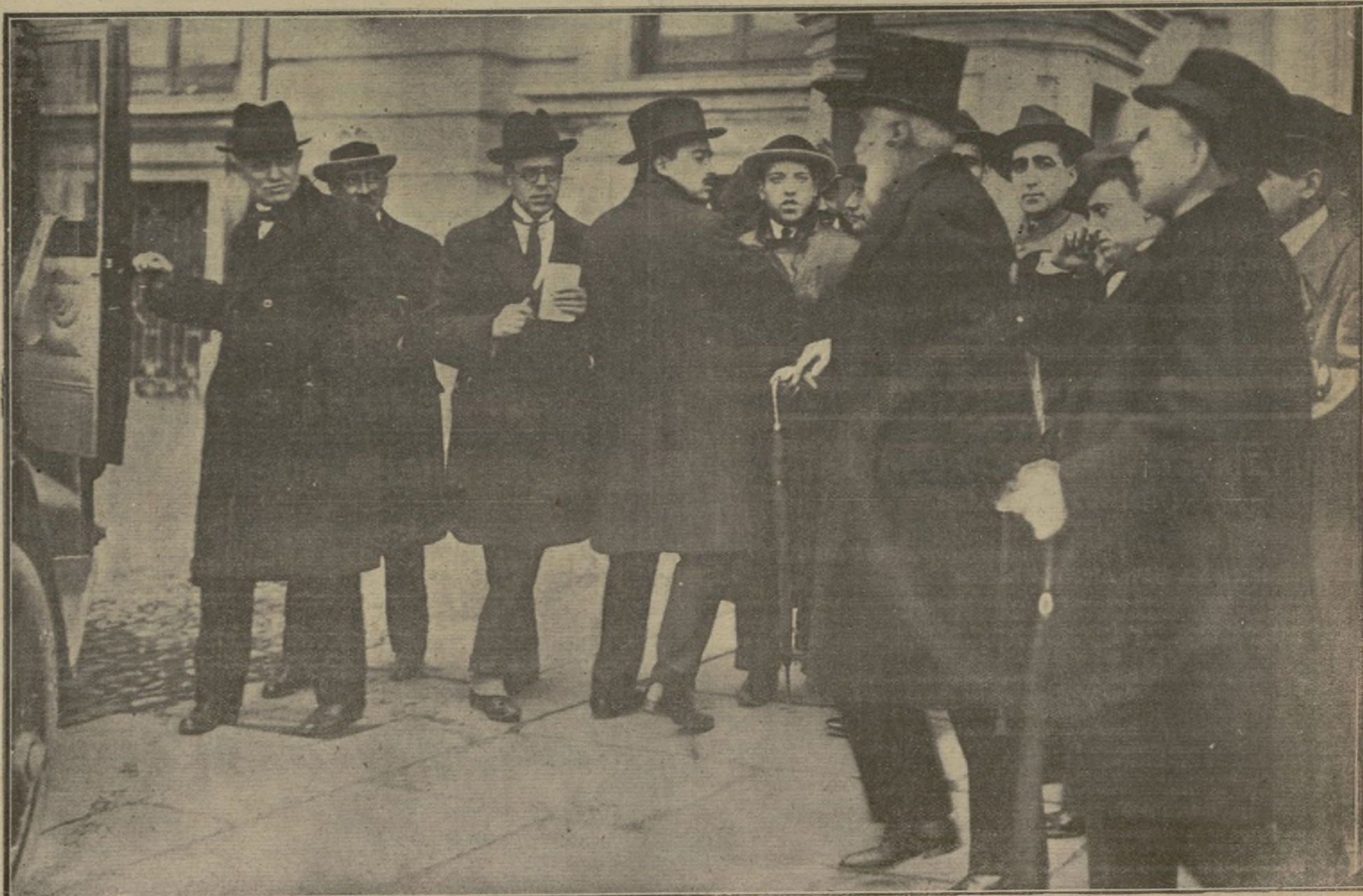
El señor conde de Bugallat a su salida de Palacio después de haber planteado la crisis. — D. Antonio Maura saliendo del regio Alcázar luego de recibir del Soberano el encargo de formar Gobierno