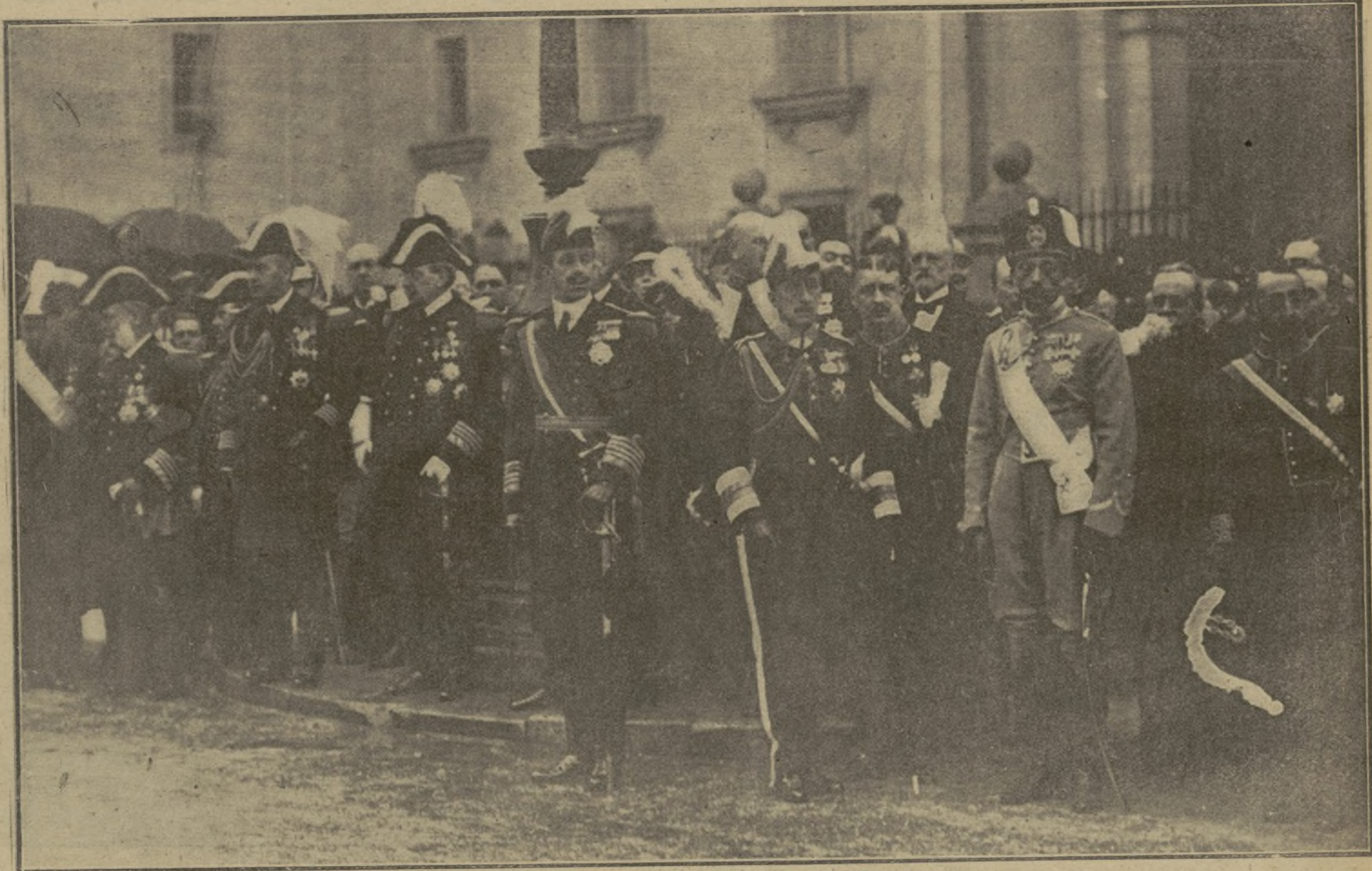
Su Majestad el Rey, a la salida de San Francisco el Grande, presenciando el desfile de tropas.