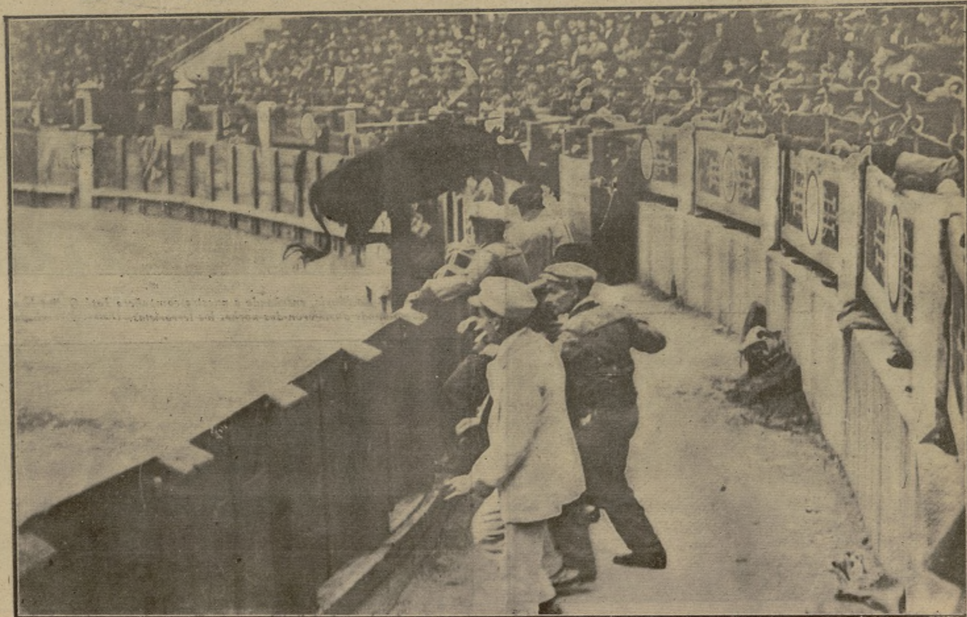
El toro acróbata, lidiado en sexto lugar, ejecutando uno de sus numerosos y limpios saltos.