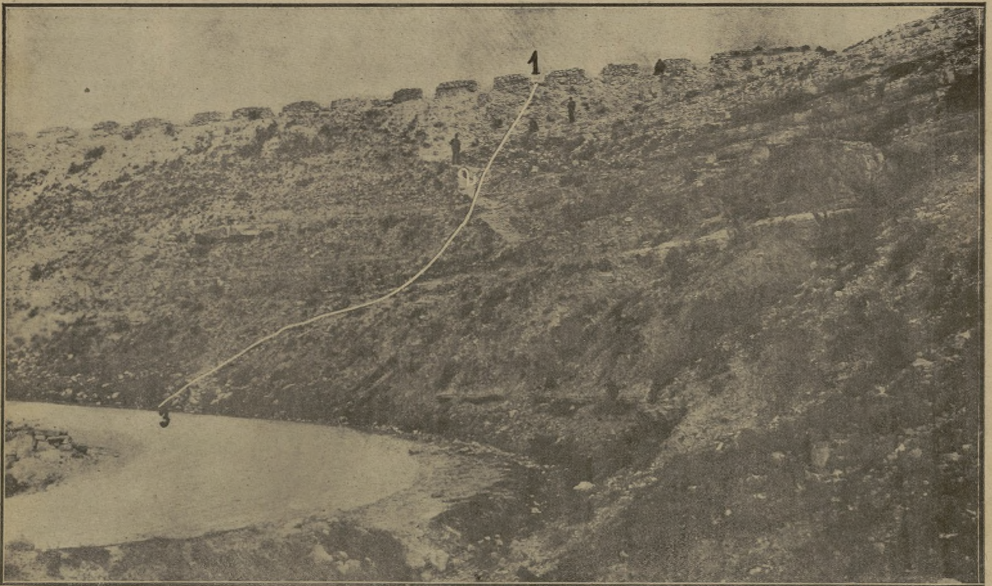
Revuelta de La Liebre, donde sufrieron el accidente los terroristas. El núm. 1 de la línea blanca indica el malecón por donde se despeñaron; el núm. 2, lugar donde fueron despedidos de la "moto" y se agarraron a unos tomillos, y el núm. 3, sitio hasta donde rodó la motocicleta.