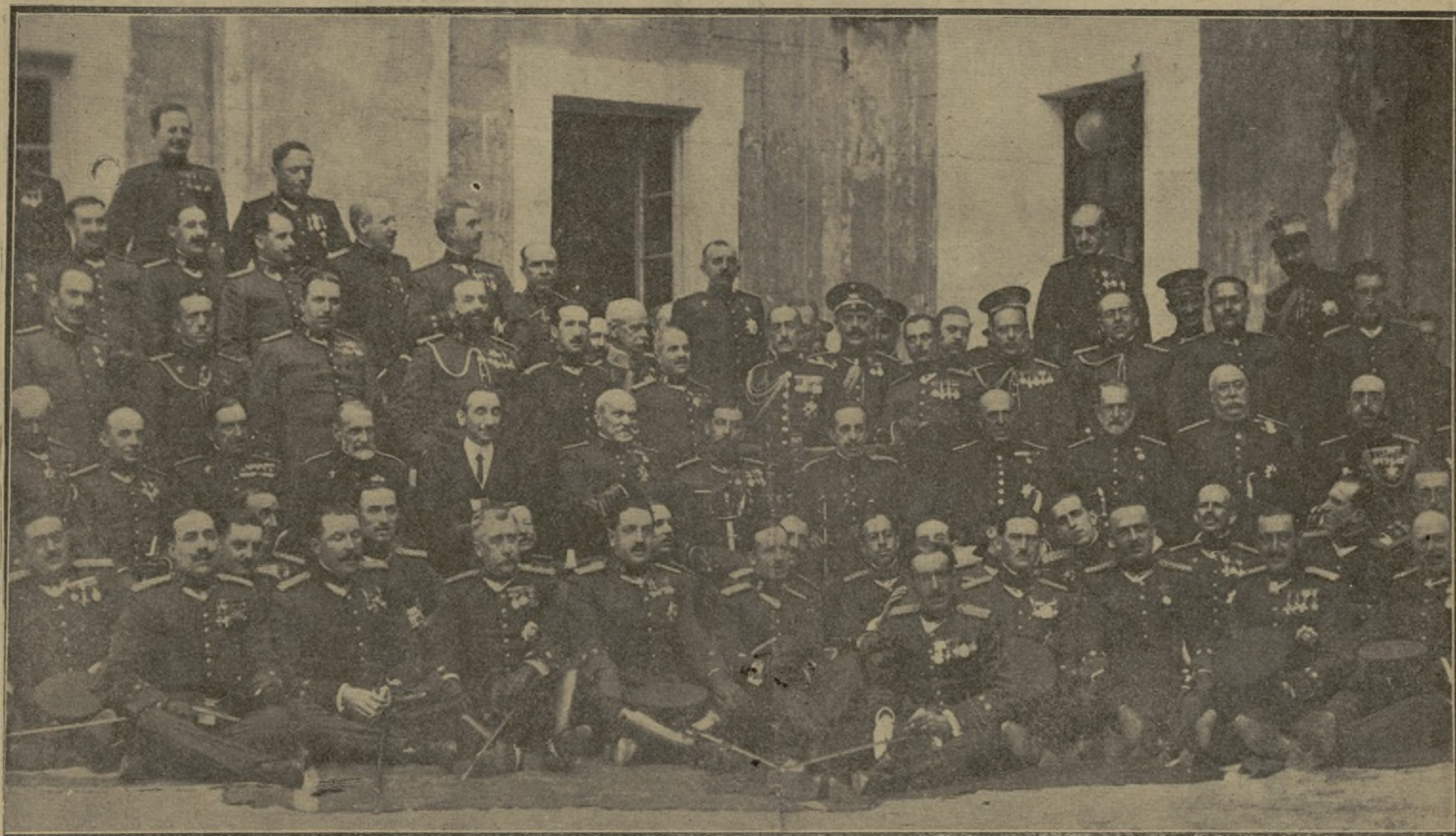
S. M. EL REY CON EL MINISTRO DE LA GUERRA, EL CAPITÁN GENERAL DE LA REGIÓN Y EL CORONEL, JEFES Y OFICIALES DEL REGIMIENTO DE LEÓN, DURANTE LA VISITA QUE HIZO AYER MAÑANA EL SOBERANO AL CUARTEL DEL ROSARIO