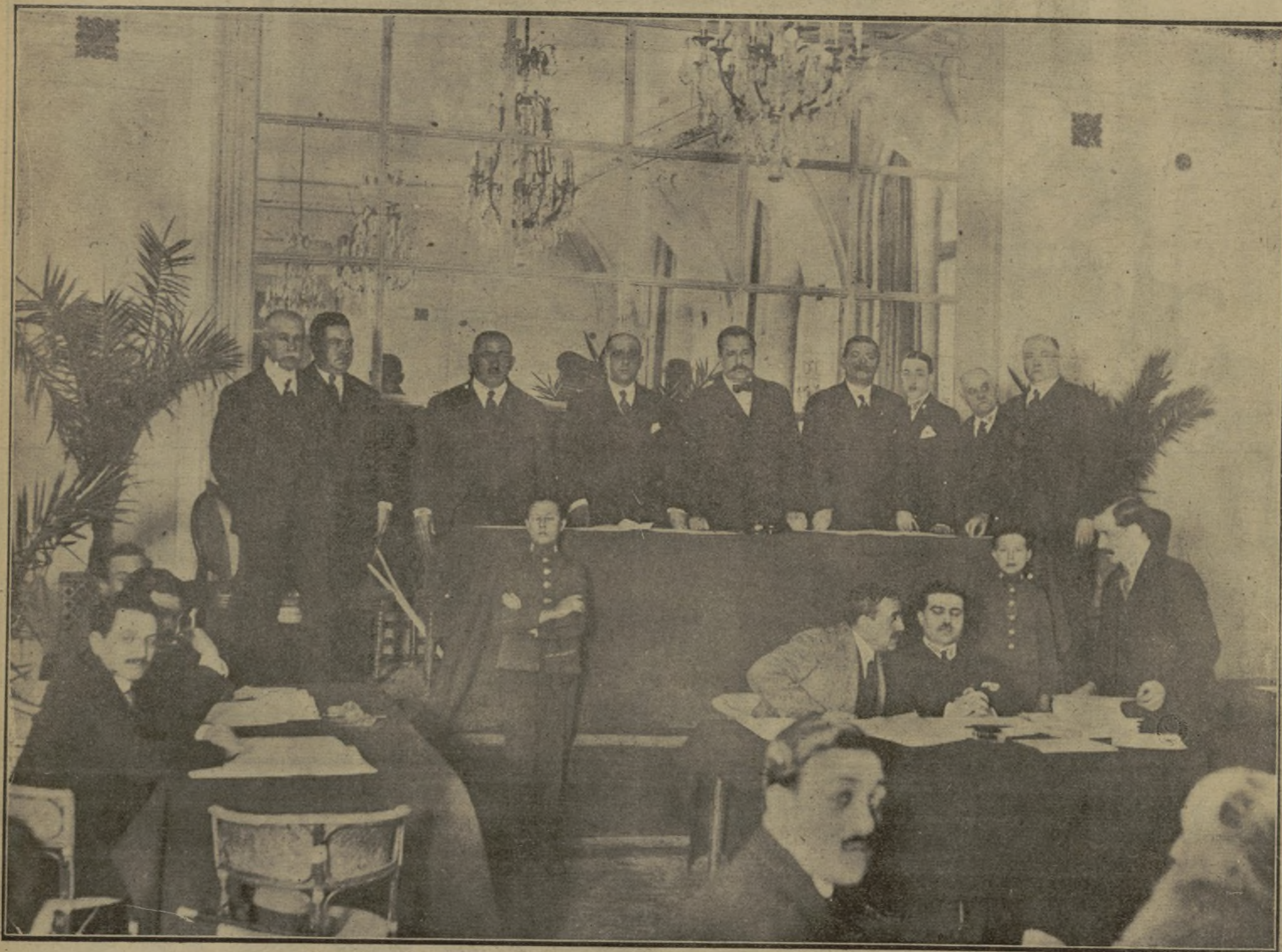
MESA PRESIDENCIAL DE LA ASAMBLEA DE FONDISTAS, INAUGURADA AYER TARDE EN EL HOTEL RITZ