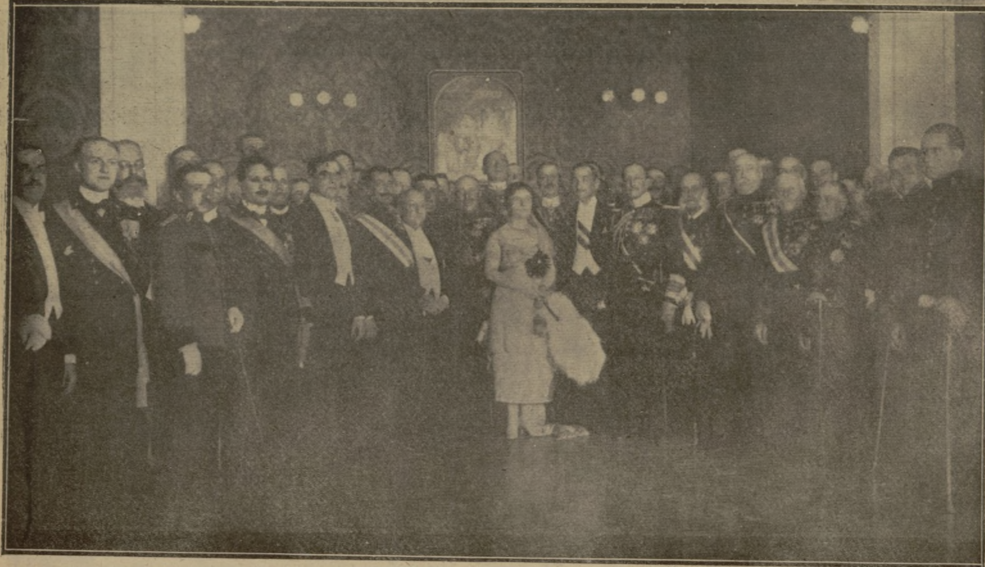
LAS BANDERAS ITALIANAS Y LA DEL REGIMIENTO DE SABOYA, DEL QUE ES CORONEL HONORARIO EL REY VÍCTOR MANUEL, DESFILANDO ANTE PALACIO.—RECEPCIÓN CELEBRADA EN LA EMBAJADA DE ITALIA EN HONOR DE LOS MILITARES Y MARINOS DE AQUEL PAÍS QUE HAN ESTADO EN MADRID DE PASO PARA LISBOA