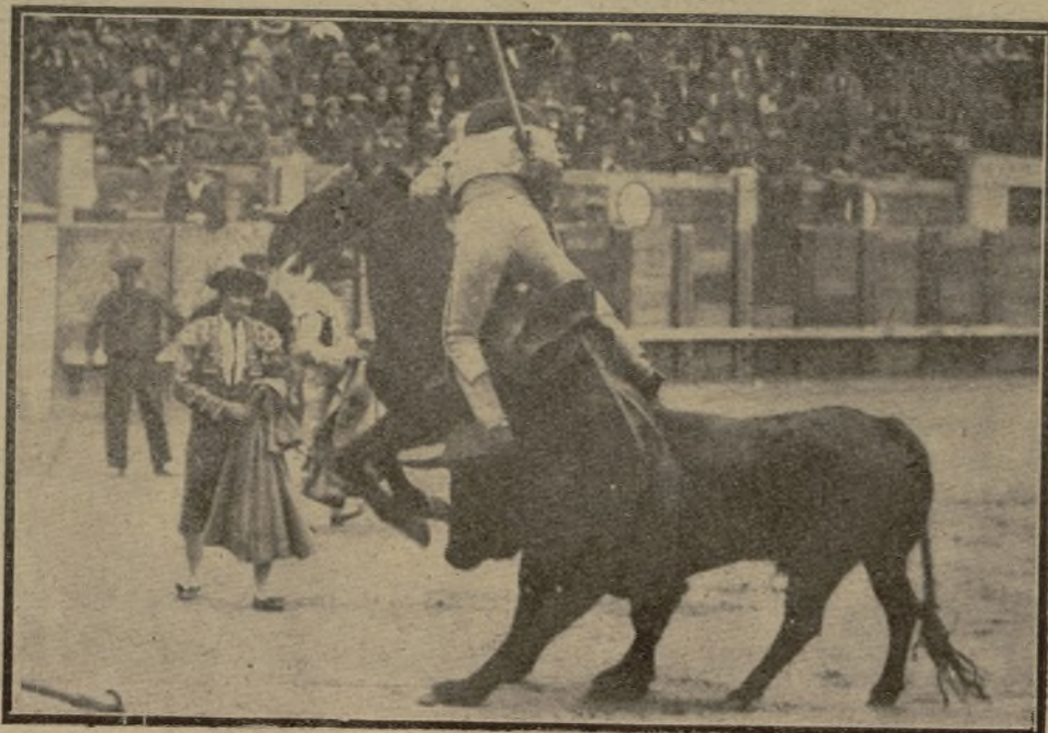
UN BUEN PUYAZO