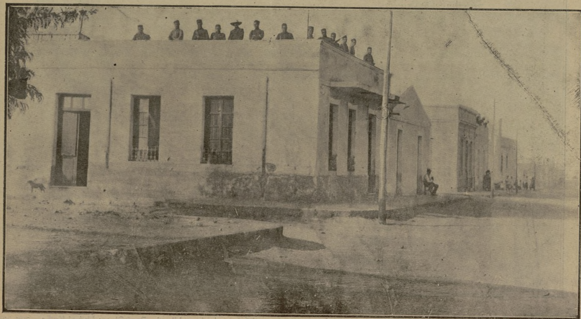
Azoteas del barrio del Real, de Melilla, tomadas militarmente en previsión de que el enemigo intente un ataque a la plaza