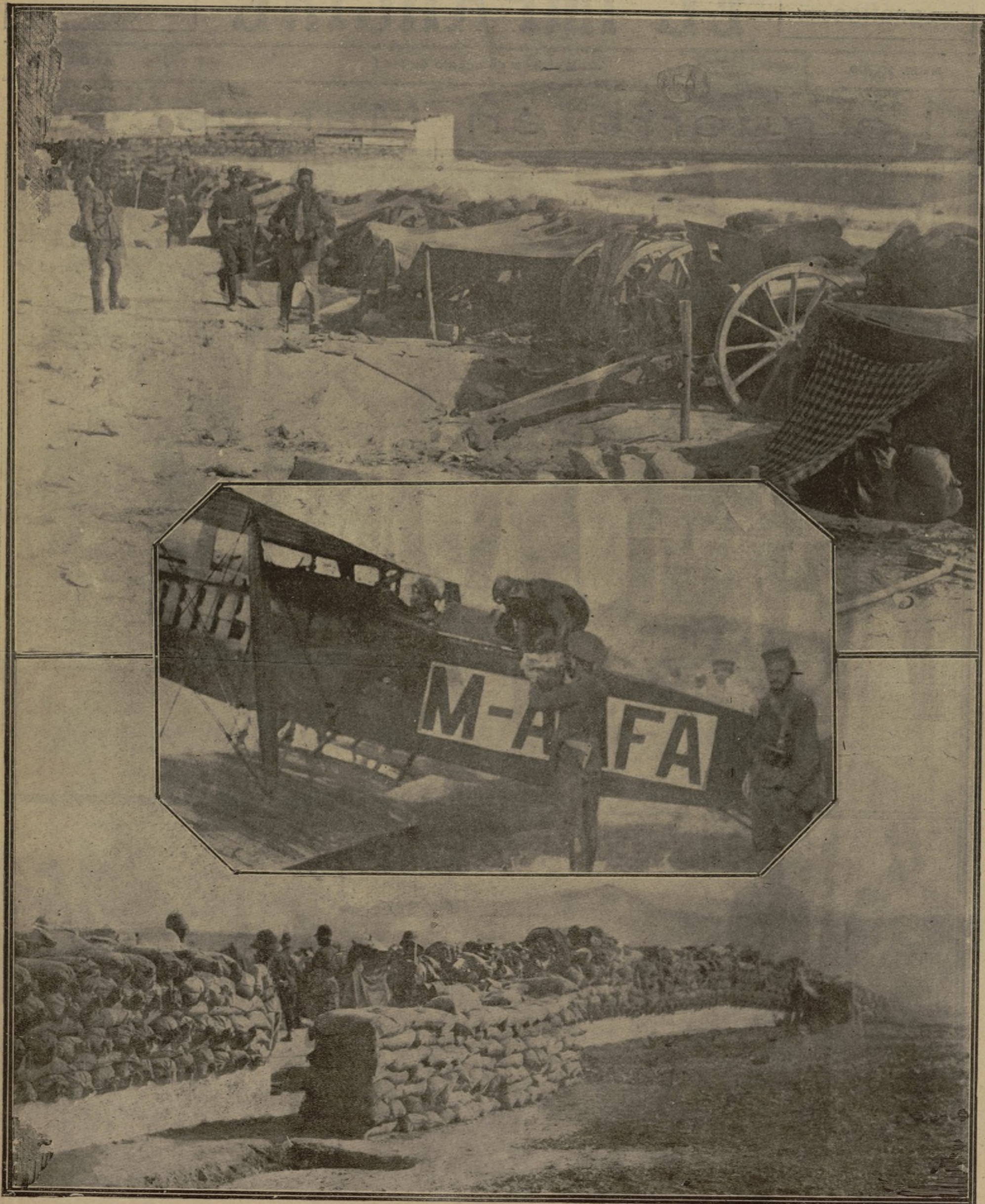
Dos detalles del campamento establecido en el zoco El Had de la cabila de Beni-Sicar.—En el centro, el capitán Manzaneque aprovisionándose de viveres y municiones, que luego dejó caer desde su aeroplano en Monte Arruit