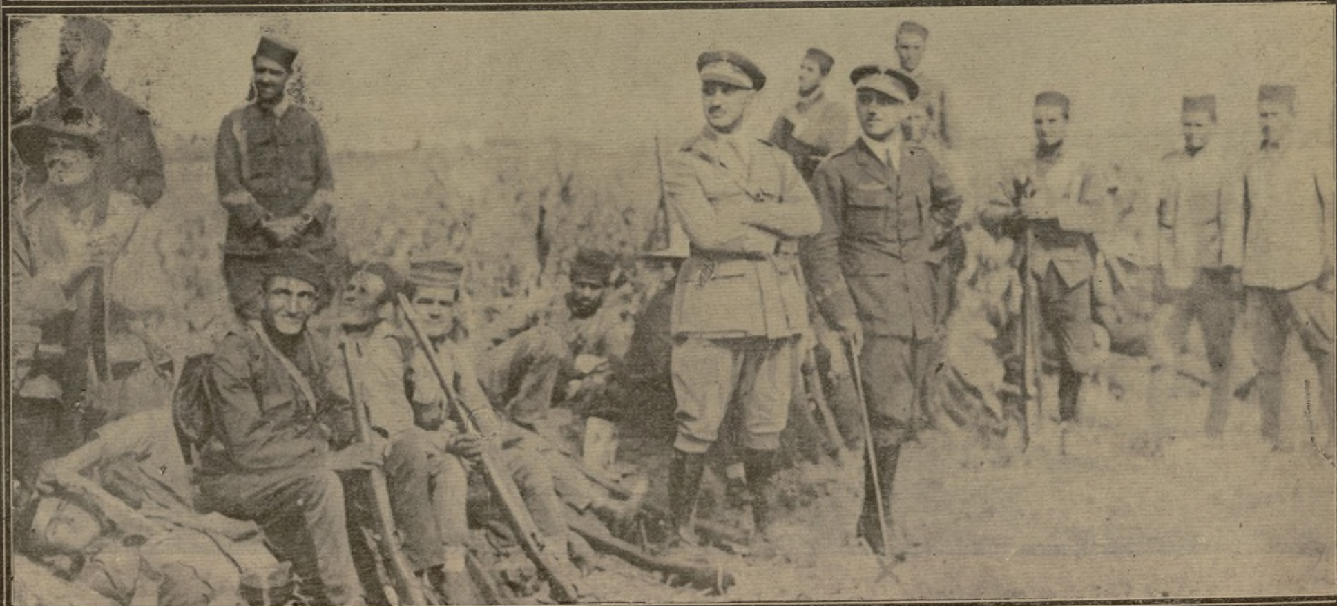
El Infante D. Alfonso, a su llegada a Melilla, saludando al coronel Souza. — El capitán Montaut, herido el día 23 al proteger desde su aeroplano la retirada a Monte Arruit de la columna Navarro