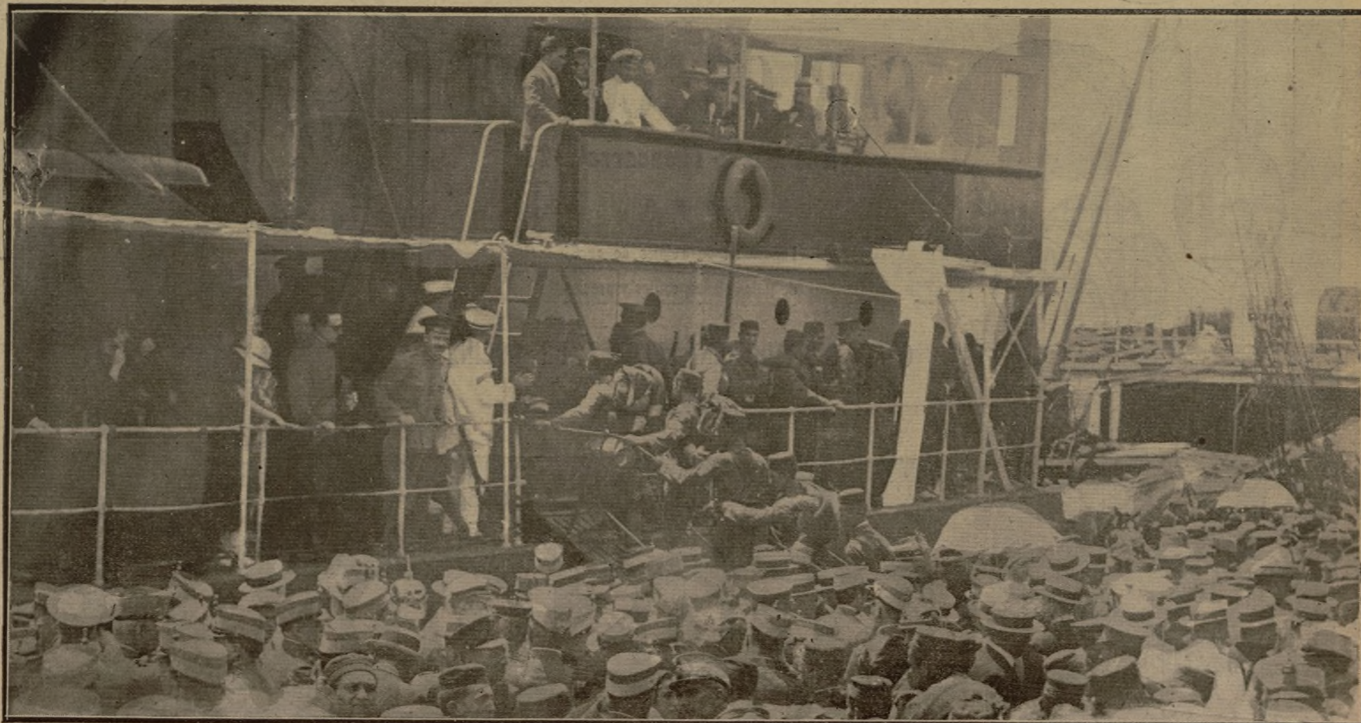
El regimiento de Sevilla embarcando en Cartagena en el vapor «Rius y Taulet»