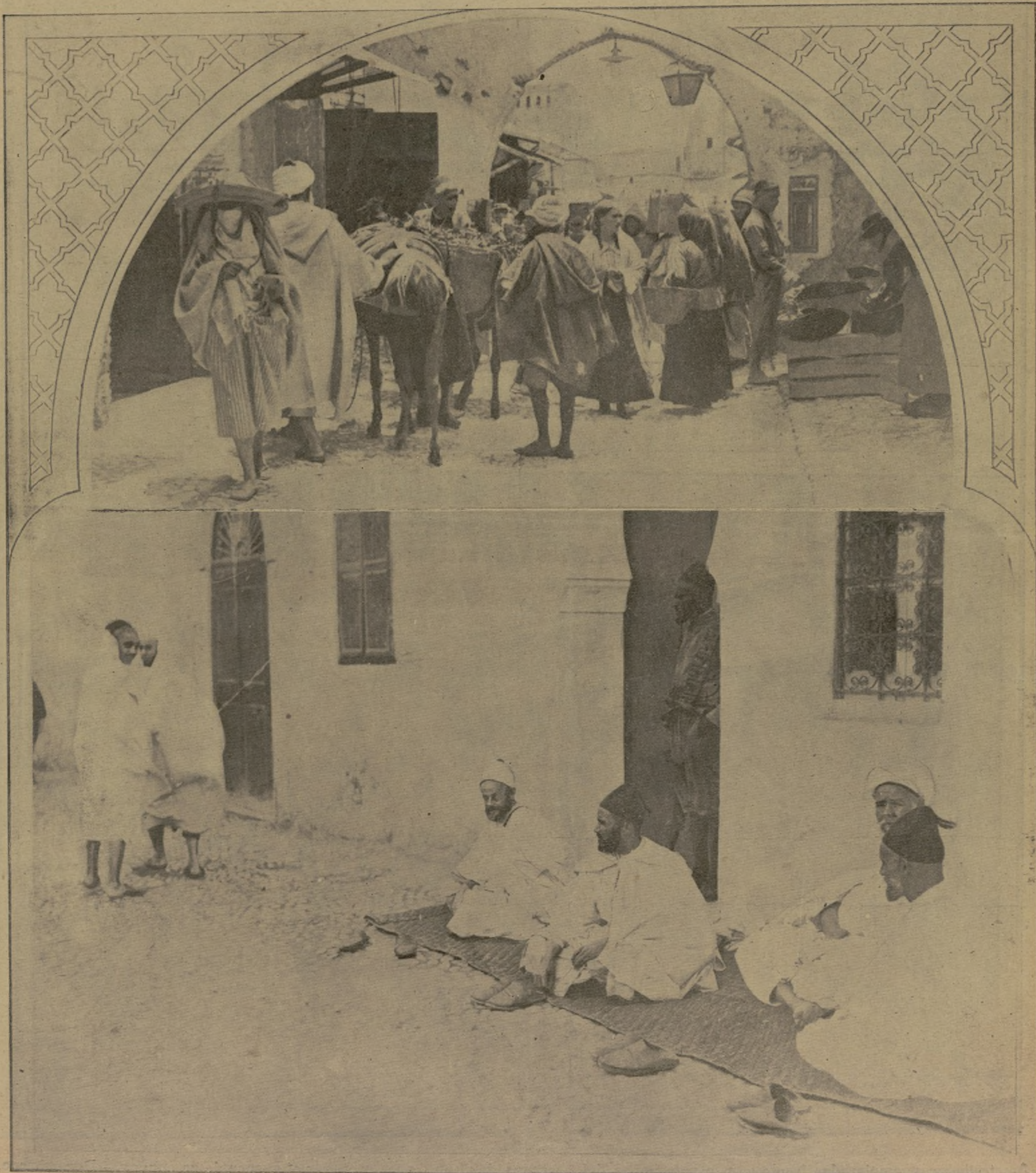
Un zoco en Tetuán.—Moros notables esperando audiencia a la puerta de la residencia del Jalifa