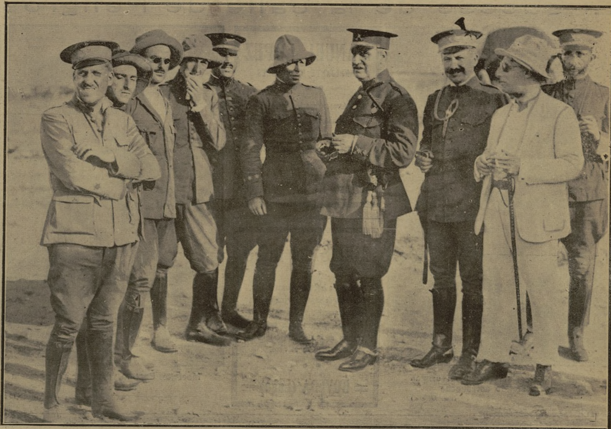
El general gobernador de Melilla hablando con los jefes y oficiales del regimiento de Córdoba