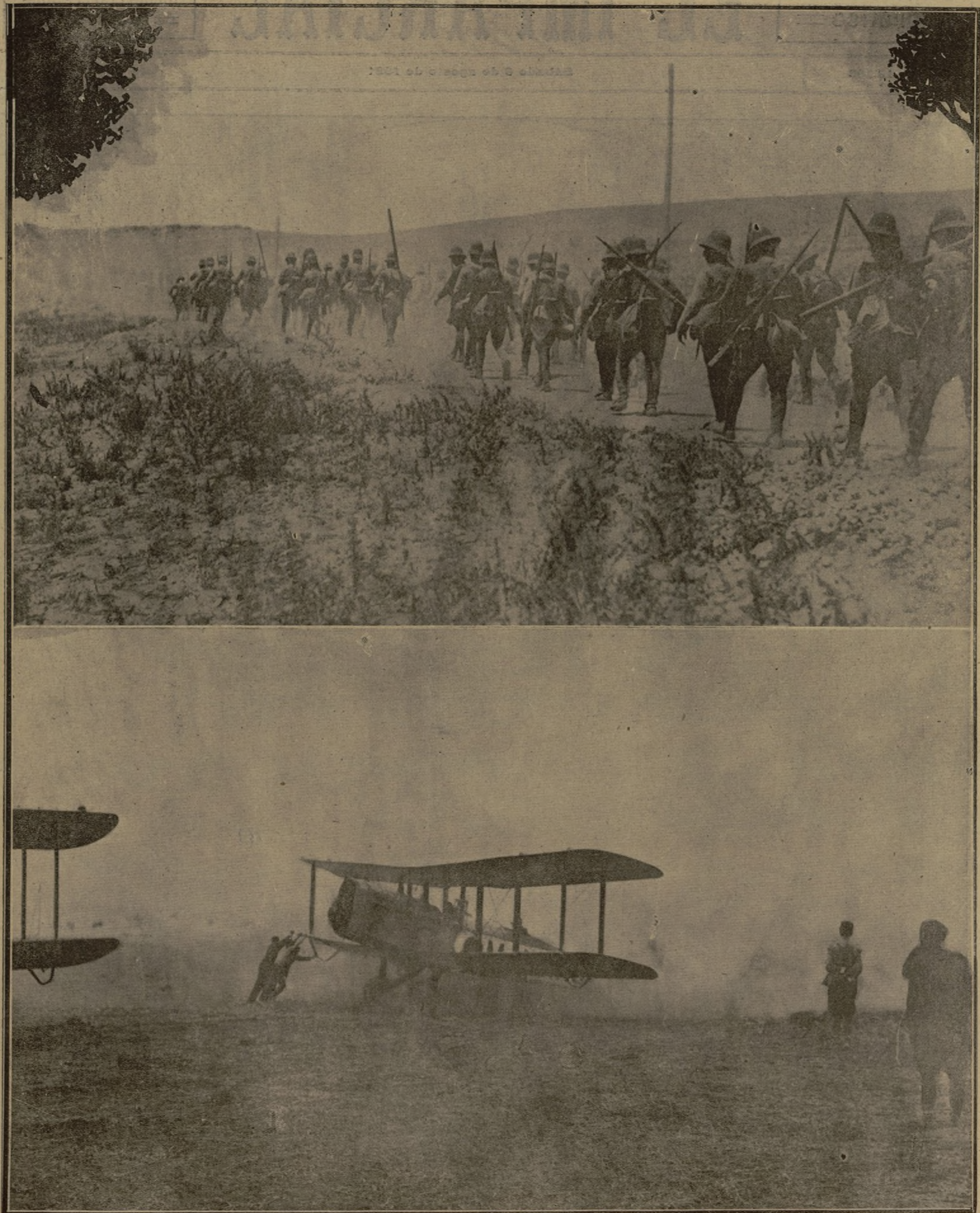
Una columna en marcha para ocupar una posición avanzada y construir un blocao. — El aeroplano que tripula el capitán Marzaneque y que a diario efectúa el aprovisionamiento del Monte Arruit, en el momento de emprender uno de sus vuelos