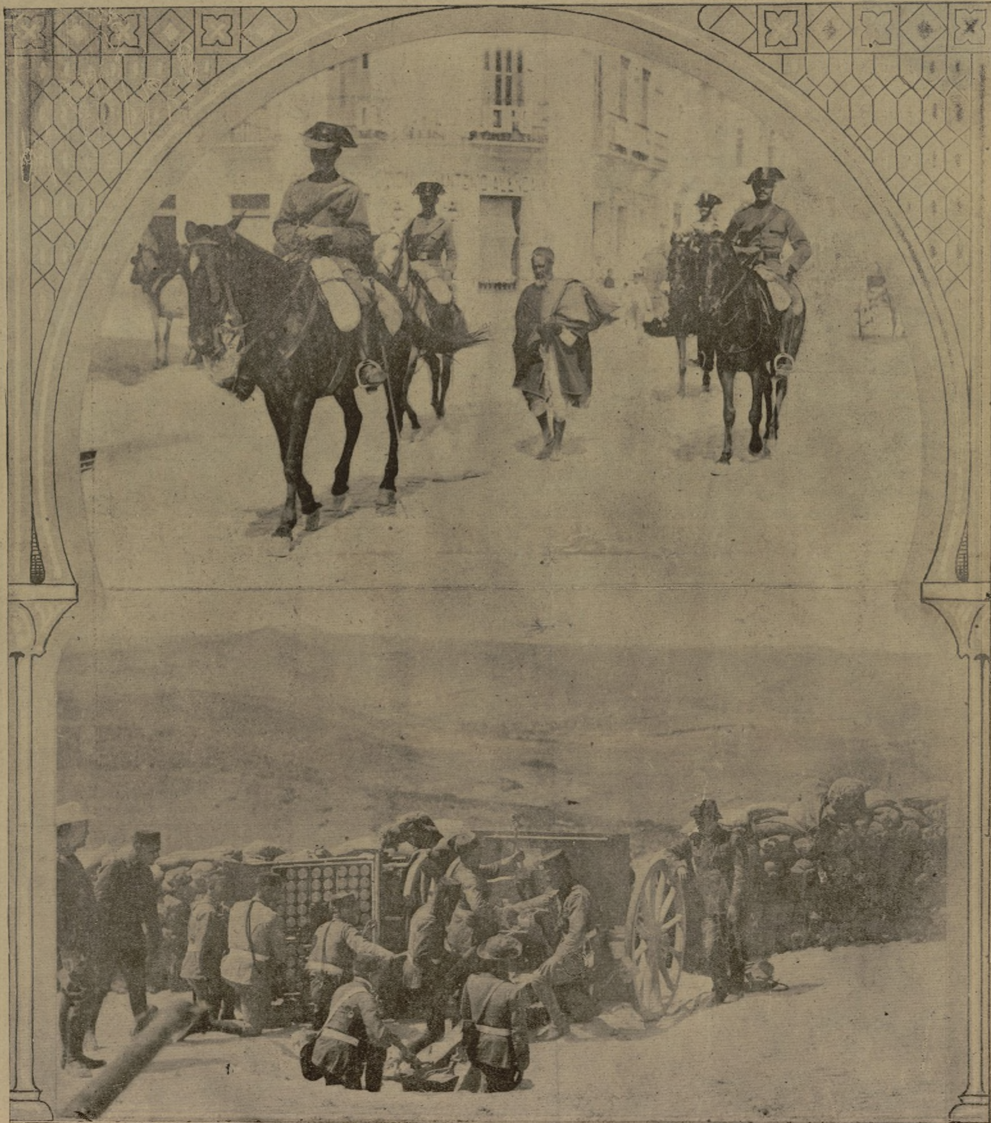
Un espía moro conducido por la Guardia civil. — Una batería del 4.º ligero dispuesta a hacer fuego desde el Atalayón contra los rebeldes que hostilizan el paso de los convoyes