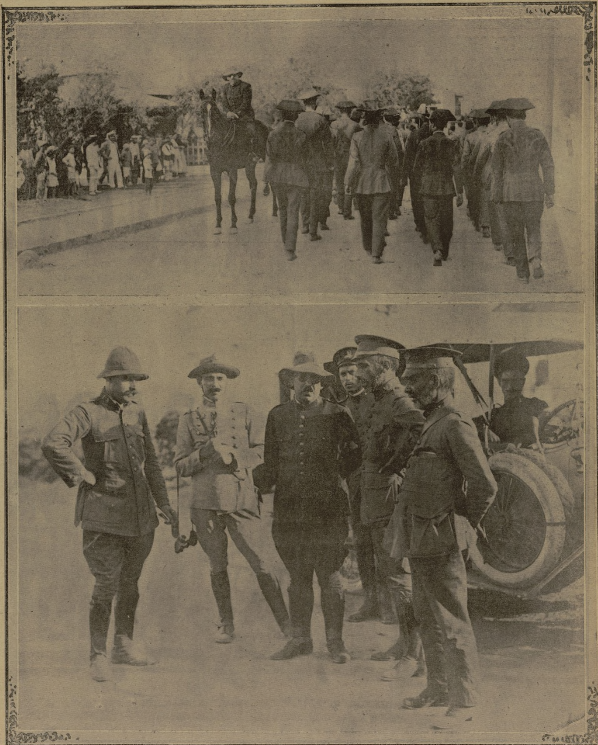
El general Sanjurjo presenciando el desfile de los defensores de Nador a su llegada al cuartel de San Fernando, de Melilla. — El general Sanjurjo acompañado del teniente coronel Pardo y del comandante Almeida, al llegar al Atalayón a su regreso de Nador, donde las escasas fuerzas que lo guarnecían realizaron verdaderos actos de heroísmo