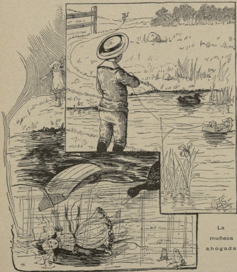
La muñeca ahogada

—¿Dónde están Julio y María?—preguntábase una madre recorriendo el campo en busca de sus hijos, que habían salido de la granja inmediata. Ni en el prado, ni en ningún sende-