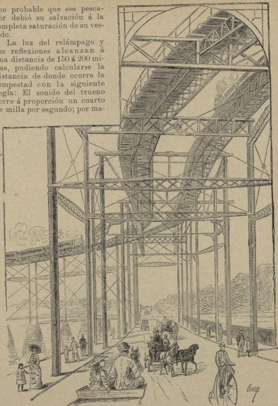
Un viaje en ferrocarril

La luz del relámpago y sus reflexiones alcanzan á una distancia de 150 á 200 millas, pudiendo calcularse la distancia de donde ocurre la tempestad con la siguiente regla: El sonido del trueno corre á proporción un cuarto de milla por segundo; por ma-