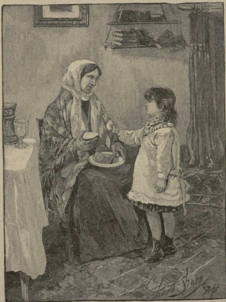
EL PRIMER HUEVO DE LA GALLINA