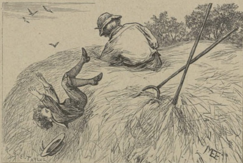
Cayéndose de las alturas