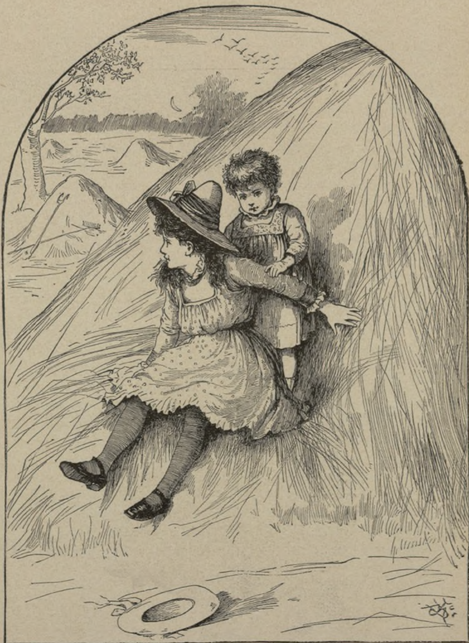
En el heno