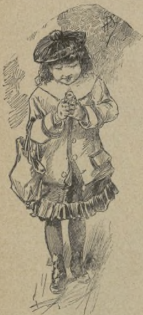
El primer huevo de la gallina

Comenzaré por recordar á mis camaradas aquel célebre 2 de Mayo de 1808. ¿No sabéis que era aquel el día en que los infantes D. Antonio y D. Francis-