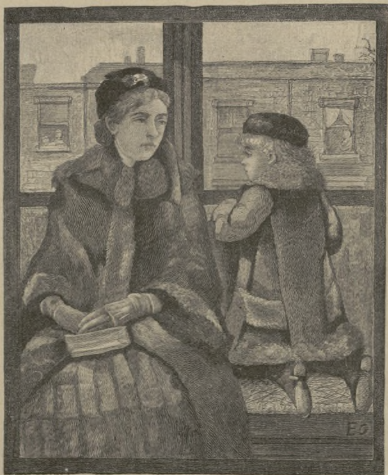
Un viaje en ferrocarril

H oy tenía el propósito de hablaros de cosas muy bellas y agradables. Barcelona aparece convertida en un ascua de oro, y sus esplendores fastuosos dan lugar, más que para escribir una reseña, para componer otro volumen á estilo de las Mil y una noches . Pero es el caso que hace más de doce horas que está diluviando de una manera espantosa, y las galas de la ciudad aparecen envueltas entre raudales cristalinos, y su cielo ceñido por