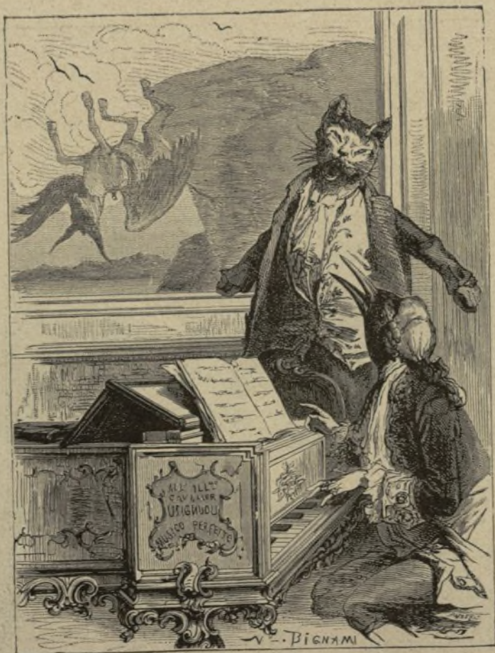
El gato y el ruiseñor

El claustro de la Catedral es obra de fines del siglo xiv ó principios del xv. Lo principió el arquitecto Roque, lo continuó Gual y cerró su última bóveda Andrés Escuder. Aunque más ligero y caprichoso, su estilo responde al del templo. Merecen ciertamente especial atención las esbeltas columnas que sostienen los arcos en gradación de ojiva, y en sus múltiples y variados ca-