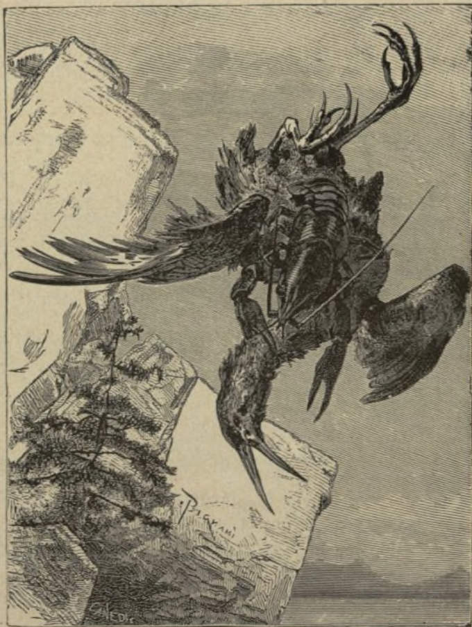
Contra los poderosos ayuda la astucia

Vivía cierta vez á orillas de un lago un pajarraco que, habiéndose hecho