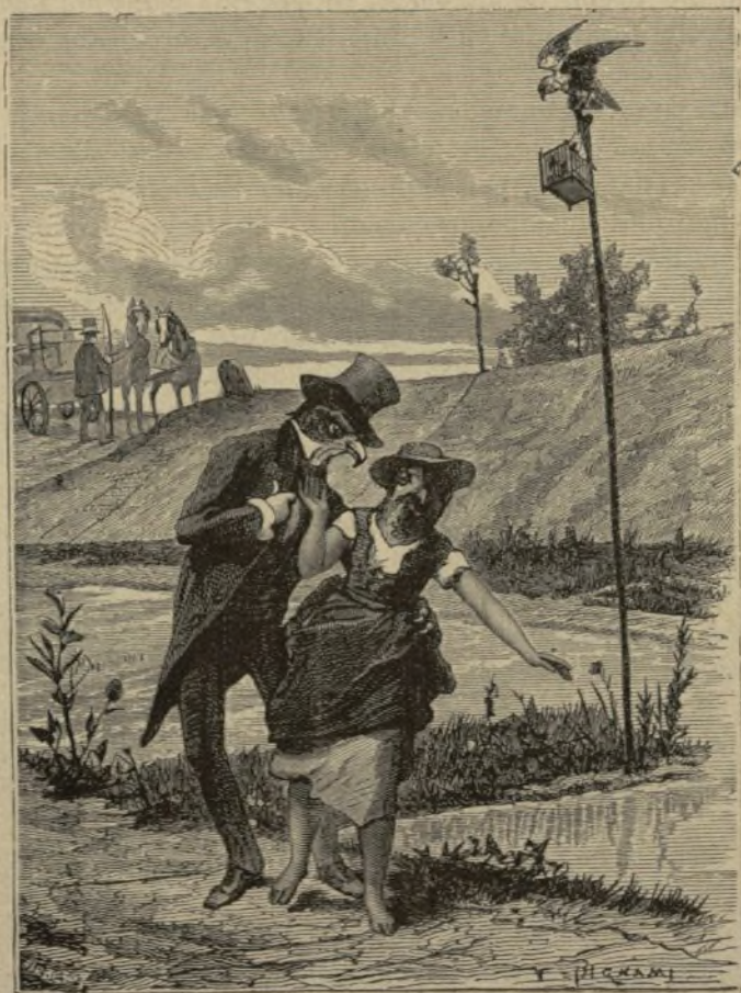
No hay que fiar de las promesas largas