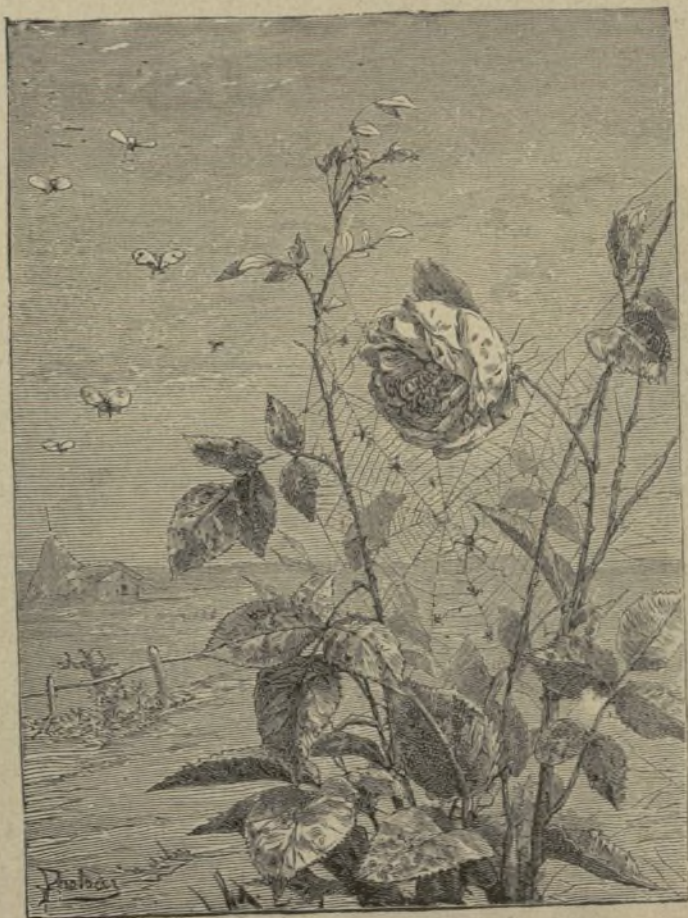
La rosa soberbia

El azorado niño, no atreviéndose á desobedecer á su mamá, salió, más muerto que vivo, de su estancia, y en la sala vió á Marcelo entre las dos mujeres, pálido, con la cabeza vendada y con manchas de sangre fresca en el vendaje.