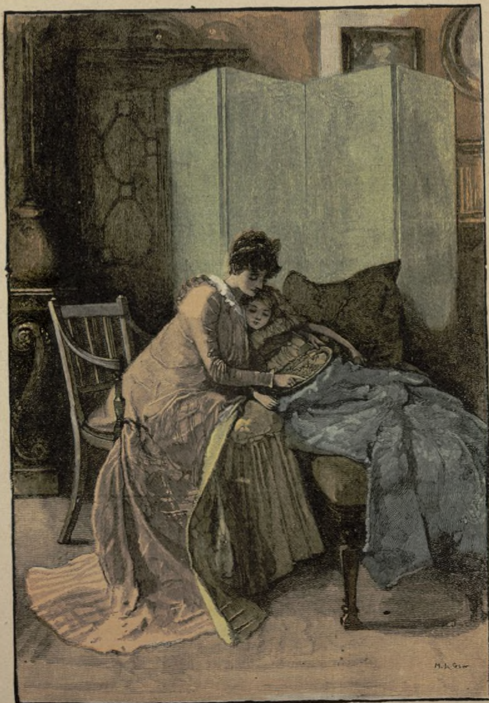
Ayuntamiento de Madrid LA ENFERMITA