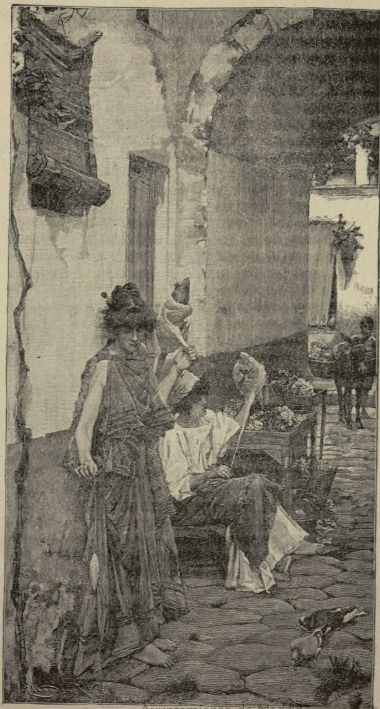
Ayuntamiento de Madrid Hilanderas romanas