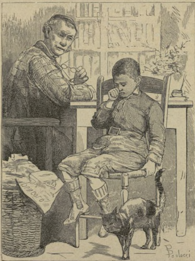
El niño y el gato

nuevo su hacha, formó otra abertura en el techo, y la col creció tanto que al fin llegó al cielo. ¿Cómo podía el pobre hombre alcanzar entonces la cabeza de la col? Comenzó á trepar por el troncho, y con tanta insistencia que, por último, pudo tocar con las manos en el cielo, donde practicó también una