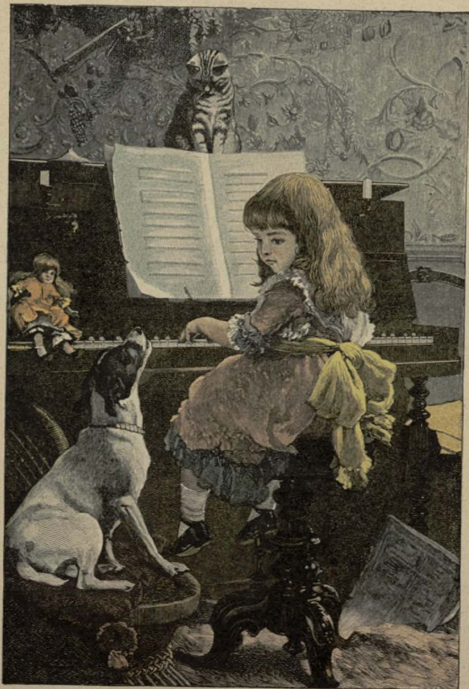
DIFERENTES EFECTOS DE LA MÚSICA Ayuntamiento de Madrid