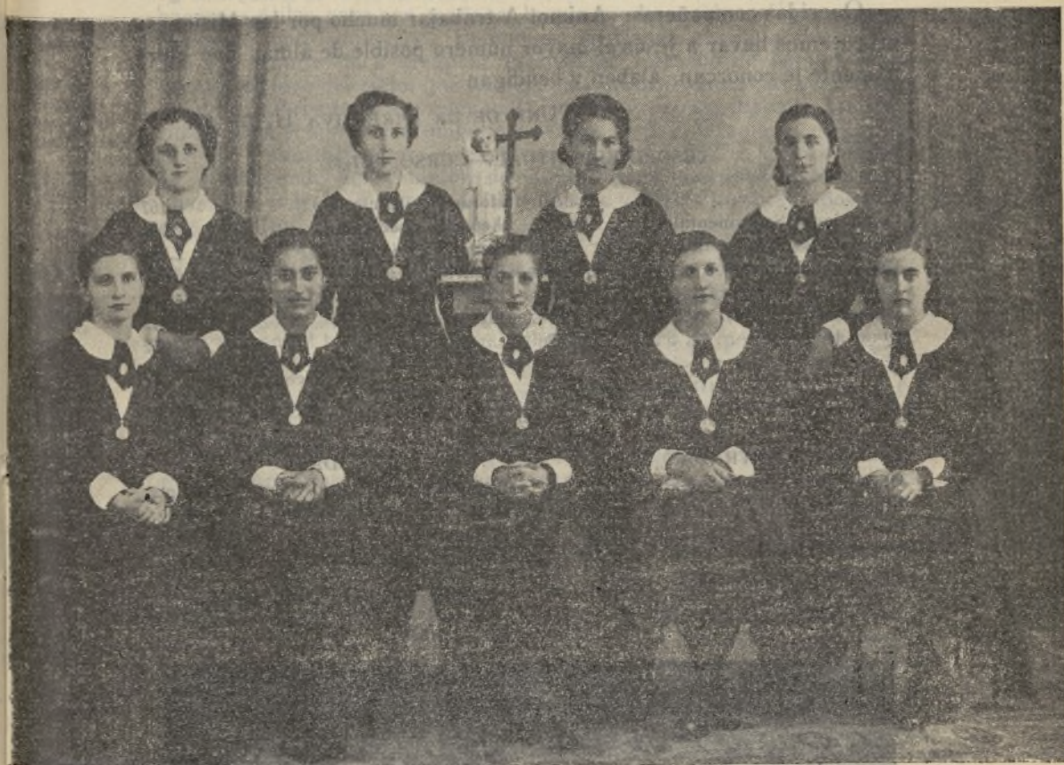
Directiva Juventud Misionera, Salamanca.