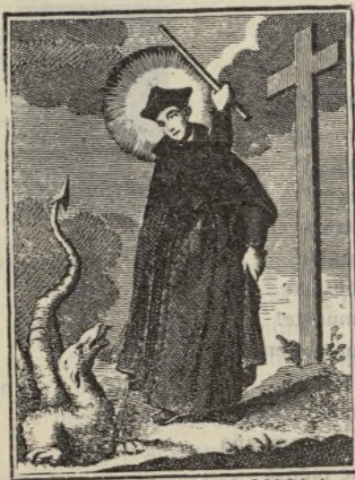
S IGNATIVS LOYOLA Denuñan per contemptū baculo abigit

A los que vocean en toda clase de tonos los gloriosos caracteres que ha producido nuestra Patria; a los que buscan con ansia entre empolvados pergaminos los orígenes de nuestras ciudades y de nuestros apellidos; a los que estudian con paciencia de psicólogo las cualidades de nuestra raza, sin llegar a definirla nunca, ¡tal es su complejidad! a todos, en fin, que todos nos sentimos orgullosos de haber abierto los ojos a la luz bajo el dosel azul del firmamento español, débenos ser de gran estudio y especial reflexión la silueta de Iñigo de Loyola, que la incesante movilidad del tiempo nos ofrece.