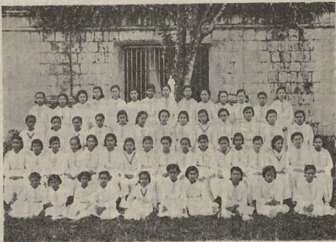
Tenemos una misión: extender la fe de Jesucristo al Oriente pagano.