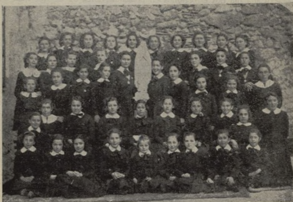
Aunque pequeñas también somos misioneras. Jesús, Niño Misionero, sabe de nuestras visitas al Sagrario y a las huchas