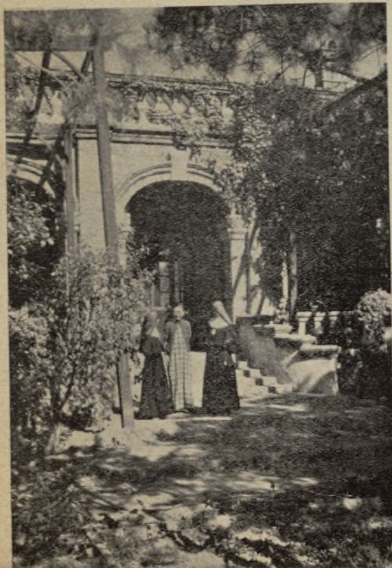
Ante el pórtico del nuevo templo de Cristo Rey MM. Carmen e Ignacia con su Profesora de chino

Era lo primero el edificio: lo han logrado, aun cuando la parte económica espera todavía aportaciones urgentes. El palacio se ha santificado y hasta las viejas pagodas que había en su parque se van santificando. ¡Cómo estaba aquélla cuajada de Budas y ennegrecidas sus paredes por el humo secular de las ofrendas paganas! Hoy está allí entronizado Cristo Rey.