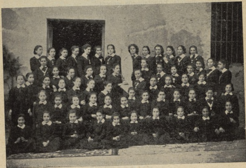
Y el calor misional en su punto, sosteniendo a unas firmes en el deber bien cumplido, por aquello de...

Y el calor misional en su punto, sosteniendo a unas firmes en el deber bien cumplido por aquello de : que en la Gramática del cielo se da más importancia a los adverbios que a los verbos, porque no basta obrar, sino que es preciso obrar bien : estimulando a otras con el ejemplo y a todas sin decir nunca basta cuando de las Misiones se trata, pues por algo hemos de educarnos en Colegio de aquella Madre Cándida, corazón de apóstol, que al igual