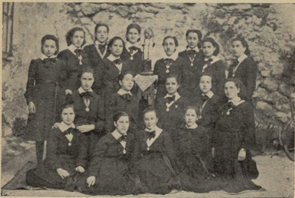
También nosotras misioneras desde aquí

Febrero. —Días de penitencia y de reparación los que se acercan y de atraer gracias sobre nuestra Patria.