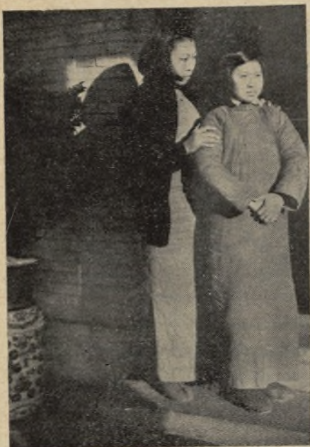
Poco a poco van acercándose a la puerta de la capilla donde...