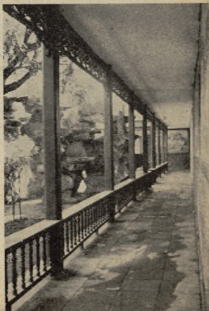
Pérgola o peristilo en torno al Instituto de Cristo Rey

Son las religiosas que componen la naciente comunidad: