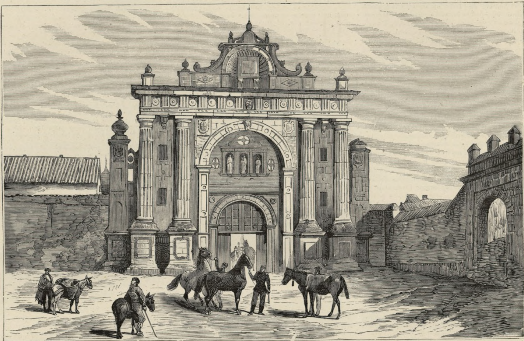
CARTUJA DE JEREZ.—DEPÓSITO DE CABALLOS SEMENTALES.

Consta el primer depósito, situado en Jerez de la Frontera, de 95 caballos, deducidos de los cuales 56 que están concedidos á criadores, quedan para el servicio público 39; repartidos en los pueblos de Utrera, Carmona, Lebrija, Las Cabezas, Morón, Los Palacios y Montellano, en la provincia