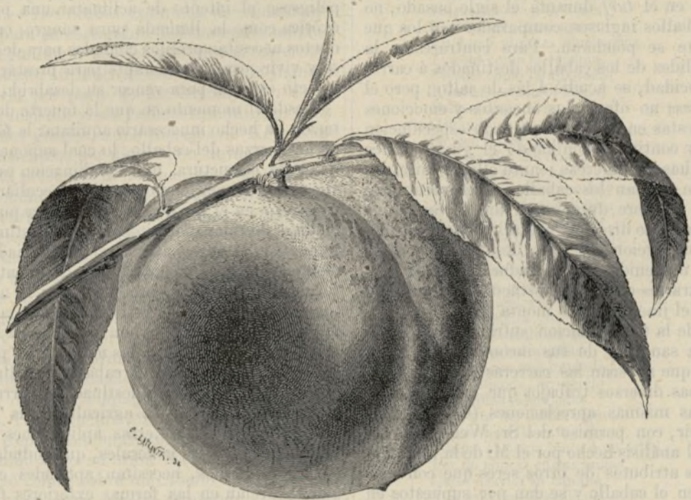
Pêche Galande ou Bellegarde.

No creemos que la aclimatacion de este árbol sea difícil en España, si bien es cierto que no podía prosperar indistintamente en todas las tierras; teme á la vez la humedad y la sequía; de manera que en una tierra de riego de donde no se escurran rápidamente las aguas del subsuelo perecerá, y tambien se malogrará en un terreno demasiado seco. Es preciso elegir por lo tanto un suelo de mucho fondo, naturalmente húmedo, pero sano y algo calizo. No deben traerse ingertos de un vivero, y ménos de un vivero extranjero, porque se secan