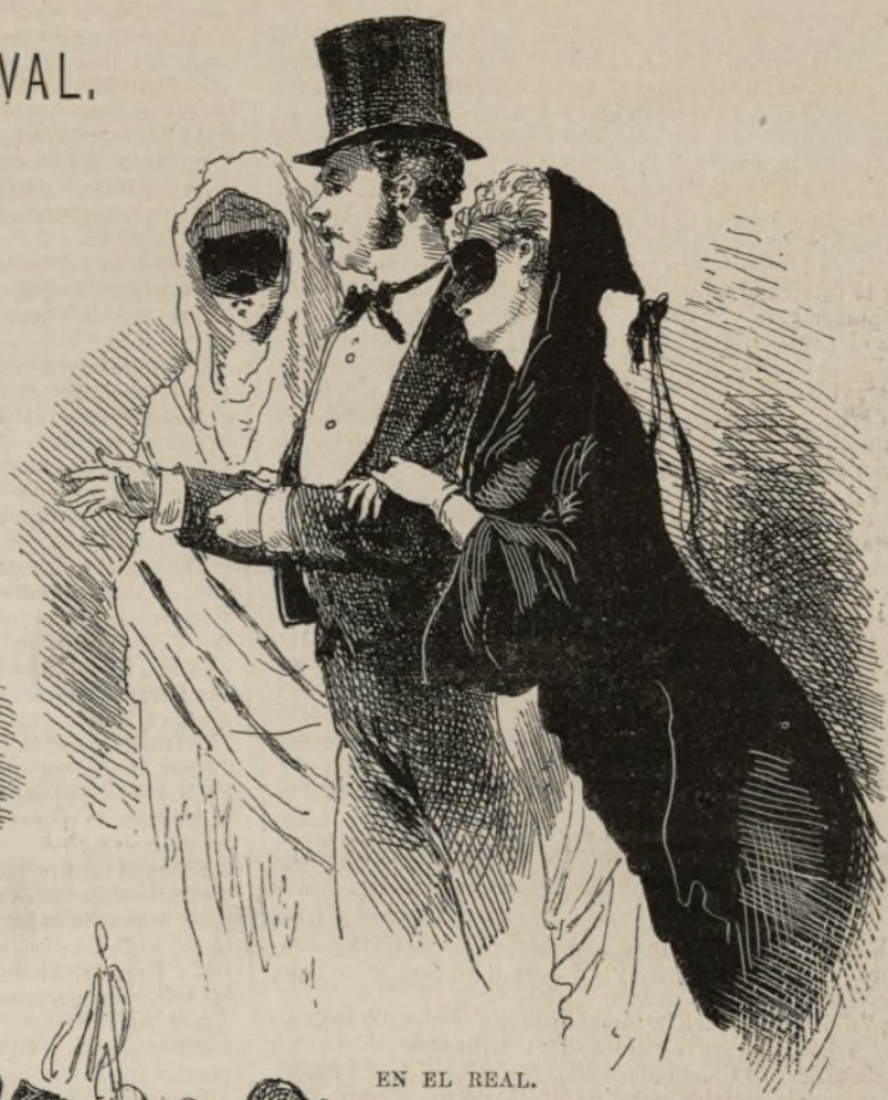
EN EL REAL.