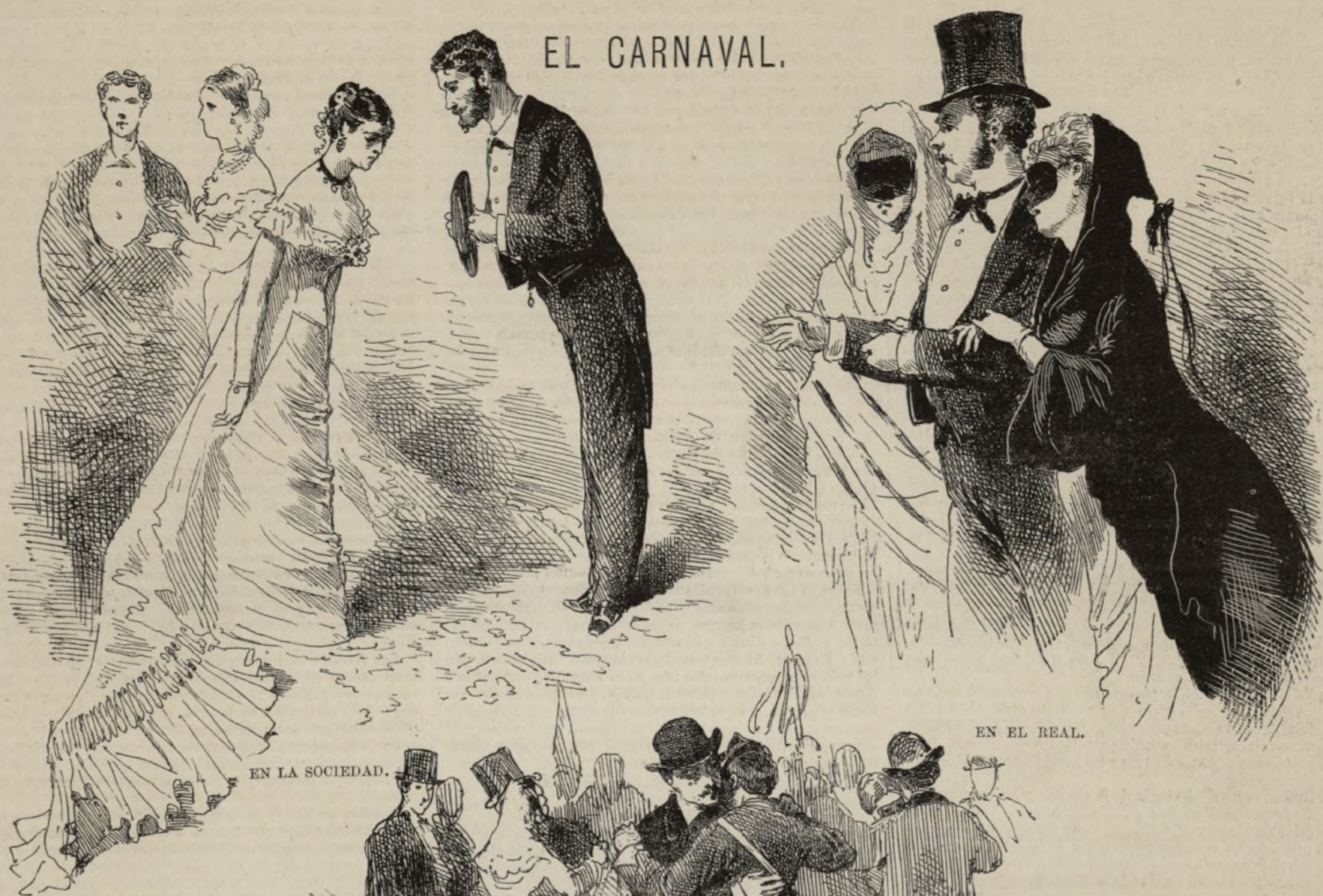
EN LA SOCIEDAD.