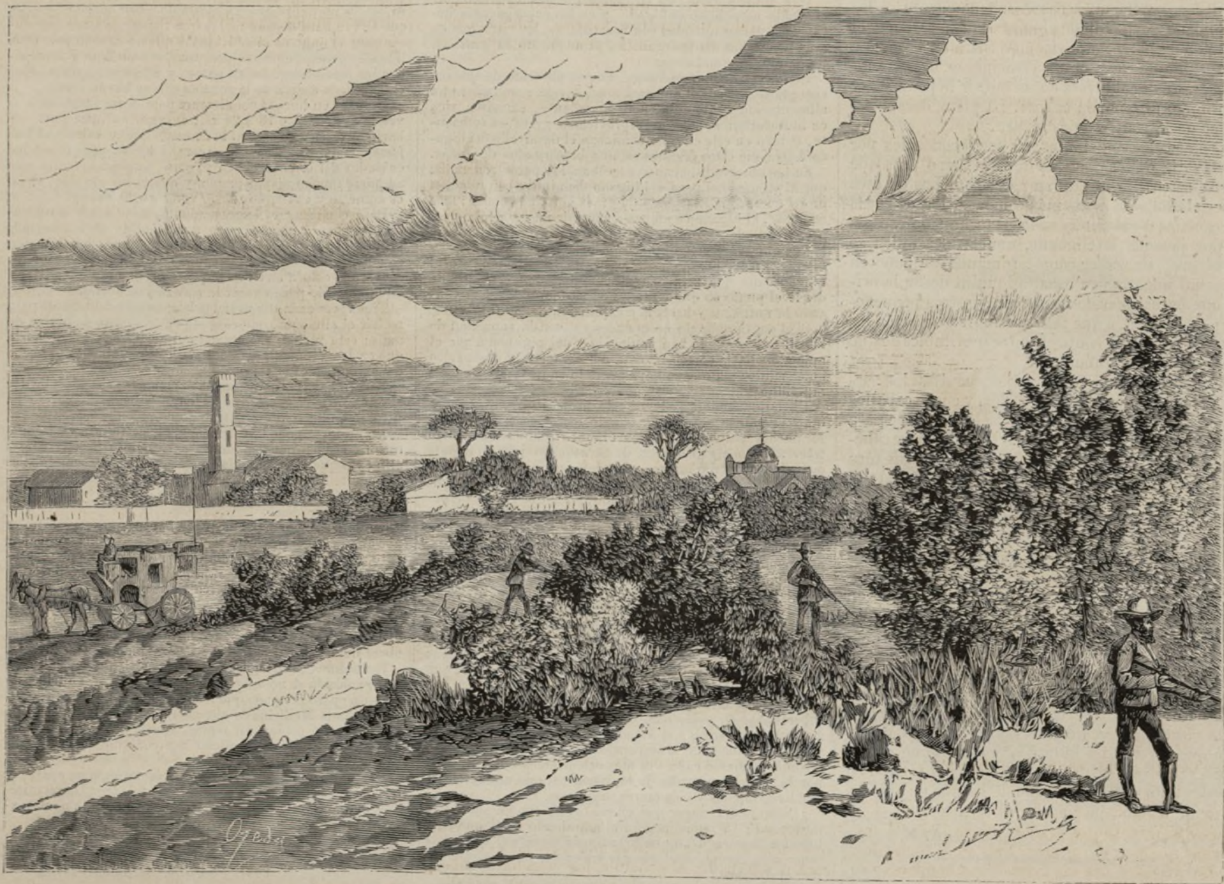
LOS LLANOS. PROPIEDAD DEL EXCMO. SR. MARQUÉS DE SALAMANCA.

Apénas atraviesa la puerta de hierro el Stage-coach , landó ó carretela en que se atraviesa el espacio que separa la Estacion de Albacete de Los Llanos , siente el espíritu impresiones agradables. Las fatigas, aunque ligeras, siempre molestas del viaje, han terminado; los goces de la caza y las alegrías de la vida del campo van á tocarse, y un instante despues se encuentra uno entre personas