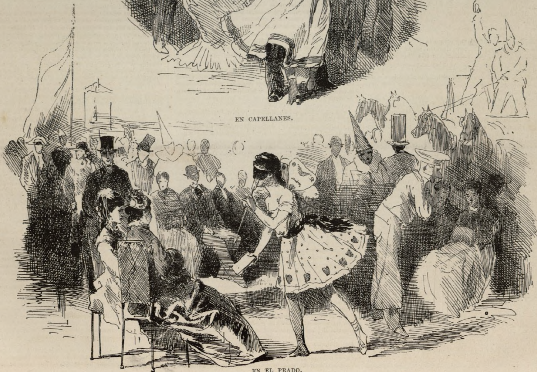
EN EL PRADO.