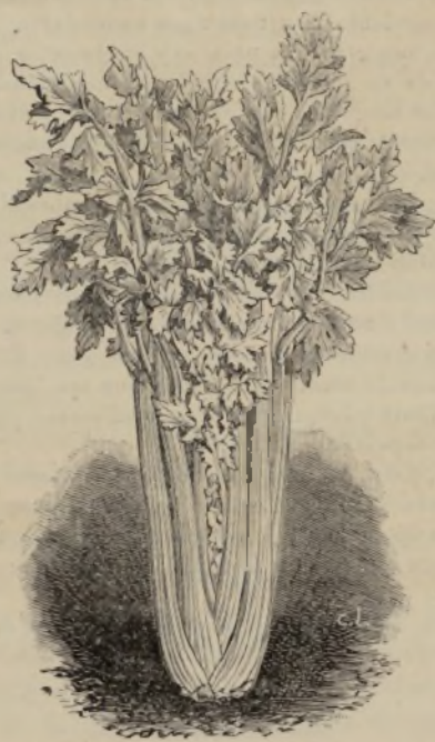
APIO LLENO BLANCO Á GROSSE CÔTE.