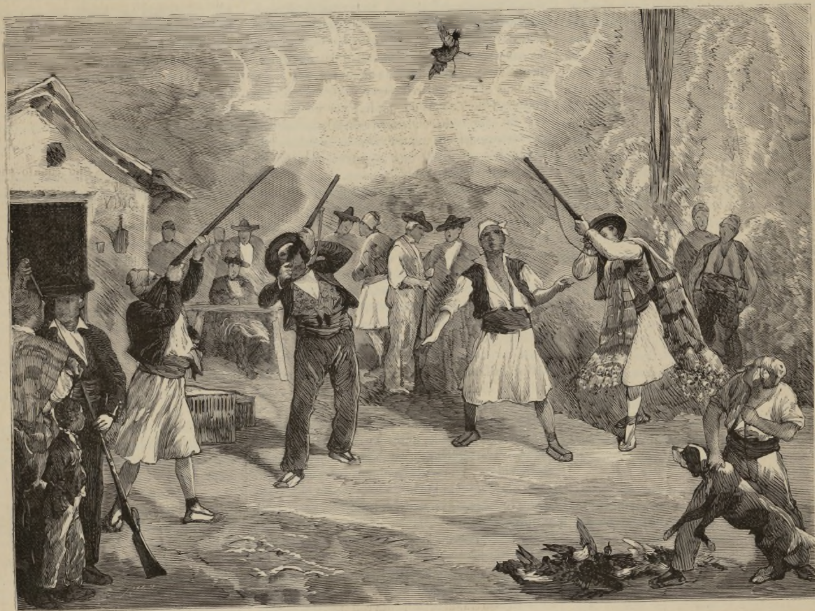
TIRO DE PALOMAS EN VALENCIA.

Dos clases de tiro hay en el del palomo. Llámase uno á broma , horrible sarcasmo para el pobre pájaro, y el otro á pacto . En el primero, lanzada al vuelo el ave por el colombaire , precisamente por