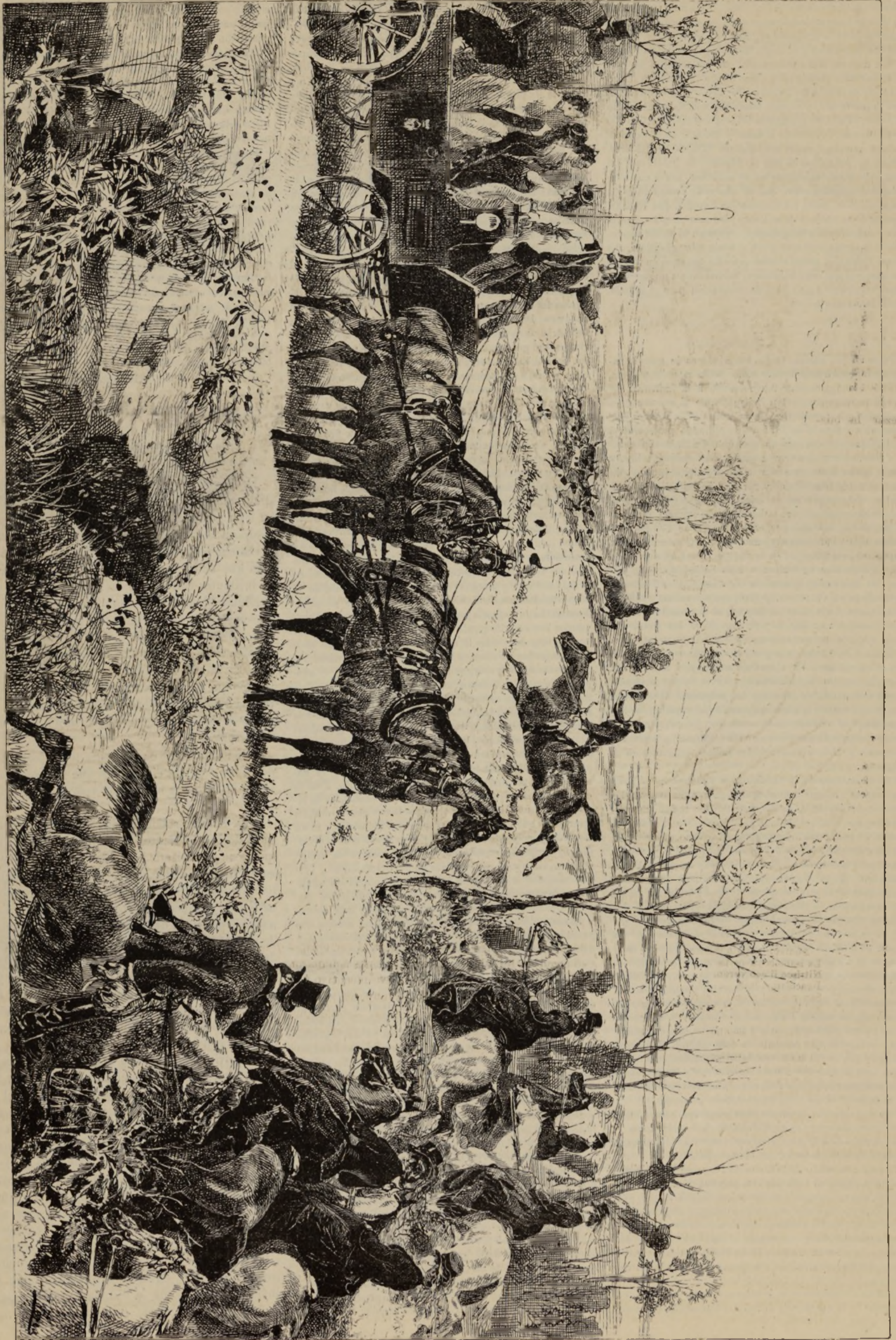
ULTIMO DIA DE CAZA.