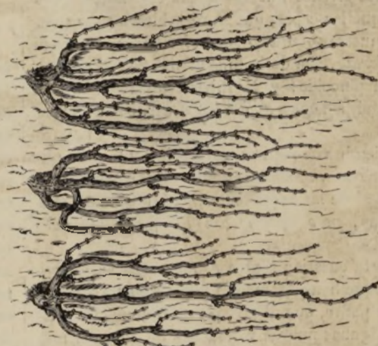
PARRAS RASTRERAS DE TRES BRAZOS. Figura 4.ª

Andiam, oh mia diletta, La isabella l'aspetta, Nitrisce il suo veron. I cacciatori lesti Son già qui pronti e lesti Sul braccio il suo falcon.