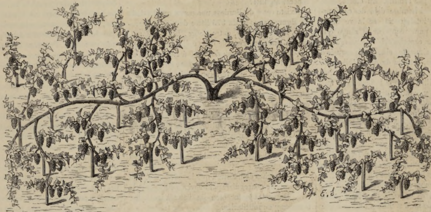
GUÍA SOSTENIDA POR HORQUILLAS. Figura 1.ª

Terminado el almuerzo, se recorrieron los hermosos jardines del palacio, presentándose luego amazonas y jinetes para empezar la busca, á los sones de la trompa, que nos recordaba aquel precioso aire de caza del inspirado Gounod, que dice: