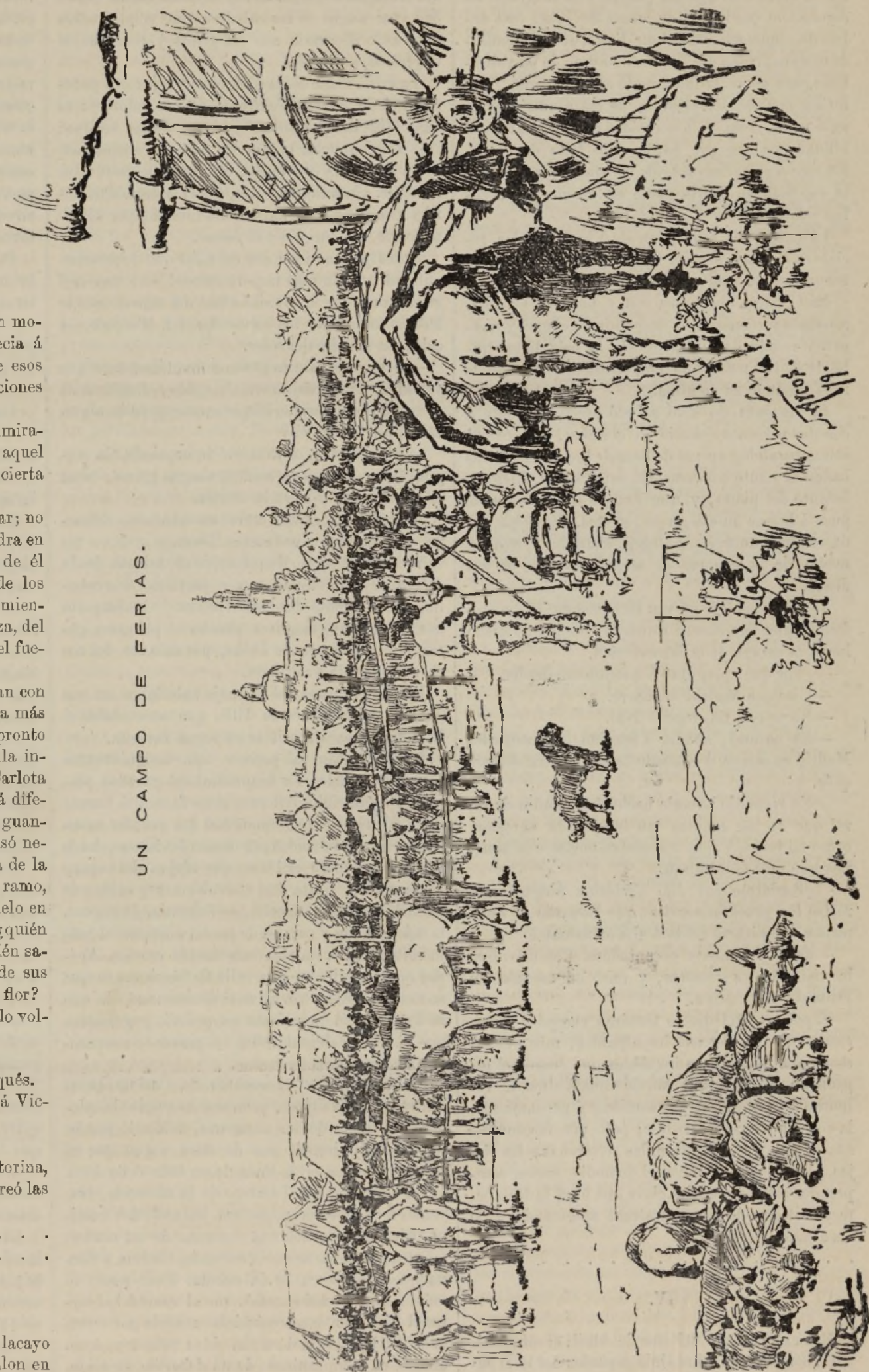
UN CAMPO DE FERIAS.

vamente de las teclas las manos de Elena. Una mirada sobrehumana que penetraba en el fondo de los corazones, hubiera descubierto que no eran las cuerdas del piano las que únicamente vibraban en aquel momento; un espíritu observador y de buena memoria habría notado en el lindo rostro de