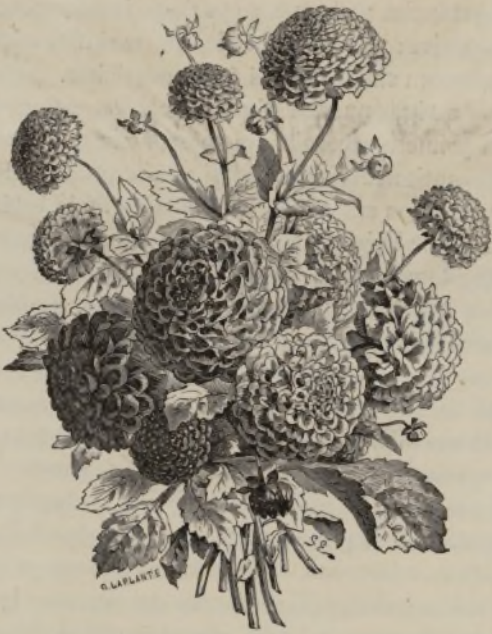
LA DAHLIA VARIABILIS.

tardo, aparecieron algunas dobles ó llenas, y poco á poco se perfeccionaron en la forma. Hoy el número de variedades hermosas es inmenso, y cada año, sin embargo, se presentan muchas otras nuevas que son indisputablemente superiores á las antiguas. Tenemos á la vista un catálogo que contiene más de mil variedades, todas con sus correspondientes nombres. Dar un nombre á cada variedad de rosa, de clavel, de camelia, y de toda especie que ofrece un gran número de variedades, es una excelente costumbre que deseamos verse aclimatar en España, porque es el único modo de poder entenderse sobre sus respectivos méritos. Quien dice que ha visto un hermoso rosal cubierto de rosas de un encarnado muy vivo, nada nos dice; pero si añade que era el Gigante de las batallas ó el Triunfo de la Exposición , sabemos al punto de qué variedad habla y podemos ofrecerle cien ó mil